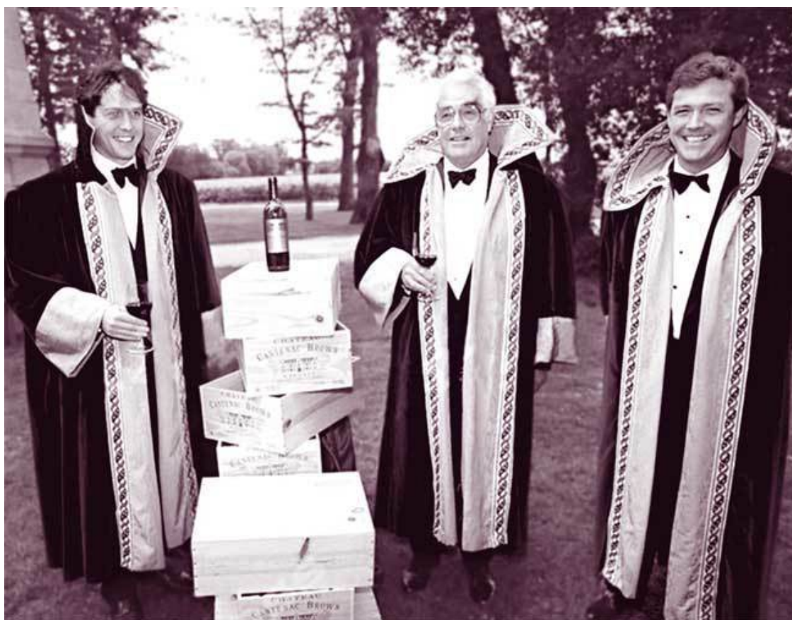
Хью Грант с отцом и братом

Медсестра повела его в медицинский кабинет и привела рану мальчика в порядок, правда, все равно нужно было ехать в больницу. Пришлось даже наложить швы, благодаря чему на ангельском личике Гранта появился очень мужественный и очень эффектный шрам. Так жизнь неожиданно подбросила мальчику возможность передохнуть и насладиться успехом среди сверстников.