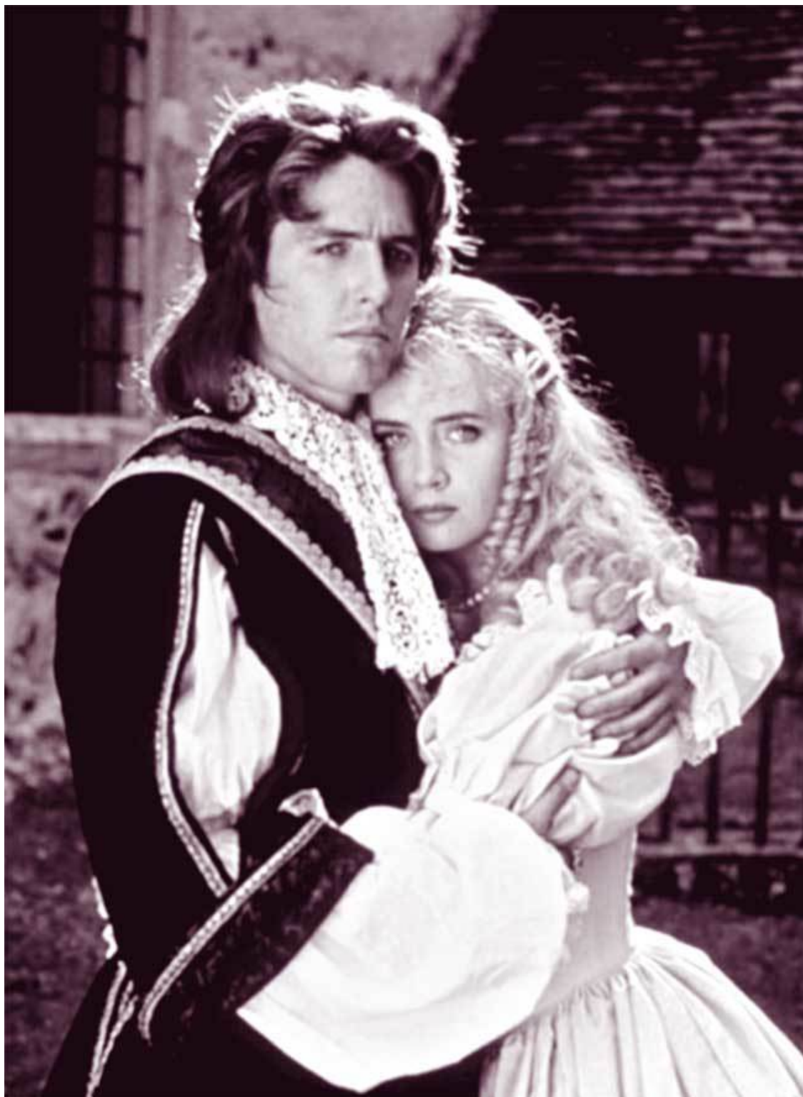
Хью Грант и Эмма Сэммс в фильме «Леди и разбойник»

Тот случай во многом сформировал личность Хью, сформировал его вечное стремление к недозволенному и вечный страх перед ним.