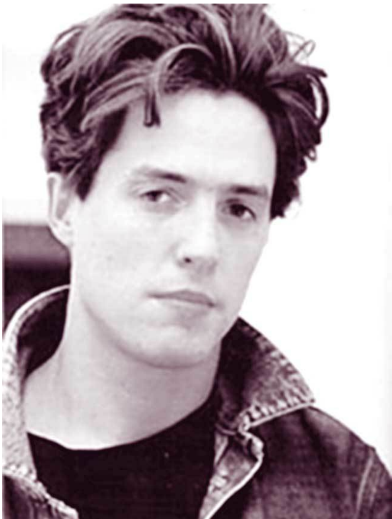
За роль лорда Адриана в фильме «Привилегированные»