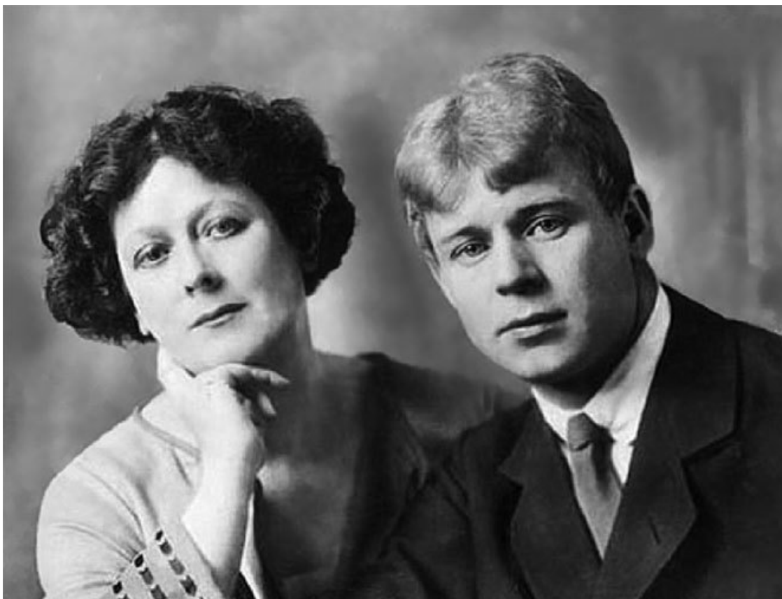
Сергей Есенин и Айседора Дункан

Есенину решение вернуться давалось нелегко.