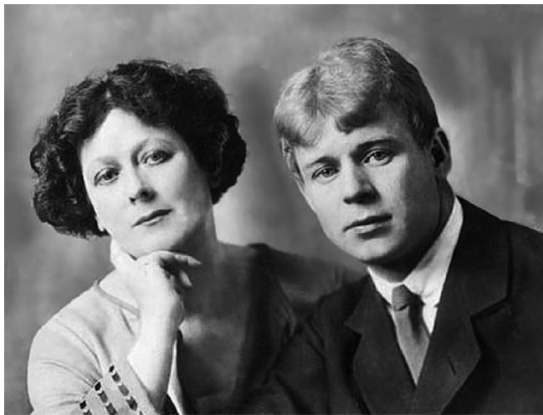
Серей Есенин и Айседора Дункан

Есенину решение вернуться давалось нелегко.