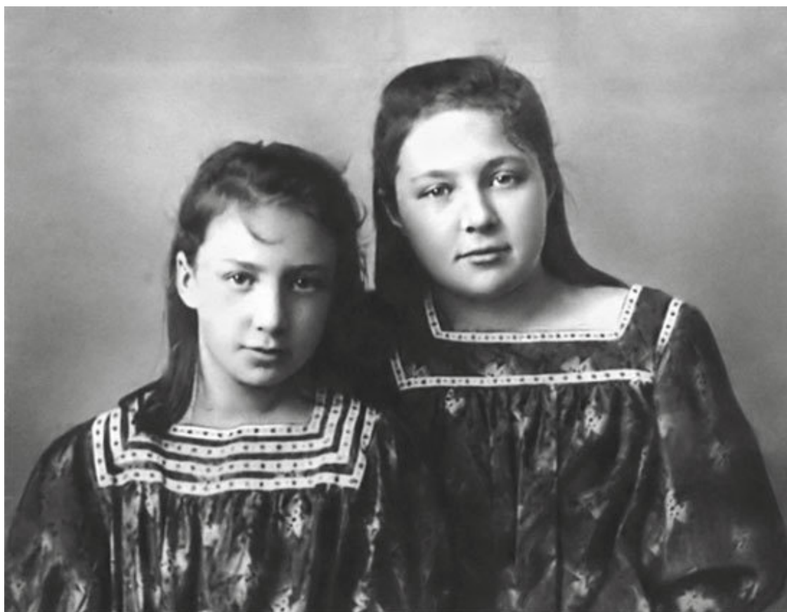
Анастасия и Марина Цветаевы, 1905 г.

Особенно любила романы Толстого и Достоевского. Чтение зачастую заменяло ей реальную жизнь, реальное общение с людьми. Она жила жизнью своих любимых героев, следовала за перипетиями их судеб, радовалась, ликовала, плакала и страдала вместе с ними.