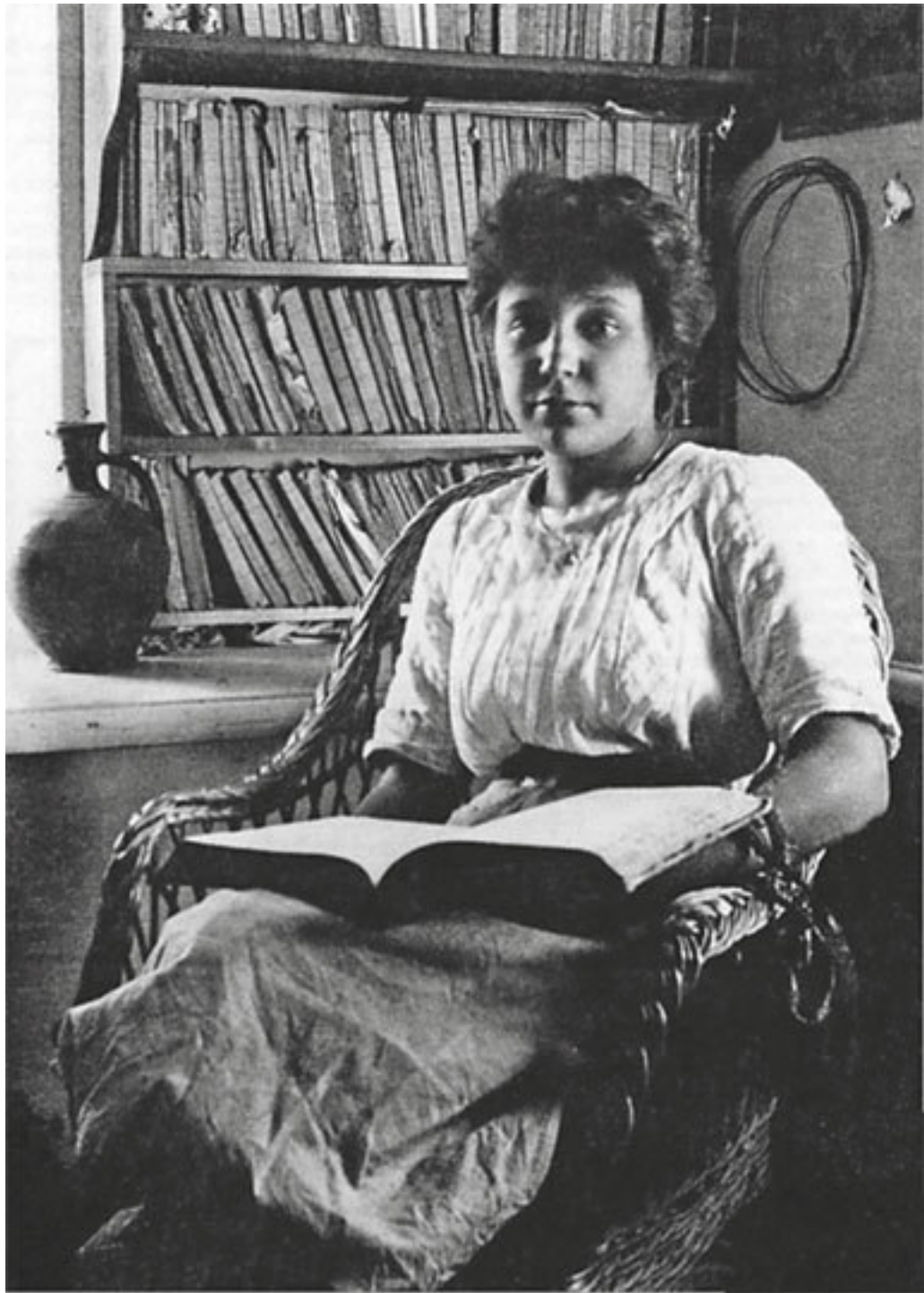
Марина Цветаева, 1911 г.