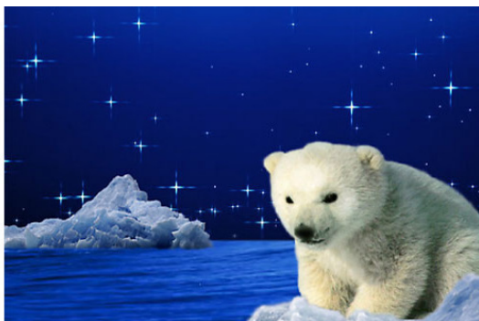
(Белый медвежонок Умка)

Лапу он зимой сосет, Летом ест малину, мёд. По тайге ночами рыщет, Добывает себе пищу. А когда зима придет, Вновь в берлоге он уснёт.