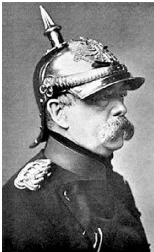
Бисмарк на посту канцлера Германии, 1871

Остзейские немцы внимательно следили за событиями в германских землях, набирались немецкого национального духа и... стали помышлять о создании немецкого государства в Лифляндии.