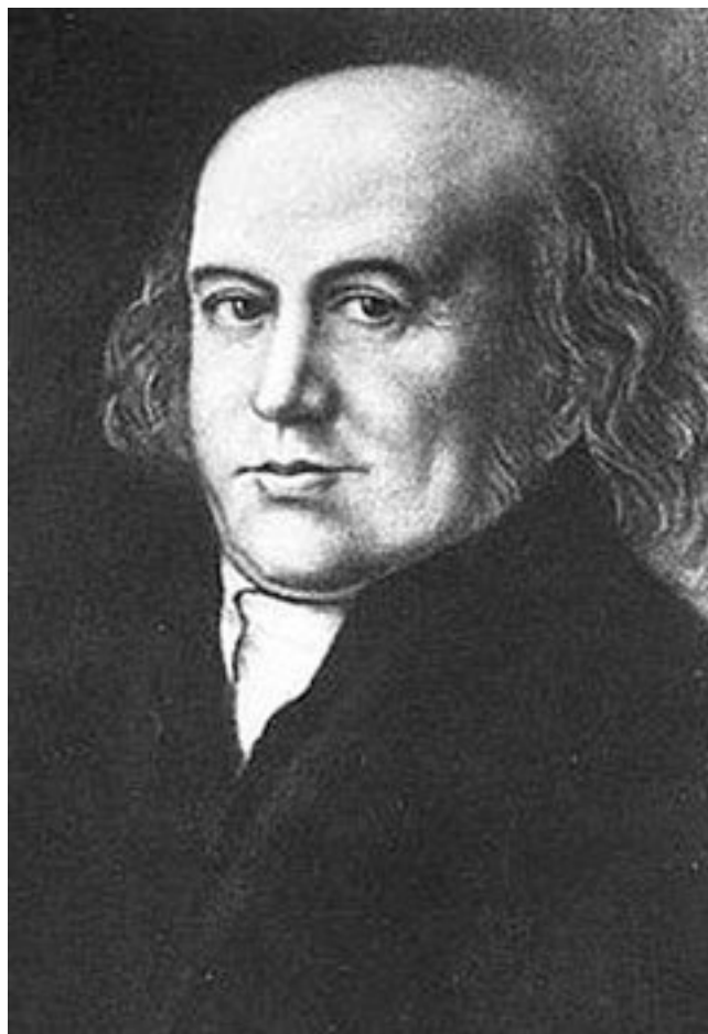
Гарлиб Меркель (1769–1860) – немецкий просветитель из Лифляндии

О туземном населении – латышах – Гарлиб Меркель пишет безжалостно. Он считал, что «вообще рабская пугливость и недоверие – самые выдающиеся черты в характере ливонского крестьянина. За 30 шагов, проходя мимо помещичьего дома, он снимает шляпу и приседает (нельзя сказать, кланяется) при всяком взгляде на помещика. Потом он крадетя, понунив голову, чтобы поцеловать у него кафтан или ногу. Если тот заговорит с ним, он подозревает при всяком вопросе своекорыстную хитрость и отвечает двусмысленно».