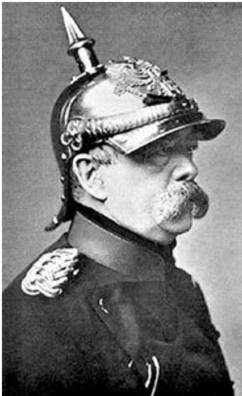
Бисмарк на посту канцлера Германии, 1871

Остзейские немцы внимательно следили за событиями в германских землях, набирались немецкого национального духа и... стали помышлять о создании немецкого государства в Лифляндии.