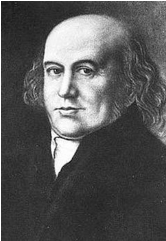
Гарлиб Меркель (1769–1860) – немецкий просветитель из Лифляндии