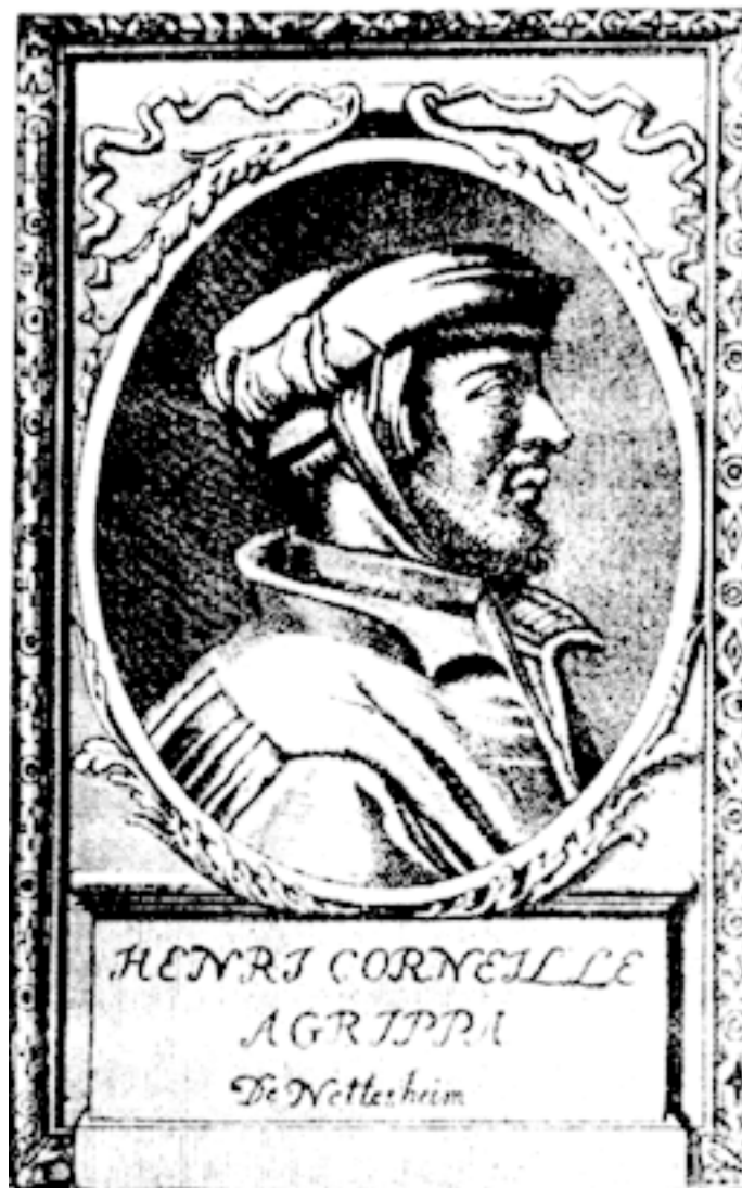
Агриппа Неттесхеймский (со старинной гравюры)