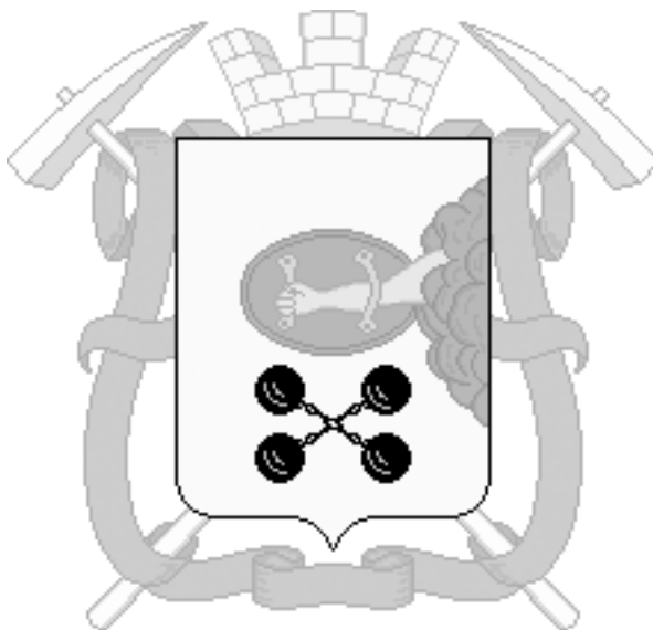
Официальный герб Петрозаводска, утверждённый в 1784 г.

«Екатерина II в ознаменование результативных поисков лозоходцев Карелии даже издала указ о включении в герб Петрозаводска изображения биолокационной рамки» ( http://anomalialia.kulischki.ru/text8/897.htm )