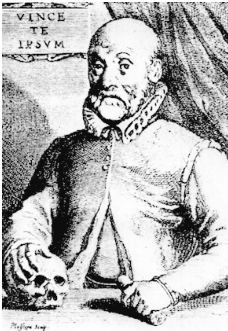
Йоган Вейер (с гравюры 1576 г.)

Впрочем, скептицизм Филиппа Ауреола Теофраста Бомбаста фон Гогенгейма (Парацельса) и Агриколы разделяли и тогда, и позднее далеко не все. Известные учёные – физик Роберт Бойль, минералог Уильям Прайс, химик Иоганн Рудольф Глаубер (в сочинении «Рудничное дело»), Бенджамен Реслер, Александр Гумбольдт и многие, многие другие пытались оценить целесообразность применения лозоходства и понять причины, порождающие эту таинственную способность человека, резко критикуя при этом Агриколу.