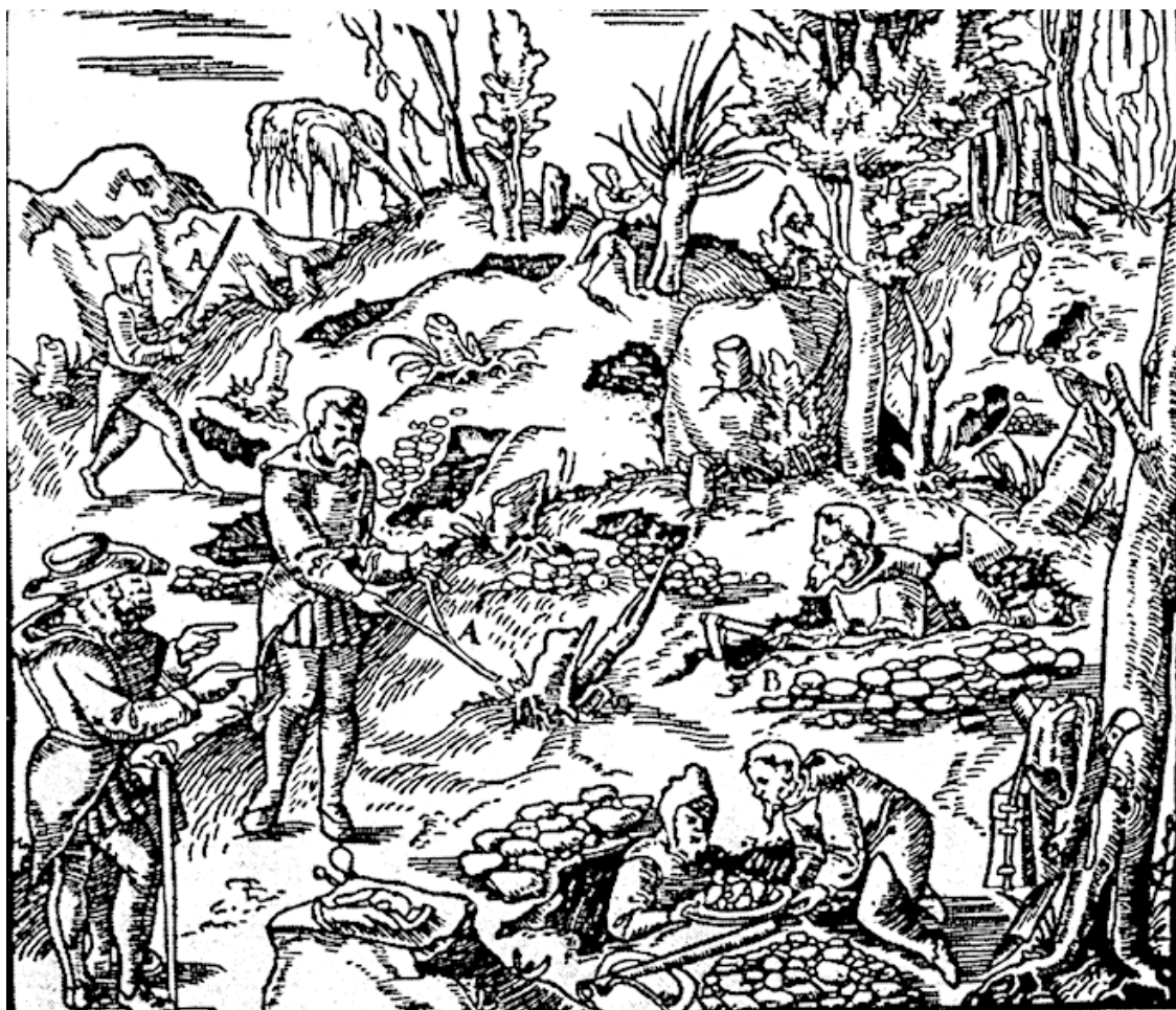
Лозоходцы в поисках рудных залежей (со старинной гравюры)

У них было немало оснований для серьёзной критики, но и пищи для размышлений хватало: громадная часть известных и используемых с древних времён залежей руд и водных источников в Европе была найдена именно благодаря использованию лозы и маятника.