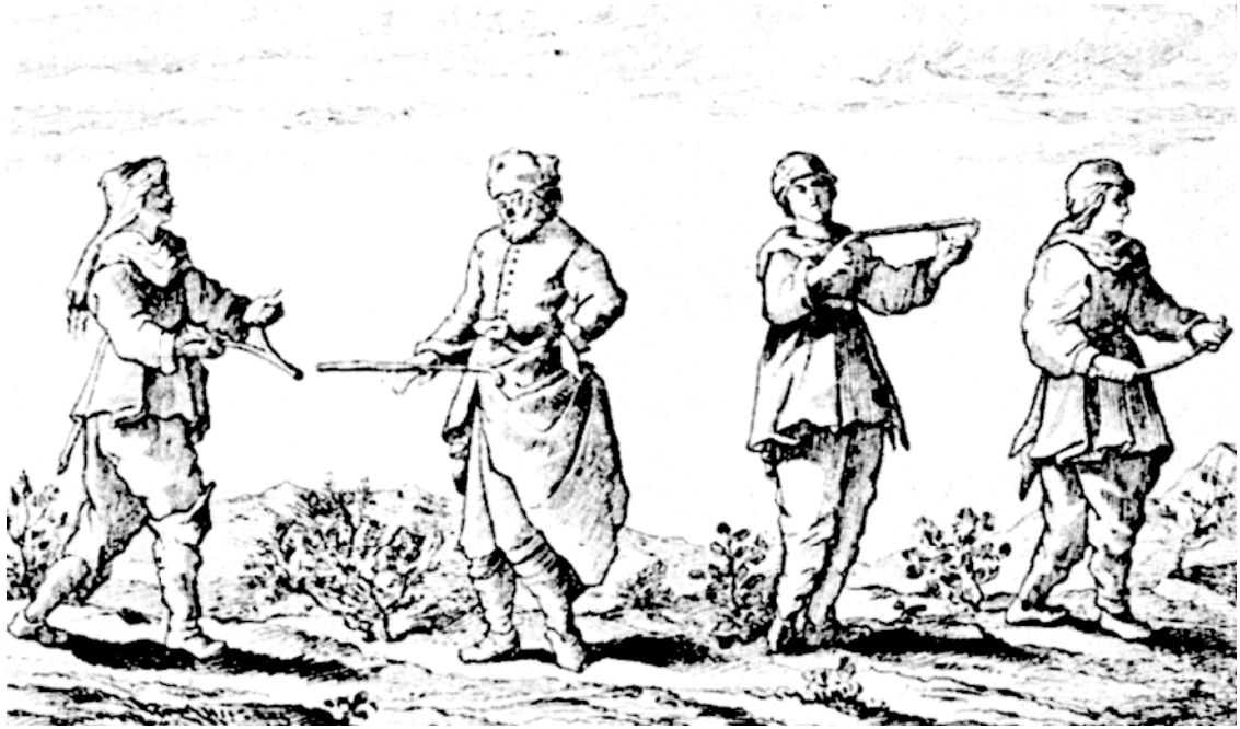
Различные способы удержания «волшебных палочек» (гравюра из книги аббата де Валлемона)

«Вечером перед рукоположением приехал еп. Нектарий. Он хотел присутствовать на последней литургии, которую отцы проведут в разных санах. После службы он побеседовал с отцами в царской часовне. В это время из Хейфорка приехал лозоход – он должен был определить место для колодца. Оказалось, что он, бедняга, не мог отыскать монастырь! Отец Серафим рассудил: “Что ж, видно, на то воля Божья, чтоб этому человеку явиться при епископе Нектарии”.