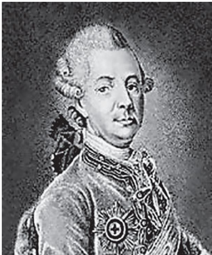
Князь М.М. Щербатов (гравюра с прижизненного портрета)

Первый герб Петрозаводска был утверждён императрицей Екатериной II 16 августа 1781 года (закон № 15209) вместе с другими гербами Новгородского наместничества: «В верхней части щита герб новгородский, в нижней части на разделенном полосами, золотом и зеленою краскою поле, три железных молота, покрытые рудоискательскою лозою, в знак изобилия руд и многих заводов, обретающихся в сей области».