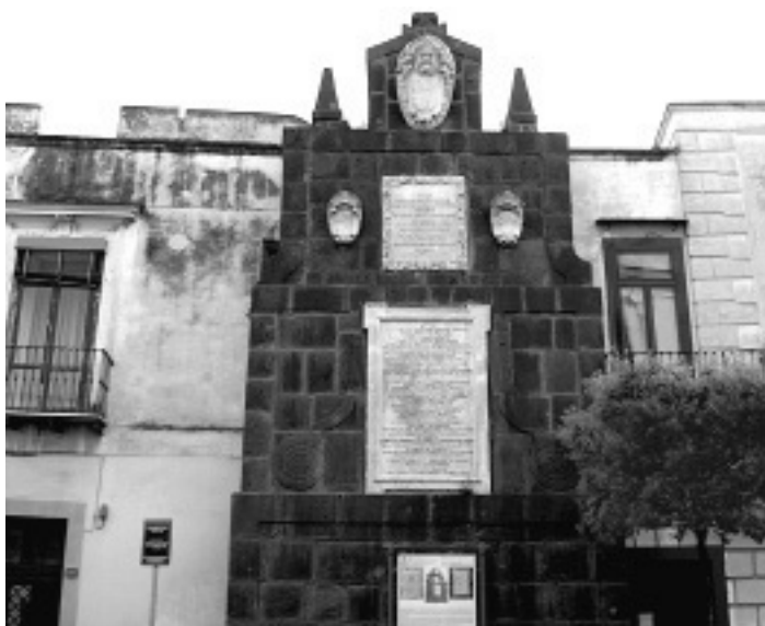
Рис. 1. Вилла Фараоне Меннелла в Торре дель Греко.

На одной из них в списке пострадавших городов, наряду с и ныне здравствующими Ресиной и Портичи, упоминаются, якобы исчезнувшие за полторы тысячи лет до этого, города ПОМПЕИ и ГЕРКУЛАНУМ!!!