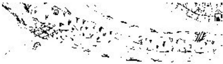
Рис. 2б. Фрагмент карты-схемы Ушакова с мостами через Днепр и реку Почайну (прорисовка)

повторно много веков спустя, что отражено на карте-схеме Ушакова 1695 года. На ней схематично показан перевоз, подобный описанному выше. Он состоял из двух частей. Одна соединяла левый берег Днепра с Рыбальским островом, который в те времена был длиннее, другая была перекинута через реку Почайну и соединяла остров с правым берегом. На рис. 2а показан фрагмент карты-схемы Ушакова с перевозом через Днепр. На карте-схеме виден бревенчатый настил, торчащие из воды сваи (колья, кии), к которым привязаны лодки, находящиеся под настилом. Разводная секция расположена у правого берега Днепра. Для пропуска судов она подтягивалась вверх, к свае, более удаленной от перевоза, чем остальные. Видно также, что эта секция имеет слегка клинообразную форму, необходимую для ее плотного соединения с настилом при постановке на место.