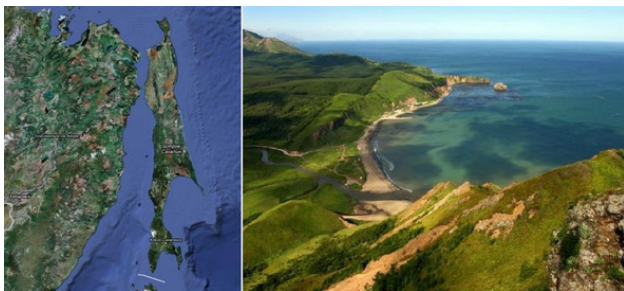
Фото острова Сахалин снято с космоса. Второе фото морского побережья в районе города Чехова.

Поезд прибыл на конечную станцию материка Советская Гавань, где паромная переправа с материка на остров Сахалин. Материк тут заканчивался и начинался Тихий океан. Край Света.