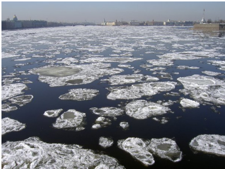
Весенний ледоход на реке.