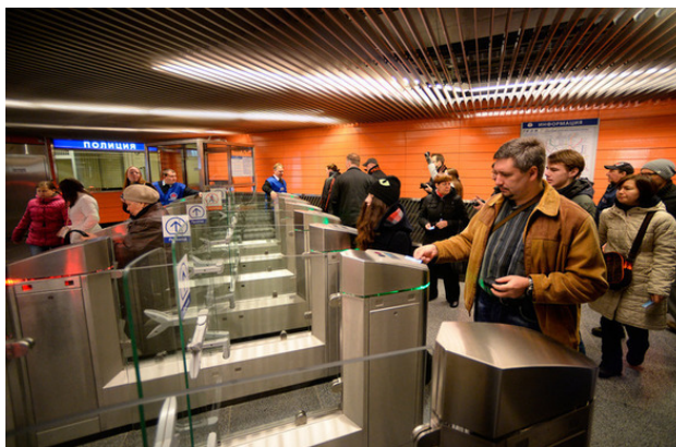
Рис. 2. «Линейка» турникетов вестибюля станции