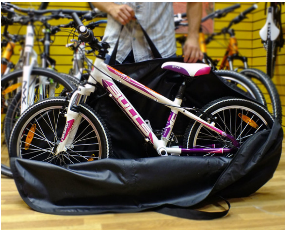
Рис. 6. Нескладной велосипед в чехле разрешен к провозу Правилами пользования метрополитеном в качестве багажа при условии оплаты

2. Силами ОТБ предлагается пассажиру задрапировать велосипед чехлом (рис. 6) и оплатить дополнительный билет для провоза багажа. В этом случае допускается перемещать велосипед в перевозочный сектор ЗТБ в качестве багажа.