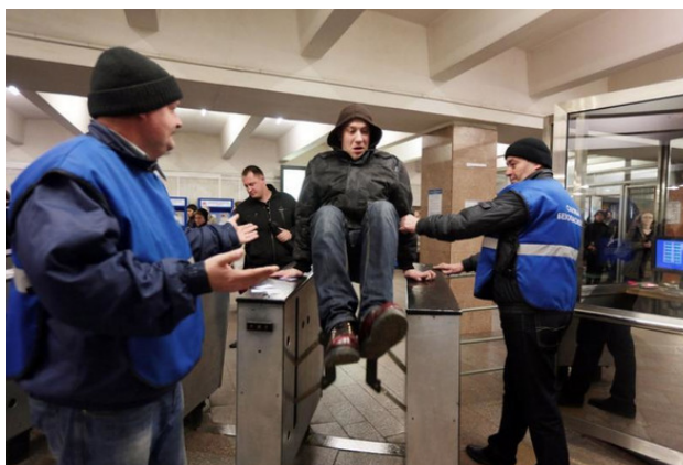
Рис. 1. Пример попытки несанкционированного прохода в перевозочный сектор метрополитена

Попытки пассажиров силой «прорваться» через закрытые створки турникетов в перевозочный сектор ЗТБ (рис. 1) являются с точки зрения 16 – ФЗ Ст. 1, п.1 актами незаконного вмешательства и подлежат пресечению Силами ОТБ.