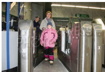
Рис. 3. Проход с ребенком через турникет

Работникам из числа Сил ОТБ разъяснить пассажиру в вежливой и культурной форме, что они понимают сложность экономической ситуации, и что ребенок не зарабатывает, но Правила пользования Московским метрополитеном – это закон. Закон обязателен к исполнению всеми лицами, следующими, либо находящимися на ОТИ метрополитена. В противном случае данные пассажиры с детьми квалифицируются по своему поведению как лица, не имеющие правовых оснований для перемещения в ЗТБ.