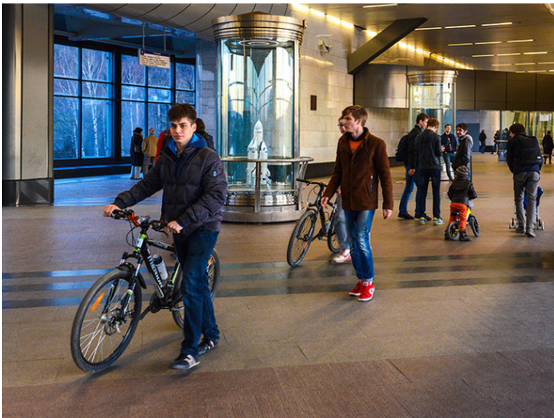
Рис. 4. Взрослый нескладной велосипед запрещен к провозу Правилами пользования метрополитеном