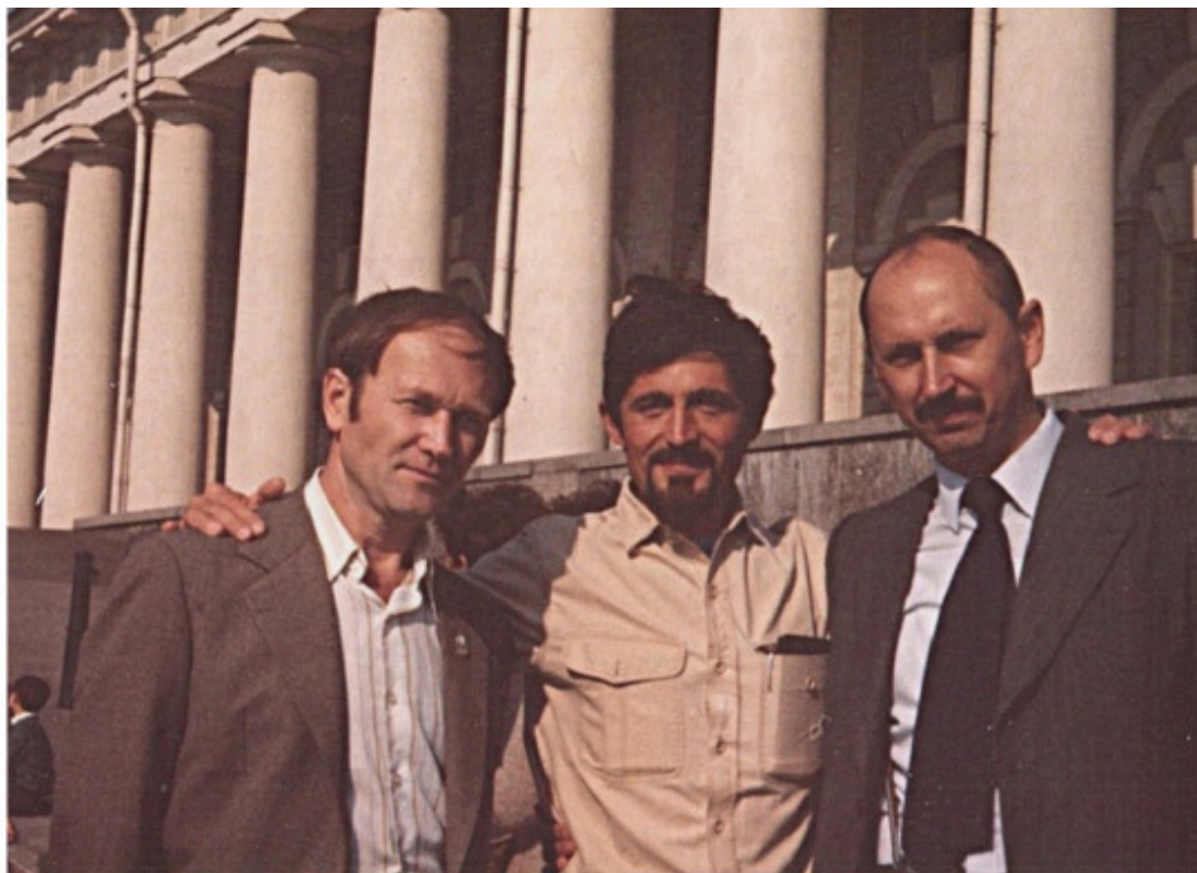
Автор, Ноэль Руссе, А.Зайцев (Москва)