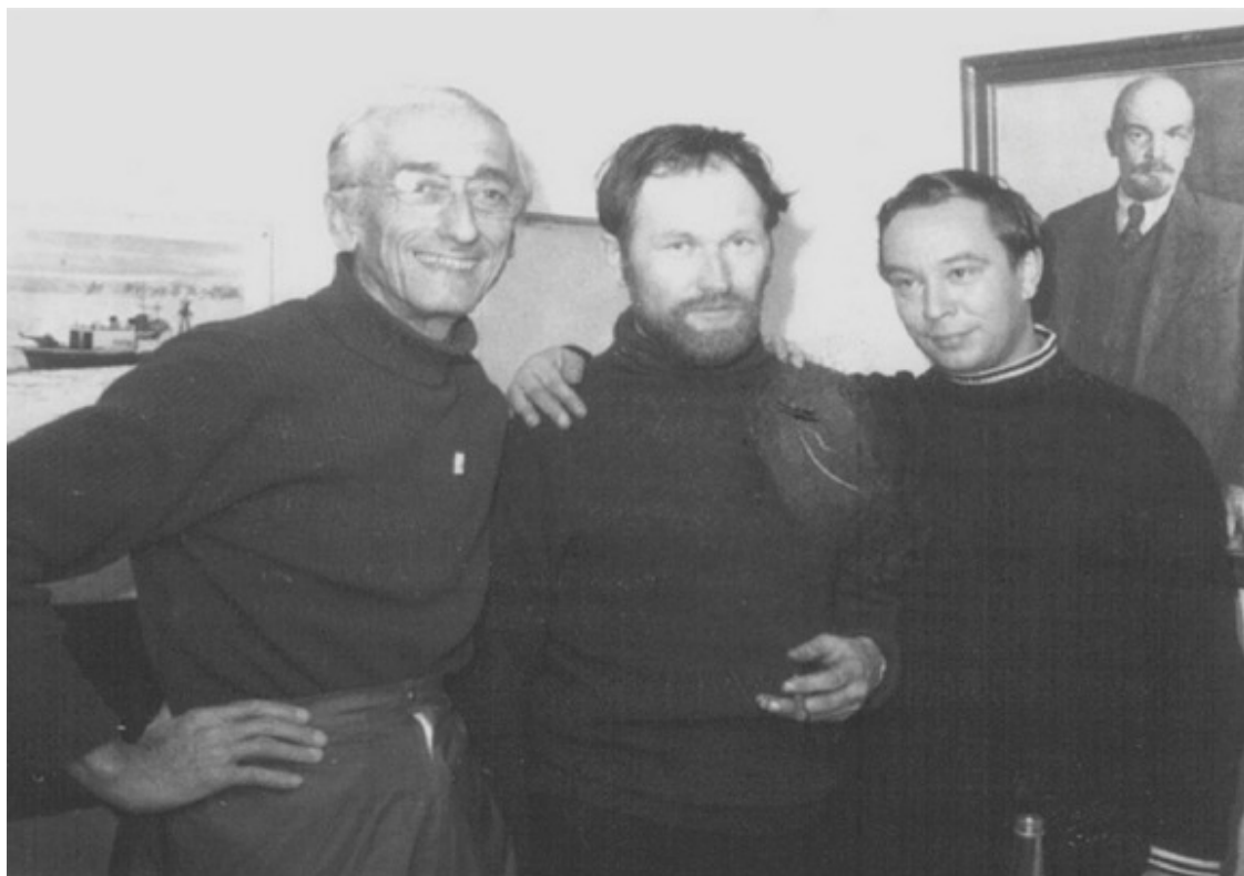
Жак Ив Кусто, автор и Л.Ажгихин