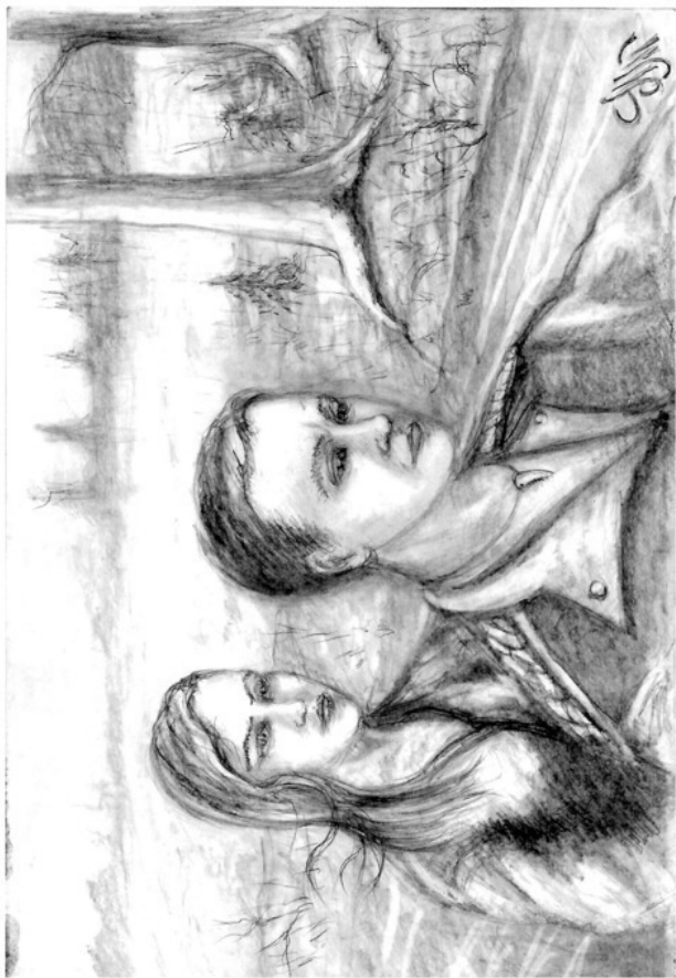
Въезжая в Лес