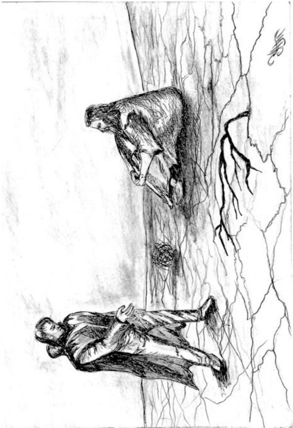
В пустыне с Иисусом