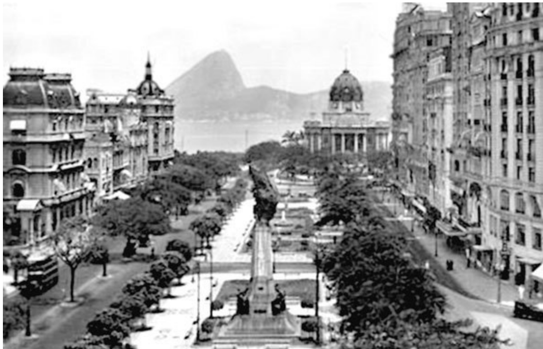
Рио-де-Жанейро на старом фото

был мальчиком подвижным, и чем становился старше, тем менее усидчивым, и в то же время упрямым, самостоятельным – и в мыслях и в делах своих.