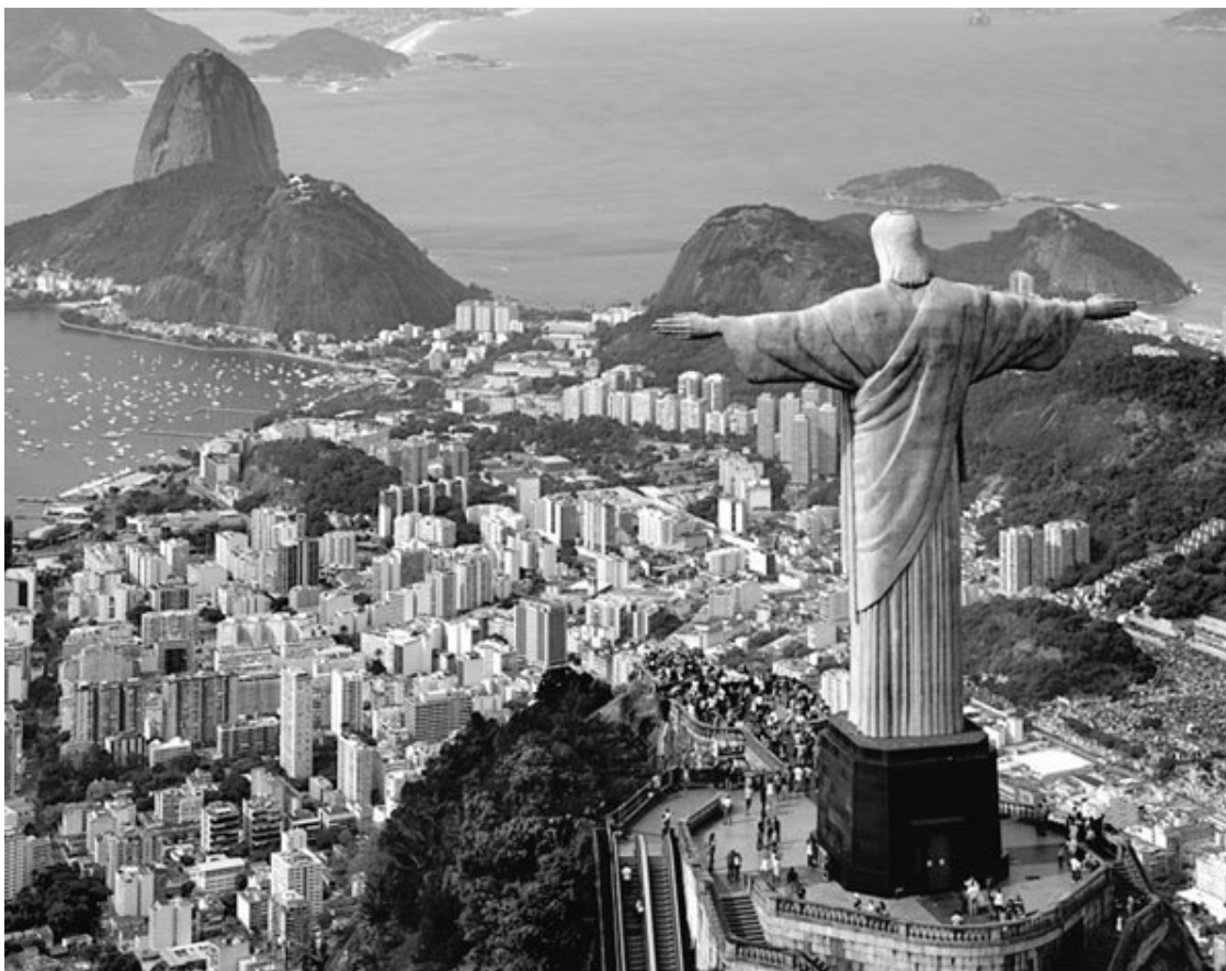
Рио-де-Жанейро – родной город Пауло Коэльо

Родился в Рио-де-Жанейро в благополучной семье инженера Педро Кейма и Элизии Ара-рипе Коэльо в квартале Ботафого (здесь жили представители среднего класса), 24 августа 1947 года, под знаком Девы. Родился он – и в этом предмет его особой гордости – в тот же день, в тот же месяц и под тем же знаком Зодиака, что и его кумир, Хорхе Луис Борхес, человек, творчеству которого Пауло поклоняется и сегодня.