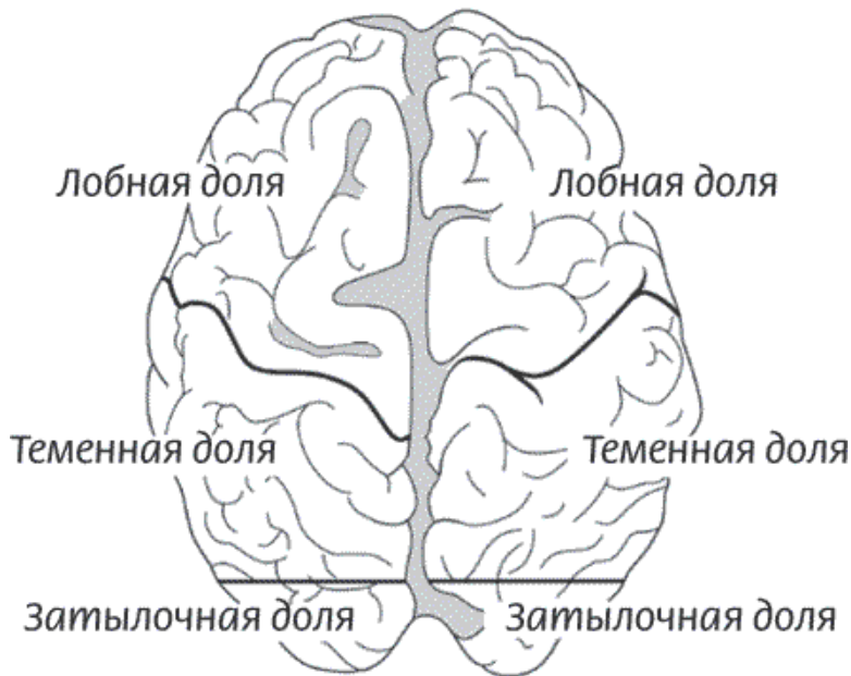
Рисунок 3. Доли больших полушарий, вид слева и сверху

Вместе разные области коры мозга наделяют нас способностью мыслить аналитически, видеть последствия своих поступков и планировать будущее. Кора головного мозга делает из нас математиков, поэтов и композиторов.