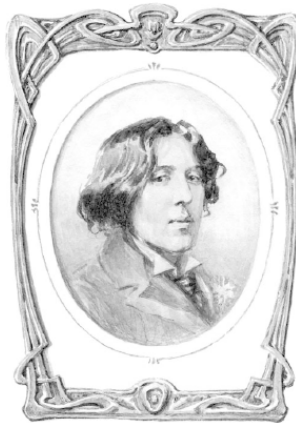
Оскар Уайльд 1854—1900