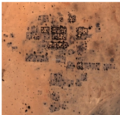
Северный Дарфур, Судан, 2003 и 2006[3]

Сегодня самые распространенные фотографии «до и после» – это фотографии, сделанные со спутника, и они опять же являются продуктом несовершенства фотографического процесса. Спутникам требуется время, чтобы облететь планету по орбите, а это значит, что они могут фиксировать происходящее в некоем месте лишь с определенными интервалами. Поскольку фотографии отделяет друг от друга временной промежуток (самые скоростные спутники облетают Землю за 90 минут, но на больших высотах на это уходит несколько часов), ключевое событие зачастую бывает упущено. Кроме того, сегодня международные правила ограничивают разрешающую способность снимков, находящихся в общем доступе, 50 см на пиксель (каждому участку размером 50 см соответствует неделимая цветокодированная поверхность). У государственных агентств есть доступ к снимкам более высокого разрешения, но для общедоступных изображений ограничение разрешающей способности устанавливалось с тем расчетом, чтобы на них не отображались люди[4].