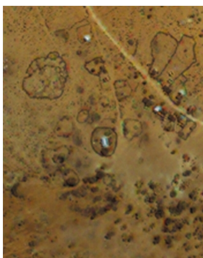
Сенафе, Эритрея, 1999 и 2002 – до и после разрушения города эфиопской армией[2]