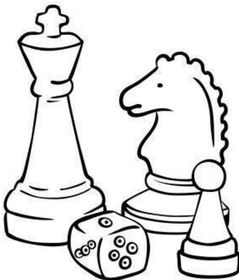
Жемчужина «Стратегические игры»