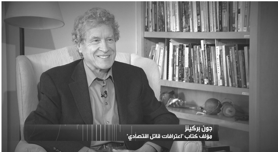
Джон Перкинс на интервью

страны, где он спровоцировал бурные события, и объяснил, почему его работа в буквальном смысле несла смерть. Среди клиентов Джона Перкинса были как латиноамериканские президенты, так и лидеры Саудовской Аравии и Египта.