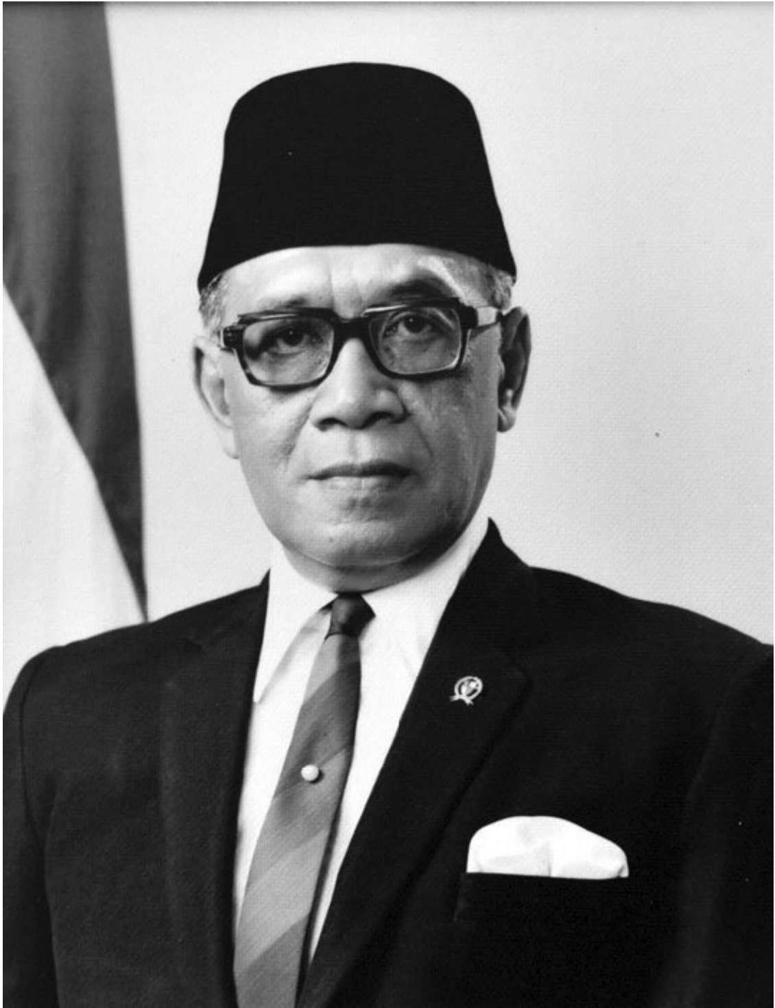
Президент Индонезии Сухарто

Ведущий: А разве у них не было, по крайней мере, своих экспертов, которые могли бы сами составить экономические прогнозы и понять, что то, что вы обещали, было нереальным?