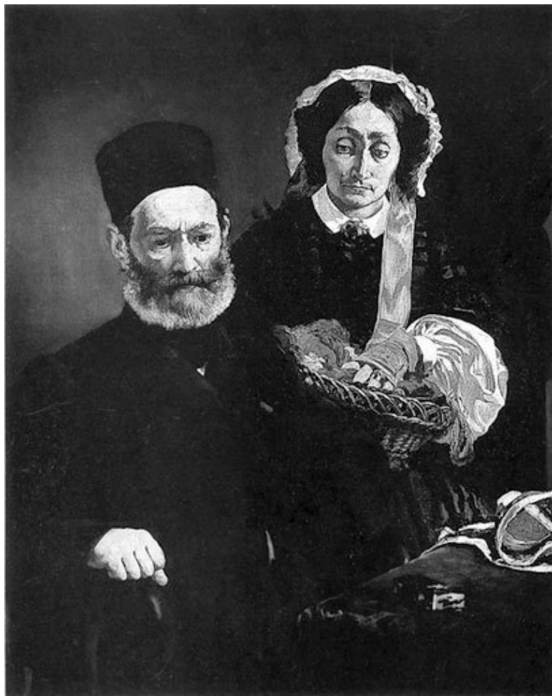
Эдуар Мане. Портрет господина и госпожи Огюст