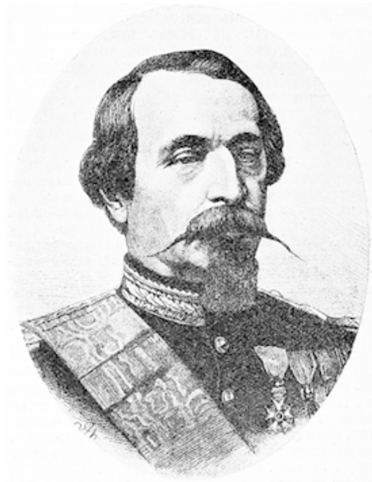
Луи-Наполеон Бонапарт (Наполеон III).