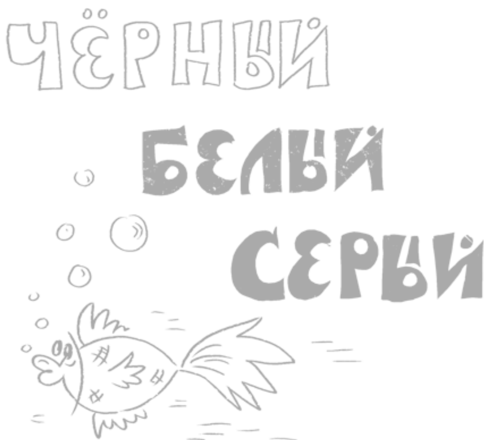
Рис. 2.1. Попробуйте быстро сказать, какого цвета первое, второе и третье слово. Рыба на картинке символизирует, что не выдать себя в этом тесте в состоянии только немой

Участники эксперимента, вынужденные наблюдать страдания живых существ и сдерживать естественные при этом эмоции, справлялись с тестом Струпа даже хуже русских шпионов. По версии Баумейстера, это вполне естественно: предыдущее задание настолько истощило их запас самоконтроля, что никакой возможности долго удерживать внимание на разноцветных буквах у них не осталось. В другом похожем опыте {3} испытуемых после просмотра грустного фильма заставляли максимально долго сжимать эспандер. Как и в эксперименте с тестом Струпа, часть добровольцев не получала никаких инструкций насчет просмотра. Оставшихся просили либо не изменять выражение лица и поведение, либо, наоборот, намеренно усиливать выражение чувств. Чтобы держать эспандер сжатым, нужно преодолеть дискомфорт или даже боль в руке – а у истощенных неестественным выражением эмоций участников не осталось внутреннего ресурса на такое испытание. До начала основного эксперимента "спокойные" добровольцы удерживали эспандер в среднем 71 секунду, после просмотра фильма этот показатель упал до 52 секунд. Для наигранно эмоциональных участников задание оказалось тоже сложным: при второй попытке удержать эспандер они продержались на 25 секунд меньше (54 секунды против 78). У испытуемых, смотревших кино в "обычном" режиме, разница составила всего две секунды.