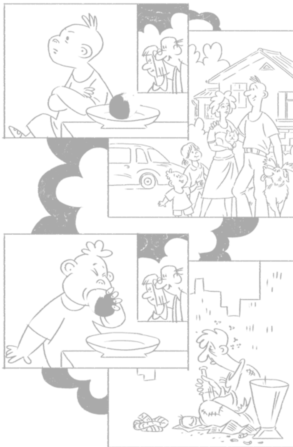
Рис. 1.1. Способность противостоять соблазнам лучше любых других критериев коррелирует с успехом в жизни и отсутствием зависимостей

В 2010 году большой коллектив исследователей из разных стран представил итоги 32-летнего наблюдения за тысячей детей, из которого следовал все тот же неутешительный вывод: