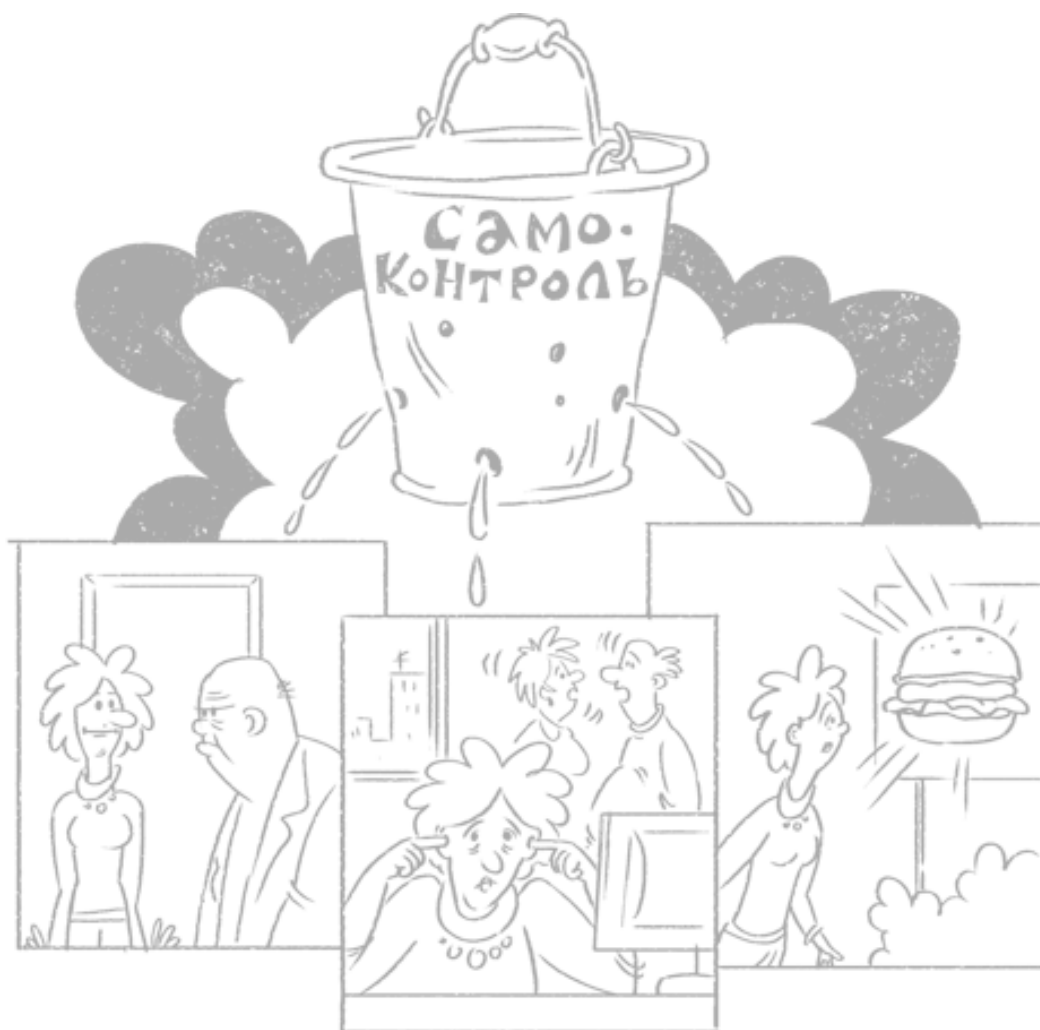
Рис. 2.2 Ситуации, которые требуют от нас сдерживать свои порывы, эмоционально насыщенные моменты и стресс истощают способность проявлять силу воли

В современном мире с его сложной структурой и огромным количеством социальных взаимодействий необходимость сдерживать эмоции нужна как воздух. Доисторические пещеры не отличались простором, так что даже самым заядлым мизантропам приходилось скрывать ненависть максимум к паре десятков других кроманьонцев своего племени. На случай, если сдержать чувства не получалось, у наших предков были каменные топоры. Сегодня мы ежедневно встречаем больше людей, чем древний Homo sapiens за всю жизнь. И частенько эти встречи приносят нам мало радости – например, свидания с сотней других пассажиров в метро в час пик или вынужденно тесные посиделки в коридоре поликлиники. Каменный топор, возможно, сгладил бы неудовольствие от давки и испорченных ботинок, но в XXI веке так решать вопросы не принято. Поэтому мы сквозь зубы бурчим здоровяку, который посчитал, что удобнее всего ехать в автобусе, улегшись на вас: "Извините, не могли бы вы подвинуться?" – и истощаем, истощаем наш бесценный ресурс самоконтроля. В итоге к моменту, когда нужно идти к начальству, чтобы обсудить повышение, внутри все готово взорваться от любой мелочи.