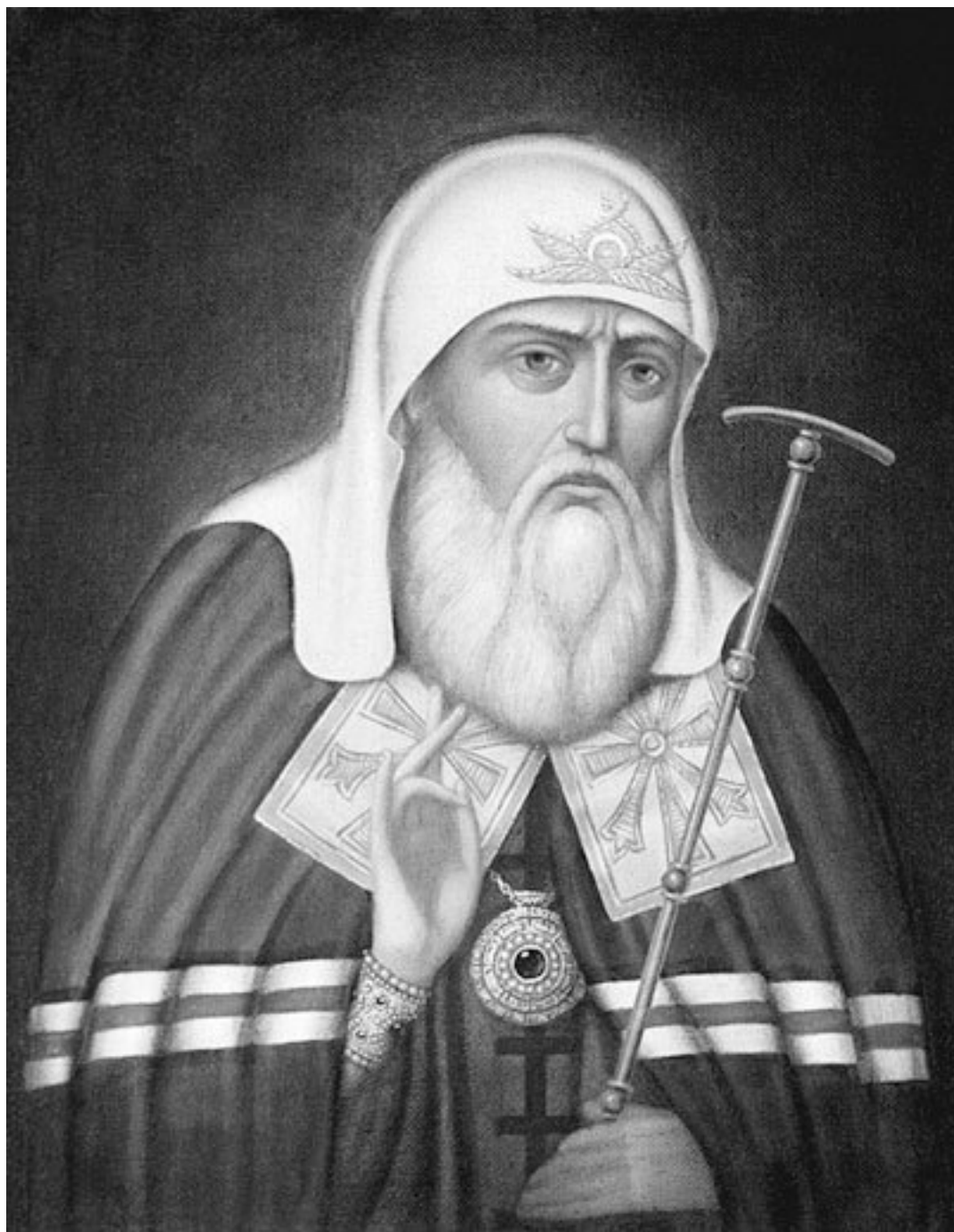
Священномученик Ермоген, Патриарх Московский и всея Руси (1530-1612)

Господи Боже наш, услышь прилежное моление наше, рабов Своих, молящихся Тебе, и помилуй нас, Господи, по великой милости Твоей. Услышь нас, недостойных рабов Своих, уповающих на Тебя, и посети, Господи, нас, недостойных рабов Своих, превеликой благостью Своей и Своим великим милосердием, и простри снова к нам Своё человеколюбие, и укроти Свой праведный гнев, воздвигнутый на нас. Воспомни нас, Господи, ибо Ты благ к нам, нищим и грешным рабам Своим, и будь нам Ты, Господи, помощником и заступником, ибо имя Тебе –