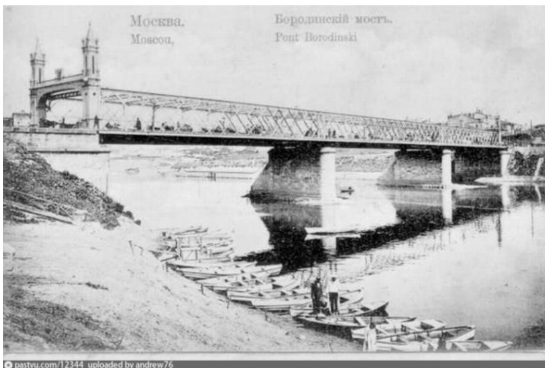
Таким был Бородинский мост в начале XX века

Владимир гуляет по Москве. Подходит к колоннаде Бородинского моста . Эти портики и сейчас стоят на прежнем месте, и любой желающий может рассмотреть их вблизи. Впрочем, не совсем. Мост за свою историю не раз перестраивался, и кинозрители, встречавшие его в фильмах «Третья Мещанская», «Зеленый огонек» или «Московские каникулы», видели, по сути, разные сооружения.