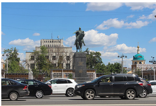
Тверская площадь сегодня. На месте Статуи Свободы – памятник Юрию Долгорукому

В фильме позади обелиска Свободы видно строящееся здание, а перед ним – портик с колоннадой. В то время еще не было закончено возведение здания Института В. И. Ленина (впоследствии Институт марксизма-ленинизма при ЦК КПСС, Центральный партийный архив при СССР, а сейчас Российский государственный архив социально-политической истории). Колоннада перед ним – остаток здания, в котором находились Тверская полицейская часть, пожарное депо с каланчой и тюрьма, которые до революции частенько соседствовали друг с другом. Тверская пожарная часть была первой в Москве.