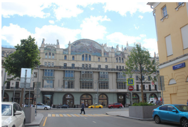
Гостиница «Метрополь» с мозаикой М. А. Врубеля

В 1906 году при гостинице открылся первый в России двухзальный электротheater, названный «Театр «Модерн», который в советские годы был известен москвичам как кинотеатр «Метрополь». Сейчас он закрыт, но, по некоторым сведениям, планируется его восстановить.