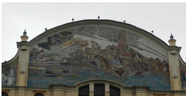
«Принцесса Грёза» М. А. Врубеля

Главным украшением гостиницы считается грандиозное майоликовое панно «Принцесса Грёза», выполненное по картине Михаила Врубеля . Интересна история этой картины. В 1896 году С. Ю. Витте заказал Врубелю два живописных панно для нижегородской художественно-промышленной выставки. Одно из них художник выполнил на сюжет драмы в стихах Эдмона Ростана «La Princesse lointaine» (в русском переводе Т. Л. Щепкиной-Куперник – «Принцесса Грёза»). Но это полотно не получило признания ни членов Императорской академии художеств, ни публики. И тогда С. И. Мамонтов, который поддерживал творчество передовых художников, решил увековечить его в керамическом панно, поместив на строящемся здании гостиницы «Метрополь». Сегодня оно украшает главный фасад здания, обращенный к Театральному проезду. А само произведение Врубеля хранится в Третьяковской галерее.