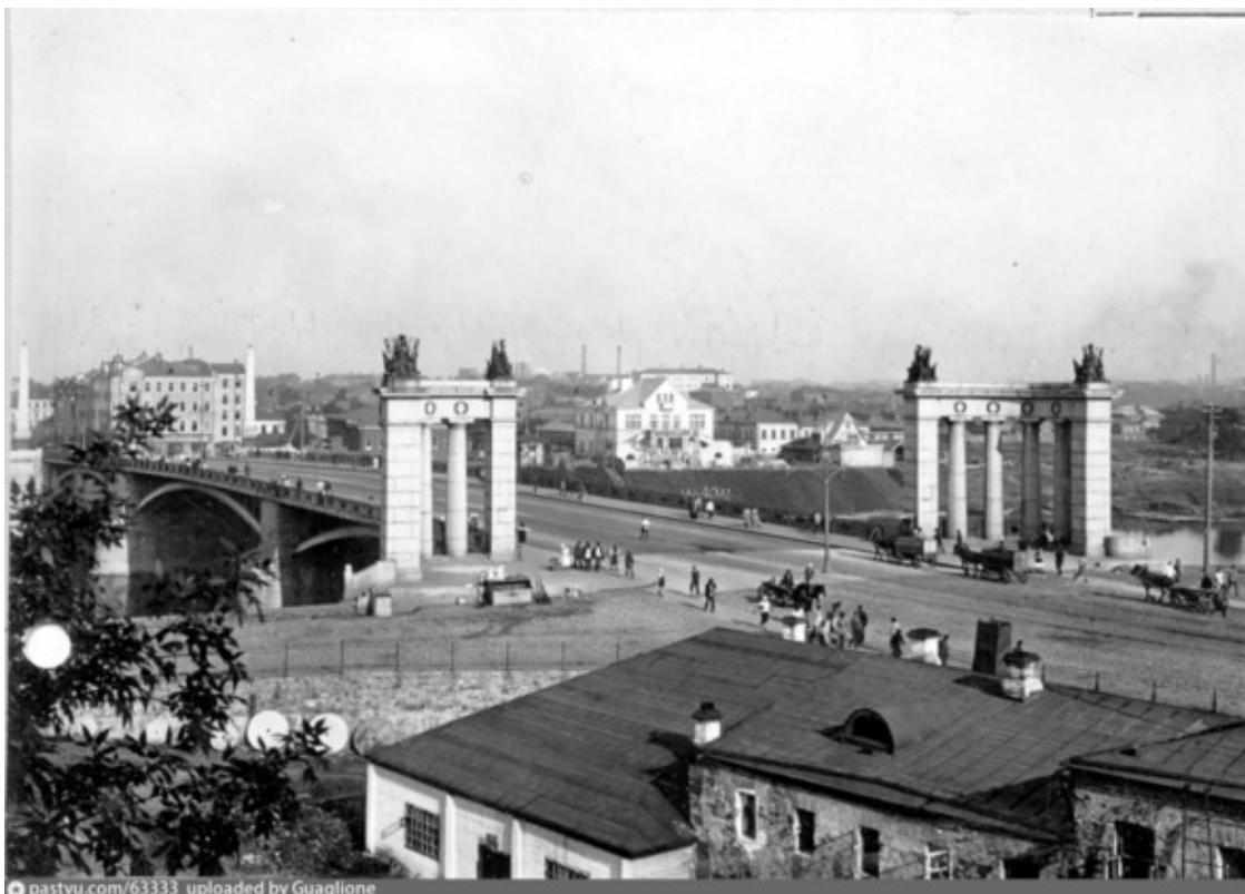
Таким мы увидели его в фильме

Сначала на этом месте находился так называемый живой, то есть лежащий непосредственно на воде, мост. По нему в 1812 году переправлялись через Москву-реку и русские, и французские солдаты. Он был ненадежен, его разрушали паводки. И потому в 1865 году его решили заменить на капитальный. Строительство началось в мае 1867 года, и менее чем через год новый мост был открыт. Но вскоре он оказался мал. В марте 1899 года был открыт Брянский (ныне Киевский) вокзал, и пропускная способность моста стала недостаточной. И потому в 1911 году начали возводить более широкий и прочный Бородинский мост – его-то мы и видим в фильме «Третья Мещанская».