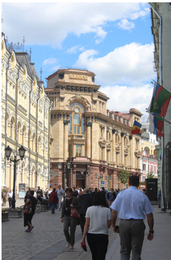
Кузнецкий мост сегодня

Дом 8/15 на углу Кузнецкого и улицы Рождественка был построен по заказу Московского международного банка архитектором С. С. Эйбушитцем в 1898 году. Его операционный зал расположен необычно, по диагонали, и перекрыт легкими конструкциями инженера В. Г. Шухова. В кадре из фильма видно, что здание венчает небольшая башенка, которой сейчас нет. К сожалению, на этом изображении мы не можем разглядеть ее подробно. Знаем только, что это так называемые аттик с маскаронном – своеобразная декоративная стенка или арка с расположенной внутри скульптурой в виде человеческого лица, морды животного или мифического существа. К 30-м годам эта архитектурная деталь была утрачена.