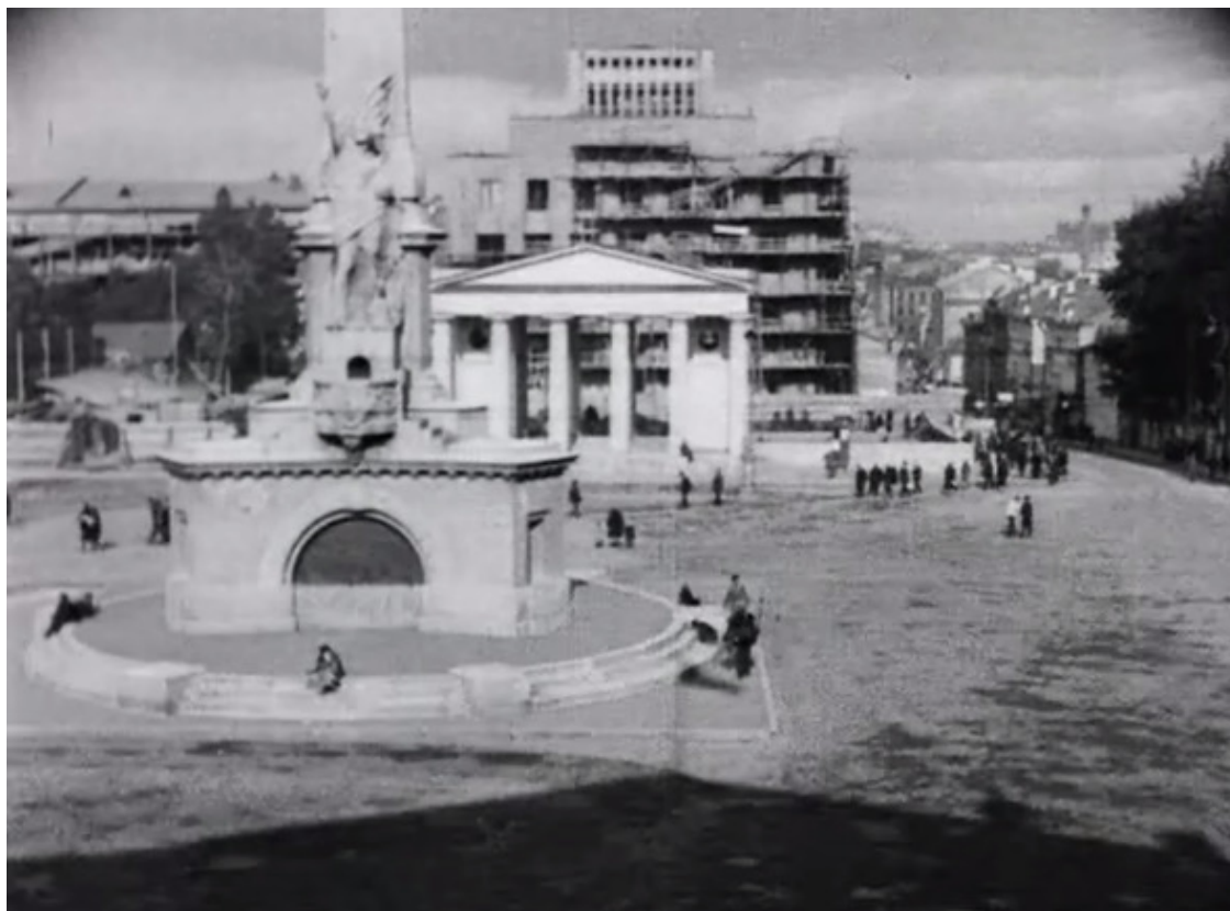
Кадр из фильма. Тверская площадь. На переднем плане – статуя Свободы. На заднем плане строится здание Института марксизма-ленинизма. Портик с колоннадой – то, что осталось от Тверской полицейской части