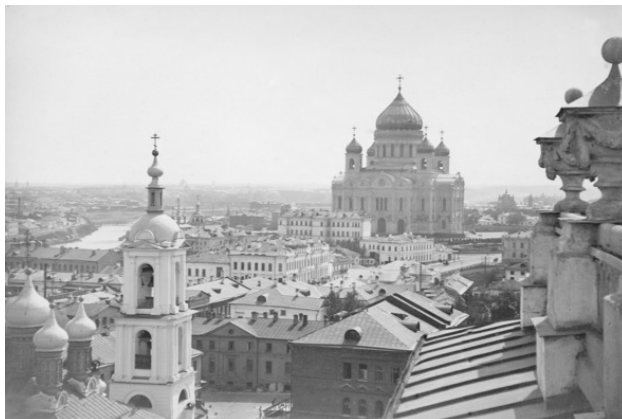
Храм Христа Спасителя. Начало XX века

гибели, вознамерились мы в Первопрестольном граде нашем Москве создать церковь во имя Спасителя Христа».