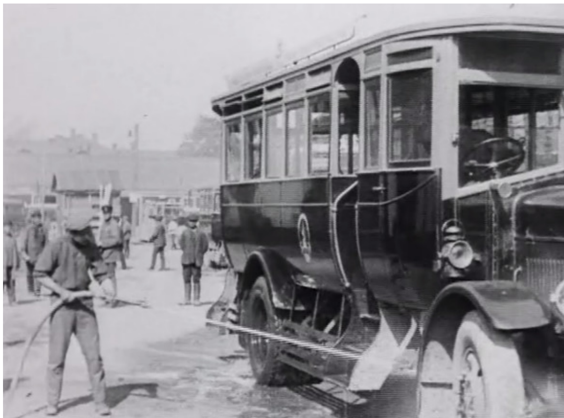
Кадр из фильма. Автобус на базе АМО-Ф15. Подготовка к рейсу

Эти автобусы курсировали по Москве и ряду других городов Советского Союза. Один из них и попал в объектив кинооператора. А кроме них, АМО-Ф15 выпускали еще в виде пожарных машин, карет скорой помощи, штабных шестиместных автомобилей и даже броневиков.