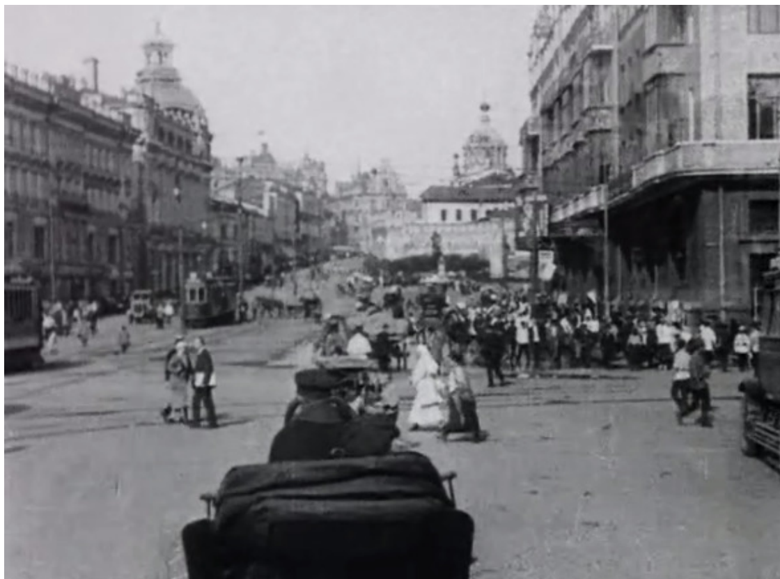
Кадр из фильма. Театральный проезд. Справа – гостиница «Метрополь». Слева – дом Хлудовых. Вдали слева – Лубянский пассаж, справа – церковь Владимирской иконы Божией Матери

Перспектива же Театрального проезда нам, нынешним, почти совершенно незнакома, хотя одно здание, №3, сохранилось с конца XIX века. Это доходный дом наследниц купцов Хлудовых . В нем до революции располагались ресторан «Ялта», бар Товарищества Трёхгорного пивоваренного завода, Русское общество любителей фотографии, Московское отделение Русского технического общества с «Музеем содействия труду», кинотеатр «Экспресс».