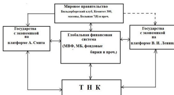
Рис. 1. Абстрактное представление мирохозяйственного комплекса – его структура

дарства с экономикой на платформе А. Смита и с экономикой на платформе В. И. Ленина), которые собственно и отображают производственную часть комплекса, не встречаются.