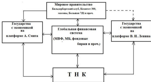
Рис. 1. Абстрактное представление мирохозяйственного комплекса – его структура

Такое представление определяется тем, что структура должна как-то работать, а значит, она должна содержать некую тройку обязательных элементов: производство – объект (без государств не возможно существование современного комплекса); измеритель состояния объекта – глобальная финансовая система; регулятор – мировое правительство. Кроме того появился новый объект экономики, которого в предыдущие годы не было – это транснациональные компании (ТНК). Трудно говорить об их «национальности» – можно по месту нахождения головного офиса. Тем более говорить об их устройстве. Вероятней всего большинство из них базируются на платформе А. Смита. Также отдельно представлены как элемент мирохозяйственного комплекса государства, экономика которых расположена на платфор-