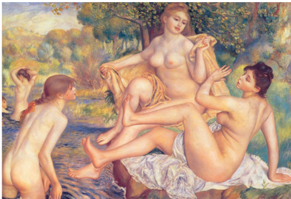
Большие купальщицы. Художник Пьер Огюст Ренуар

Ваня ещё раз пристально взглянул на расшалившихся молодаяк и для себя решил: «Врёт дед! Уже куда соседская Айгулька красивее этих...».