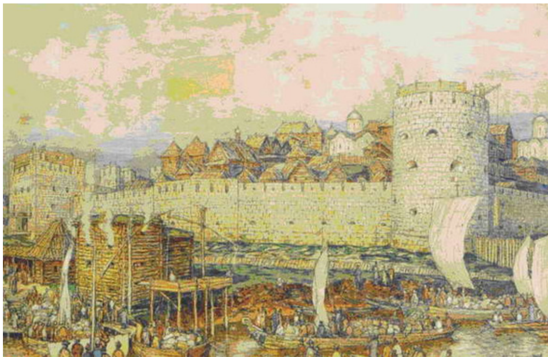
Московский Кремль при Дмитрии Донском. Худ. А. М. Васнецов.

Ольгерд был крещён по православному обряду, хотя в душе и оставался язычником. С любовью и уважением относился к жене – княгине Ульяне, родной сестре тверского князя Михаила Александровича. Она отвечала взаимностью и во всём стремилась помогать супругу.