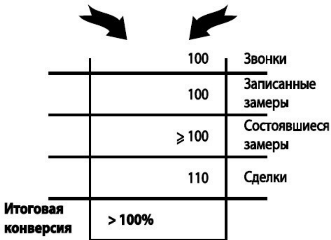
Рис. 4. Воронка продаж по рекомендациям и повторным обращениям