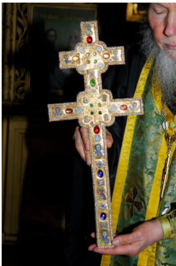
Копия креста Ефросиньи Полоцкой

Полоцкий мастер Богша создал драгоценный напрестольный крест, в который эти реликвии были вставлены. Этот крест стал в дальнейшем символом духовных исканий полочан, его судьба не менее трагична, чем судьба Полоцкого храма Св. Софии.