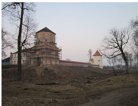
Любчанский замок, построен в 1581_году (пос. Любча, Новогрудский р-н, Гродненской обл. Беларусь)

В 1585 году в семье случкого князя Юрия Алельковича и Катерины из рода белорусских магнатов Кишка, в местечке Любча, в Любчанском замке родилась девочка Софья – «Алелька» (Случк – город в Минской области).