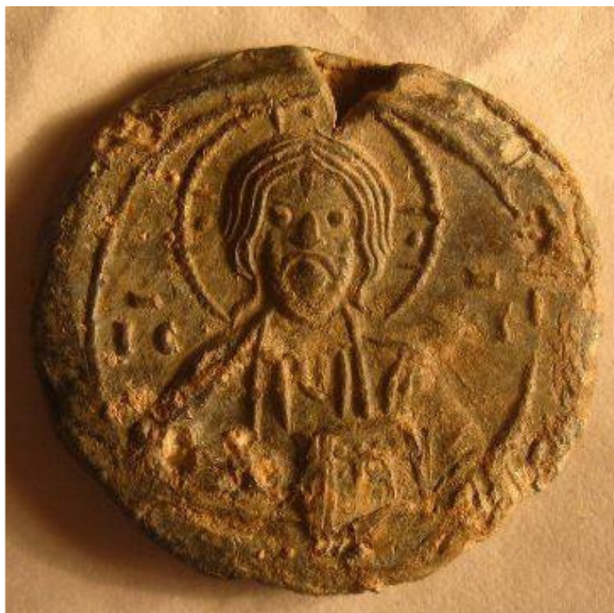
Печать Ефросиньи Полоцкой (XII век)

расте 12 лет тайно от родителей она ушла в монастырь, настоятельницей которого была ее тетка, вдова ее дяди Романа Всеславича. Здесь она приняла постриг под именем Ефросиньи, и в хрониках появляется воспетый летописцами ее новый образ – «яко луна солнечна». От раннефеодальной Полоцкой державы, прародины белорусов, нас отделяют девять столетий. Именно из XII века, пронизывает исторические пласты свет имени, без которого невозможно представить культурный и духовный расцвет восточных славян. Это – Евфросинья Полоцкая (светское имя Предслава, 1102 (?) – 23.V.1173), одна из самых просвещенных женщин своего времени.