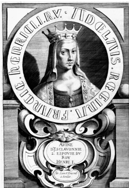
Портрет Анны Ярославны с росписей аббатства Сен-Венсан, Санлис Франция

Еще одна дочь из этого выдающегося семейства прославила Рогволодовичей – Анна Ярославна (около 1024 – 1075). Внучка Рогнеды и дочь Ярослава Мудрого, она стала в 1051 году женой французского короля Генриха I из семейства Капетингов, а после его смерти и королевой-регентшей при малолетнем сыне, короле Филиппе I.