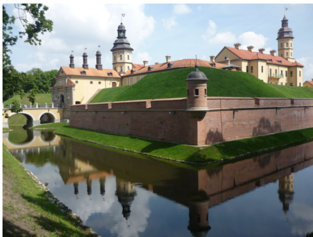
Замок Радзивиллов г. Несвиж Минская область

В XVIII столетии в семье Радзивиллов, в родовом замке семьи, появилась неординарная личность – писательница и основательница Несвижского театра Францишка Урсула (13.2.1705 – 23.5.1753) из княжеского рода Вишневецких. В этих семьях дочерям давали лучшее по тем временам домашнее образование и Урсула рано начала писать стихи. Писала на польском языке, вся семья говорила по-польски, белорусский язык считался в то время «мужицким». А польский, как французский в русском обществе, был языком высшего света и стал необходимым для продвижения по карьерной лестнице белорусской шляхты.