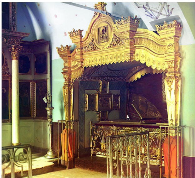
Драгоценная рака мощей прп Святой Ефросиньи Полоцкой

Драгоценную серебряную раку советские власти реквизировали в 1921 году вместе с другими монастырскими ценностями. Впоследствии рака была «утрачена». (Фотография из архива цветных изображений С. М. Прокудина-Горского, 1912 год, хранится в Библиотеке Конгресса США).