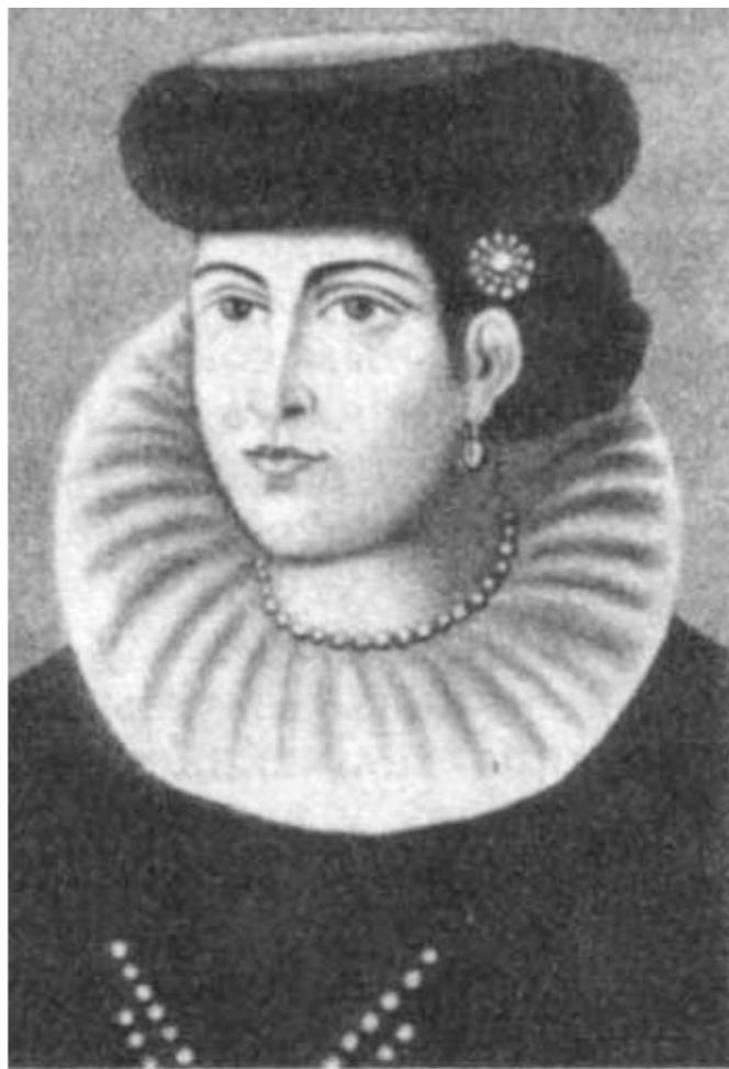
Просветительница, святая Софья Слуцкая Радзивилл – «Аленька»

Софья раздавала деньги бедным, помогала больным, опекала гонимых единоверцев. Много жертвовала она православным монастырям и церквям, материально поддерживала церковные братства, начала строительство нескольких больниц для бедных, совершила паломничество в святые места. София умерла во время родов (1617 год), не выжила и её дочь. Софью, как последнюю из рода Амелькавичей погребли в Слуцком Свято-Троицком монастыре. Она канонизирована и причислена к