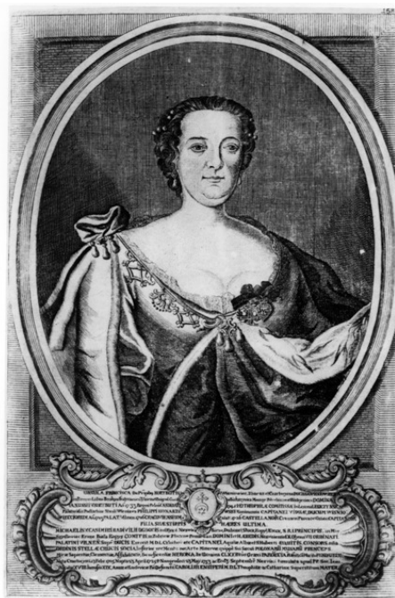
Францишка Урсула Радзивилл (1705—1753)

Хотя все три «Статута Великого Княжества Литовского» (1529, 1566 и 1588 гг.) были написаны на старобеларуском, работали «друкарни» (типографии) печатавшие на старобеларуском языке книги, наступило время вытеснения этого языка из государственного обращения и ограничения в правах белорусской шляхты. Заключительный акт трагедии был оформлен «Постановлением Конфедерации Сословий Речи Посполитой» (1696 год), запрещавшим делопроизводство на белорусском языке. Приходилось «соответствовать» времени, наступала «полонизация» края.