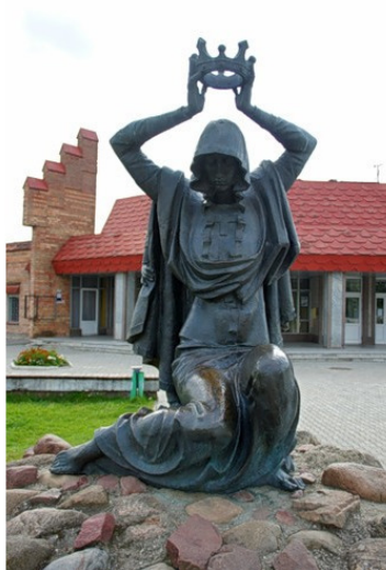
Памятник Рогнеде (и ее сыну Изяславу) г. Заславль, Беларусь

– «Не хочу разуци рабынича...», – стал литературной легендой. Далее ее жизнь вполне соответствует античным трагедиям Софокла и Эврипида.