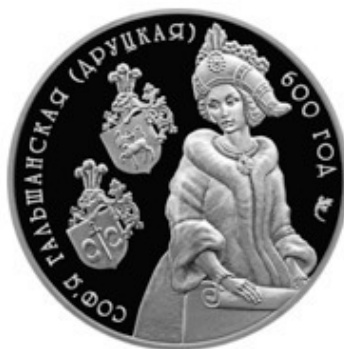
Реверс памятной медали, выпущенной Нацбанком Республики Беларусь к 600-летию со дня рождения Софьи Гольшанской