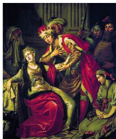
Рогнеда и Владимир картина А. Лосенко, Русский музей

Драматические события жизни Рогнеды не раз воспевались поэтами, вдохновляли художников. Поэт-декабрист Рылеев посвятил ей поэму «Рогнеда», русский композитор Серов – оперу, а грузин, Андрей Мдивани, балет «Страсти – Рогнеда».