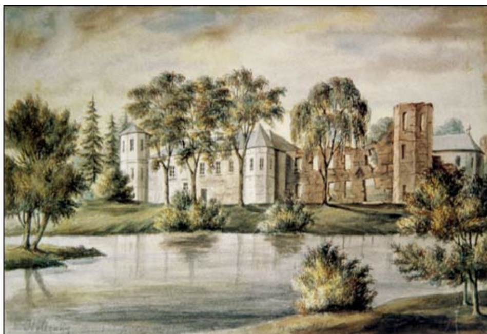
Гольшаны – родовое поместье князей Гольшанских Наполеон Орда (1807—1883) акварель

Ульяна Гольшанская вышла замуж за Великого князя Витовта Кейстутовича (1350—1430). Племянница ее, Софья Гольшанская (1405—1461) обвенчалась (1422) с двоюродным братом Витовта, польским королем Владиславом Ягайлаи и 5 марта 1424 года была коронована. Она стала родоначальницей династии польских королей Ягеллонов, так как от брака Ягайла с королевой Ядвигой и двумя другими женами сыновей у короля не было.