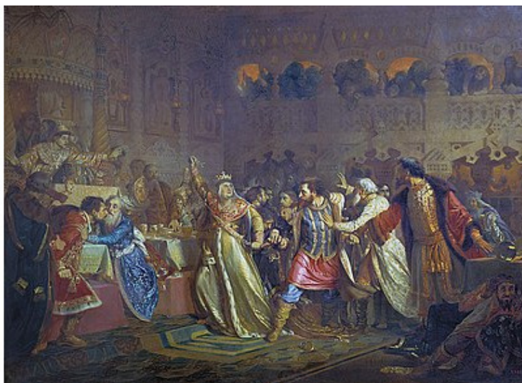
П. Чистяков, «Великая княгиня Софья Витовтовна на свадьбе великого князя Василия Темного», 1861 (дом-музей Чистякова, Царское Село)

Софья Витовтовна попала в историю еще и ярким поступком на свадьбе сына, ставшего Великим князем, Василием II («Тёмным»). Во время свадебной церемонии (1433 год) Софья «публично сорвала с Василия Юрьевича Шемяки золотой пояс, якобы украденный в прошлом у Дмитрия Донского тысяцким Василием Протасьевичем и со временем попавший к Василию Косому» (Википедия).