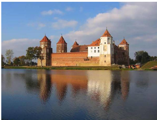
Мирский замок Радзивиллов, XVI век Мир, Гродненская обл., Беларусь

При нём был восстановлен Мирский замок, сожженный шведами в 1706 г., некоторые интерьеры приобрели дворцовый облик (1738). Вместе с матерью, Францишкой Урсулой, «Рыбанька» основал мануфактуры ткачества в Несвиже, Слуцке и Кареличах, стеклоделия в Налибоках и Уречье, фаянса в Свержене.