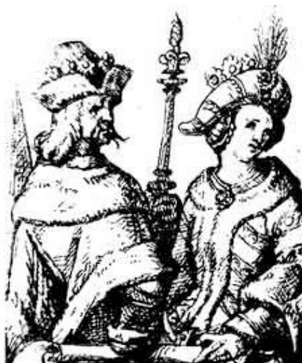
Ягайло и Софья

Оба сына Софьи Гольшанской благодаря настойчивости и дипломатии матери стали королями – Владислав III и Казимир V. Еще одна женщина из этой семьи, Татьяна Гольшанская, единственная дочь Семёна Юрьевича Гольшанского, стала женой Великого гетмана литовского Константина Ивановича Острожского (в гетманстве с 1497 по 1500), известного своей победой под Оршей над русскими, московскими войсками.