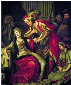
Рогнеда и Владимир картина А. Лосенко, Русский музей

Есть версия о возвращении Рогнеды к жестокому мужу, о нравственном перевороте Великого князя Владимира после неудавшегося покушения Рогнеды на него, о малолетнем отроке Изяславе, защитившем мать от меча разгневанного отца, о прощении Рогнеды князем. Но, так или иначе, у нее родилось еще три сына и три дочери, в том числе и самый значительный для истории, для Киевской Руси – Ярослав Мудрый (980—1054).