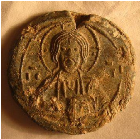
Печать Ефросиньи Полоцкой (XII век)

ди Романа Всеславича. Здесь она приняла постриг под именем Ефросиньи, и в хрониках появляется воспетый летописцами ее новый образ – «яко луна солнечна». От раннефеодальной Полоцкой державы, прародины беларусов, нас отделяют девять столетий. Именно из XII века, пронизывает исторические пласты свет имени, без которого невозможно представить культурный и духовный расцвет восточных славян. Это – Евфросинья Полоцкая (светское имя Предслава, 1102 (?) – 23.V.1173), одна из самых просвещенных женщин своего времени.