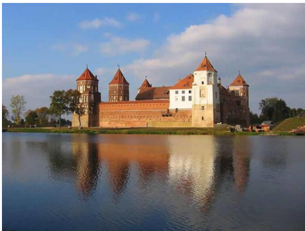
Мирский замок Радзивиллов, XVI век

При нём был восстановлен Мирский замок, сожженный шведами в 1706 г., некоторые интерьеры приобрели дворцовый облик (1738). Вместе с матерью, Францишкой Урсулой, «Рыбанька» основал мануфактуры ткачества в Несвиже, Слуцке и Кареличах, стеклоделия в Налибоках и Уречье, фаянса в Свержене.