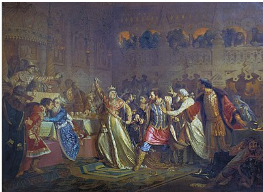
П. Чистяков, «Великая княгиня Софья Витовтовна на свадьбе великого князя Василия Тёмного», 1861 (дом-музей Чистякова, Царское Село)

Наступило XV столетие, в котором появляется новая героиня из Великого Княжества Литовского, Елена Васильевна Глинская (1508—1538).