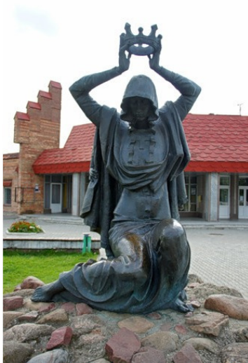
Памятник Рогнеде (и ее сыну Изяславу) г. Заславль, Беларусь

В 980 году Владимир с наемным войском захватил Полоцк. Взял в плен всю семью Рогволодовичей, изнасиловал Рогнеду в присутствии родителей, видимо, так было принято у Рюриковичей, после чего убил её отца, мать и двух братьев. Впрочем, удивляться поступку Владимира, «рабынича», сына рабыни, не приходится. Вряд ли служанка могла привить ему этические и моральные нормы. Рогнеду он, наконец, хоть и насильно, но взял в жёны, цели своей он достиг. Полоцк был сожжен, Полоцкое княжество растоптано, каза-