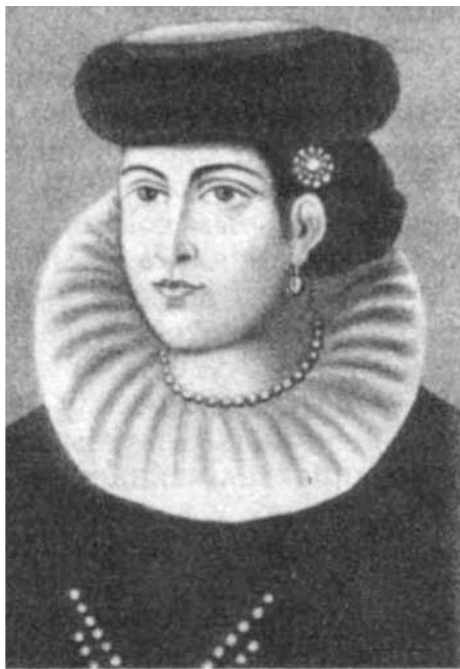
Просветительница, святая Софья Слуцкая Радзивилл –

Янушу Радзивилу пришлось согласиться с требованием невесты. Участие в войне со Швецией и сразу же после нее с Москвой надолго разлучили молодых супругов. Софья посвятила себя благотворительности, просвещению края и религиозной деятельности. Была яркой противницей униатства и пыталась ввести запреты на переходы православных в униатскую веру [16]