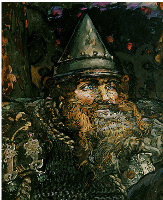
Врубель. Богатырь. фрагмент картины

Лет пять не грозит печенежское бремя, А дальше.., а дальше, как дело пойдёт.