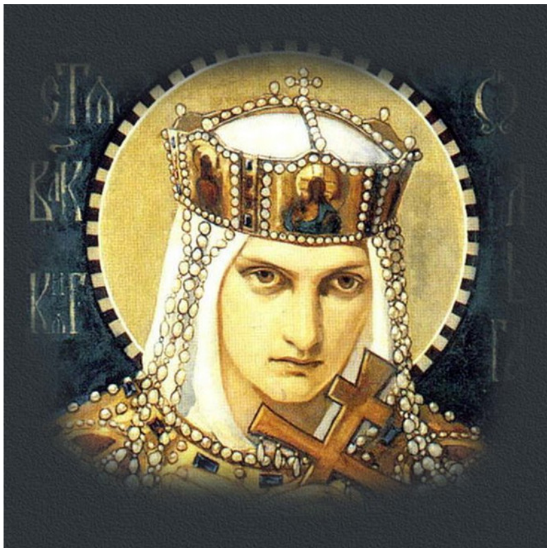
Княгиня Ольга. Икона.