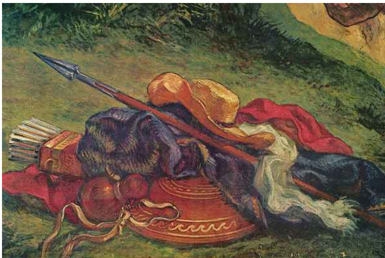
Эжен Делакруа. Борьба Иакова, фрагмент картины.

В стену вбиты костыли, а на них висят доспехи, Кое-где уже в пыли: латы, обручи, мечи, Хитро сплетены кольчуги – всё для воинской потехи, Дней былых напоминая, были битвы горячи. Возле лат Аскольда, Дира три свечи, Князьи родичи приносят, крещены Аскольд и Дир, Затеплить в их память просят, не творить им тризну, пир.