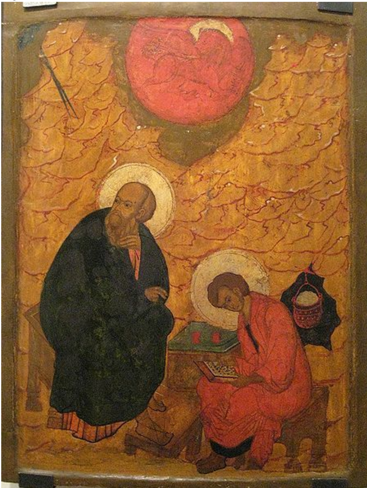
Апостол Иоанн Богослов на о.Патмос записывает Откровение Иисуса Христа. Икона XVII в. Нижний Новгород, Художественный музей

При слове "Апокалипсис" современный человек представляет себе картину ужаса и смерти. Мрачные предсказания и пророчества описывают будущее как "конец света". Но если непредвзято прочесть Откровение Иоанна Богослова, то мы увидим, что главное его содержание вовсе не в этом, а в торжественной вести о воцарении Иисуса Христа.