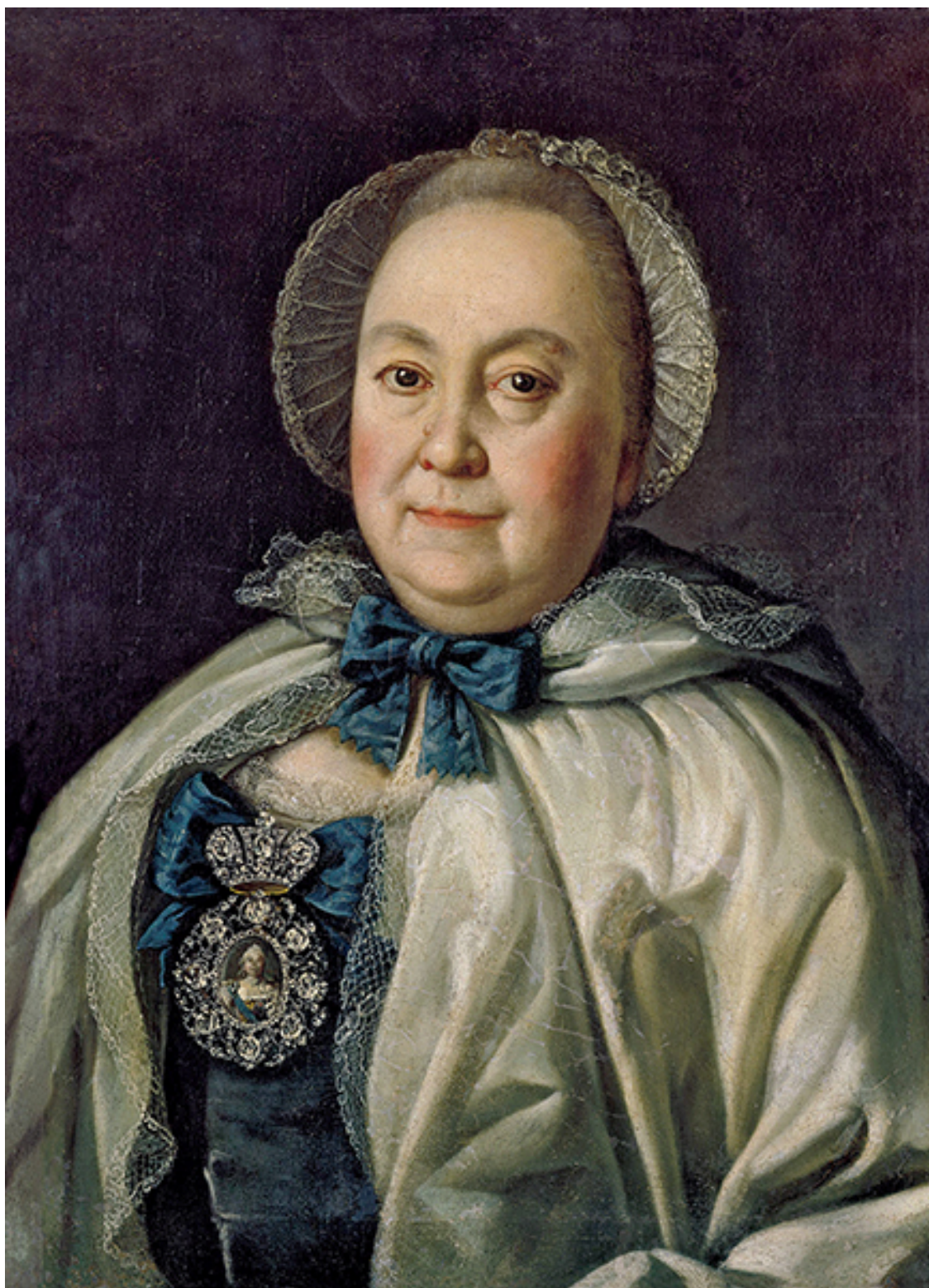
А. П. Антропов. «Мария Румянцева». 1764 г.

Если вы должны банку $ 100, это ваша проблема. Если вы должны банку $ 100 млн, то это проблема банка.