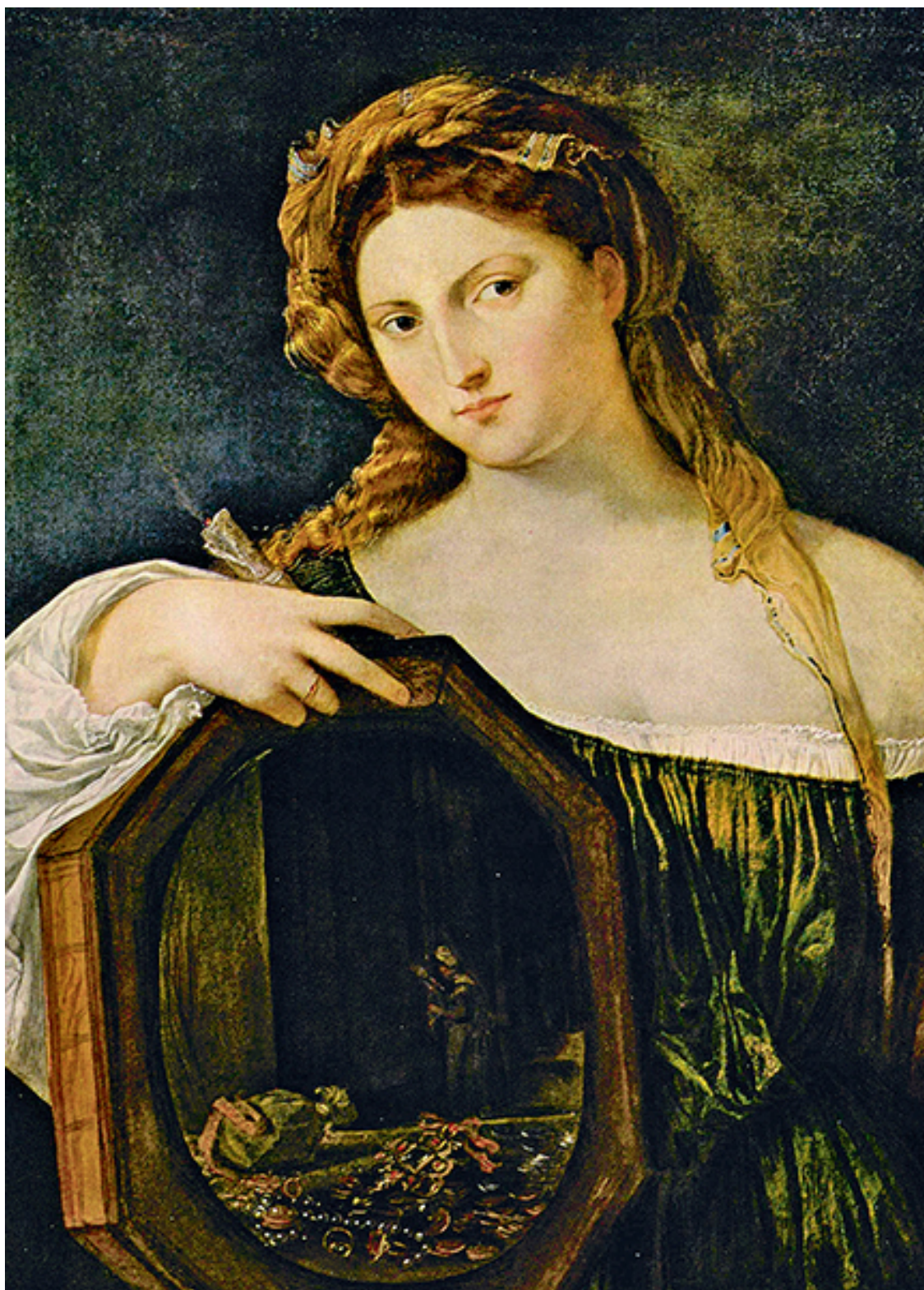
Тициан. «Светская любовь». 1514 г.

Долго не тратил деньги и не мог понять – почему никак не разбогатеет? Потом-то ему объяснили, что их еще и зарабатывать нужно.