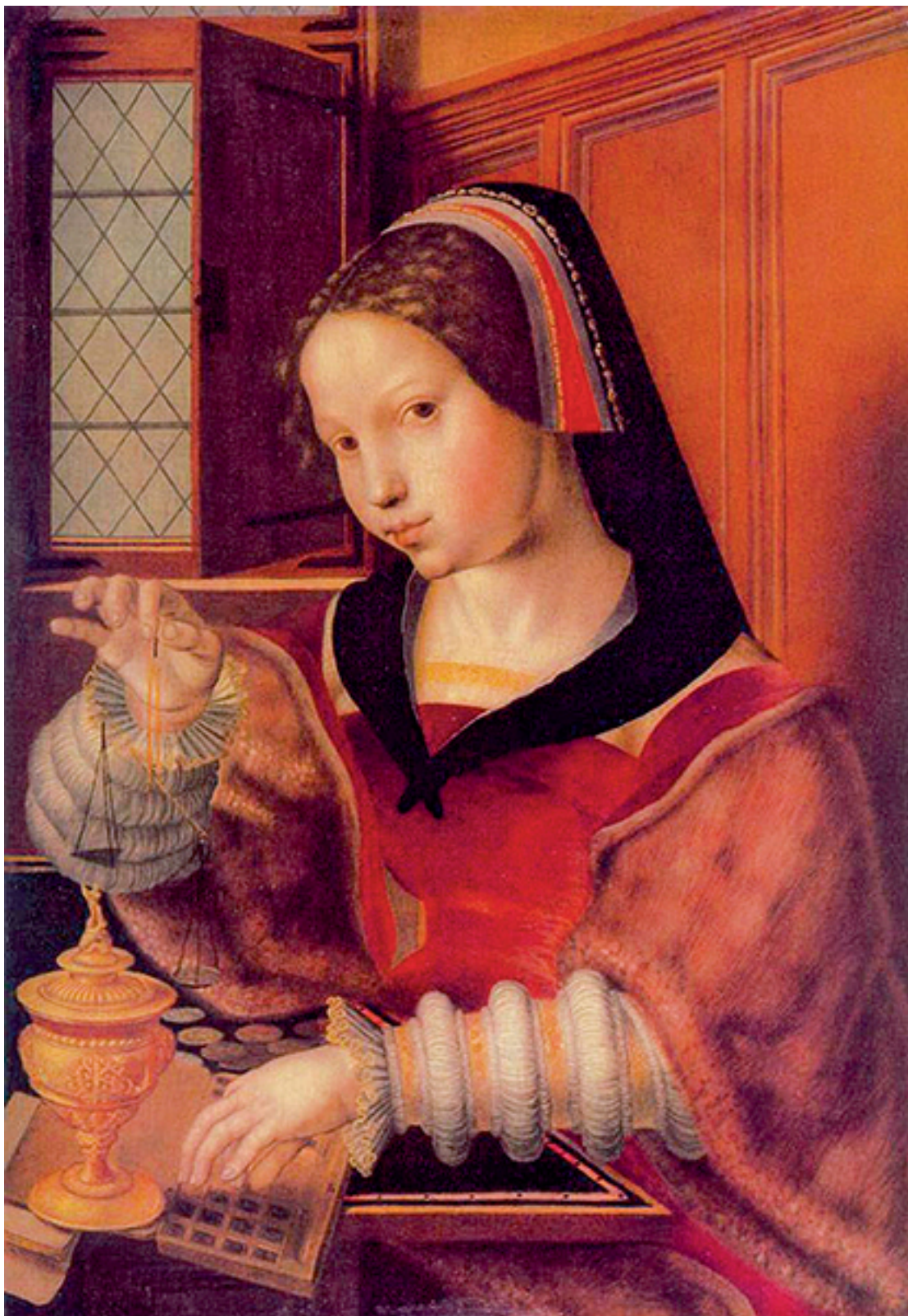
Ян ван Хемессен. «Женщина, взвешивающая золото». XVI в.