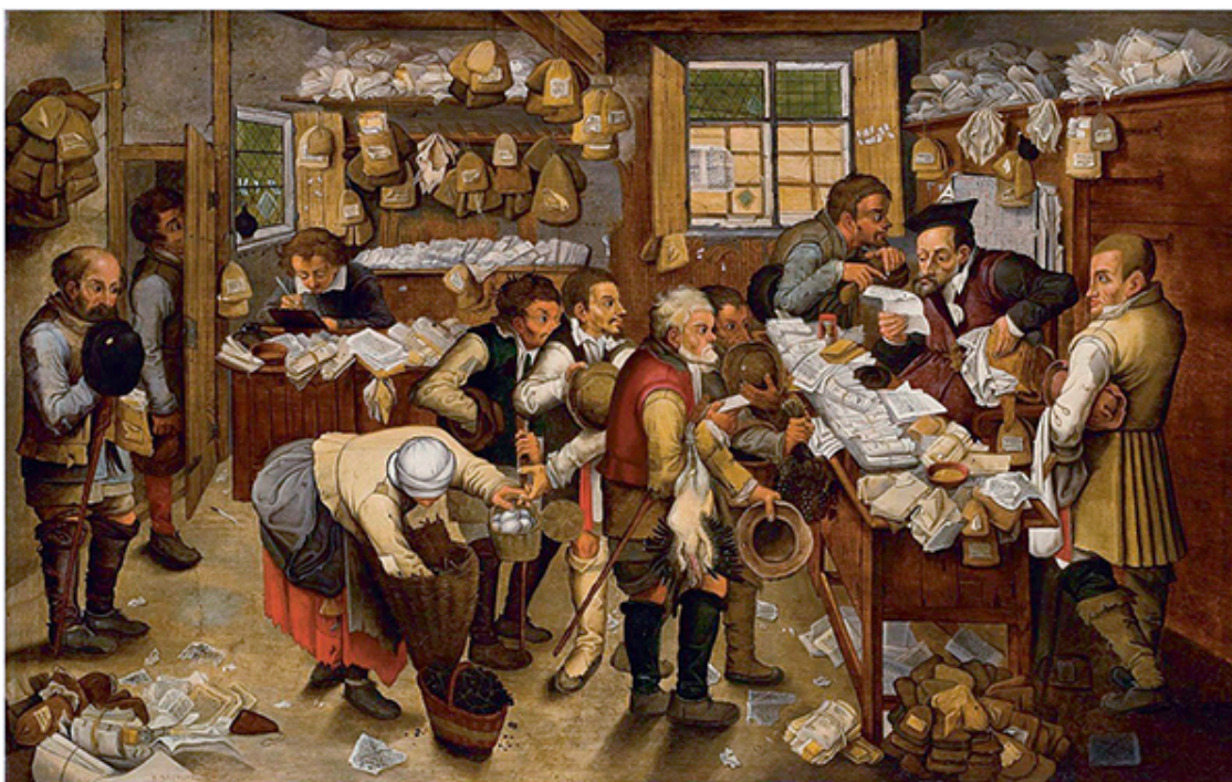
Питер Брейгель (Младший). «Выплата десятины». 1615 г.