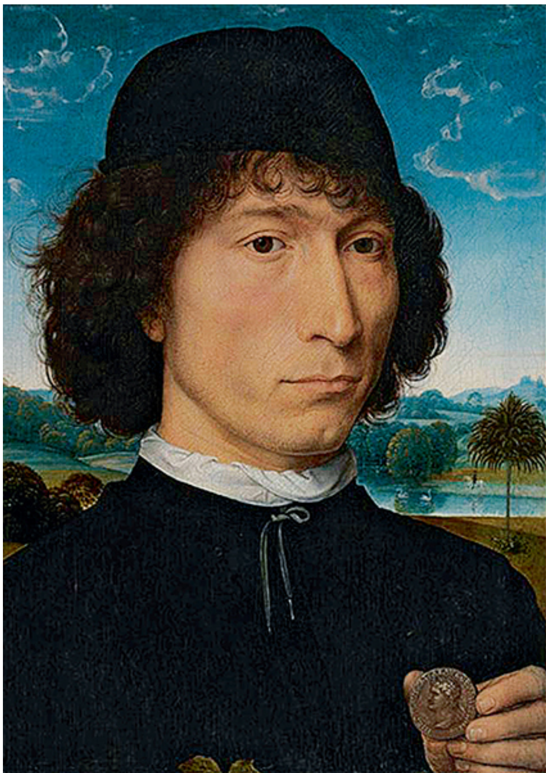
Ганс Мемлинг. «Портрет мужчины с монетой императора Нерона». До 1480 г.

В России появилась еще одна ветвь протестантизма – бабкизм. Это секта для тех, кто любит деньги и протестует, если их нет.