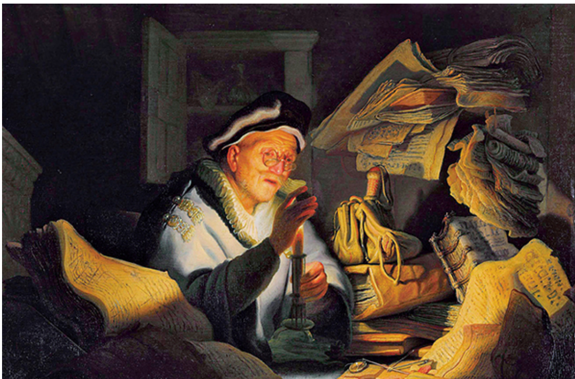
Харменс ван Рейн Рембрандт. «Притча о неразумном богаче». 1627 г.

Благоденствие это великий учитель, но несчастье учитель величайший. Богатство изнеживает разум; лишения укрепляют его.