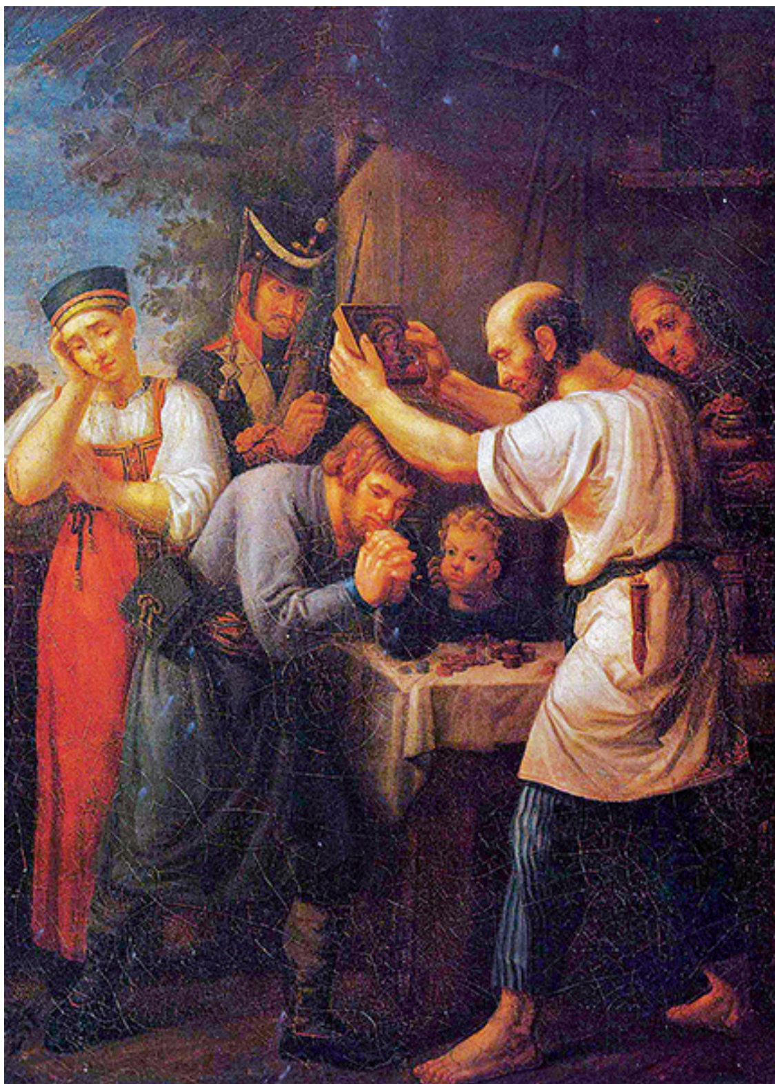
И. В. Лучанинов. «Рекрут, прощающийся со своим семейством». XIX в.

Деньги – это сводник между потребностью и предметом, между жизнью и жизненными средствами человека.