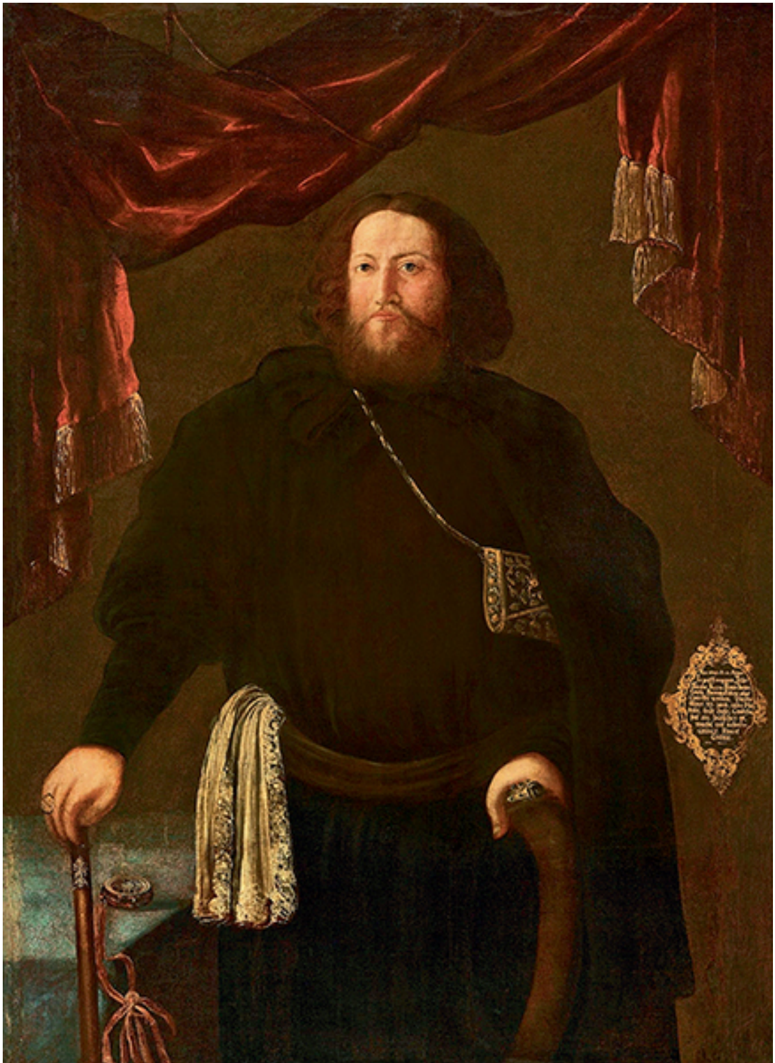
Георг Эрнст Грубе. «Портрет боярина князя Бориса Ивановича Прозоровского». 1694 г.

Если вы требуете от кого-нибудь, чтобы он отдал свое время и энергию для дела, то позаботьтесь, чтобы он не испытывал финансовых трудностей.