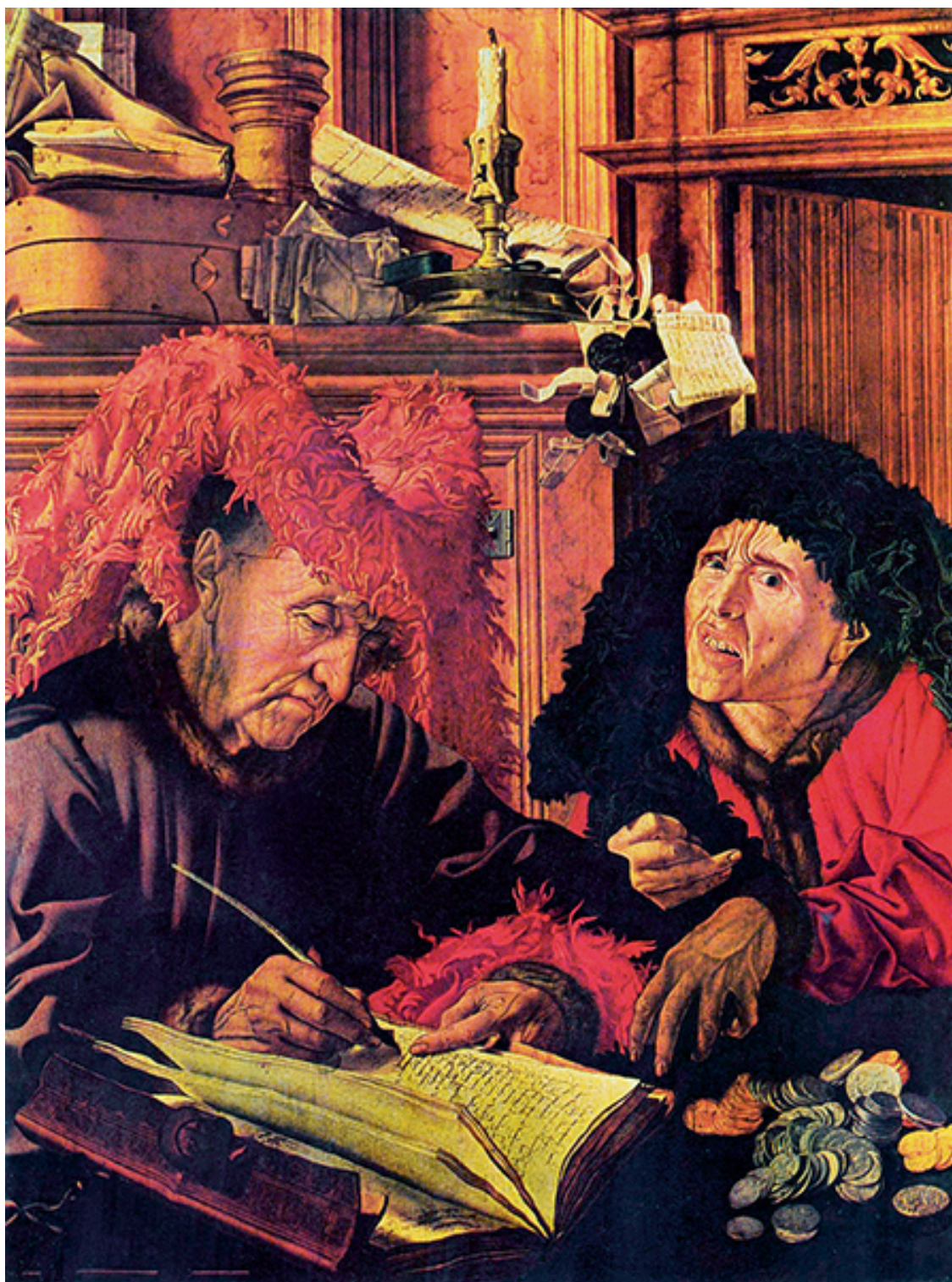
Маринус ван Реймерсвале. «Два сборщика податей». Ок. 1540 г.

Богатому не спится: богатый вора боится.