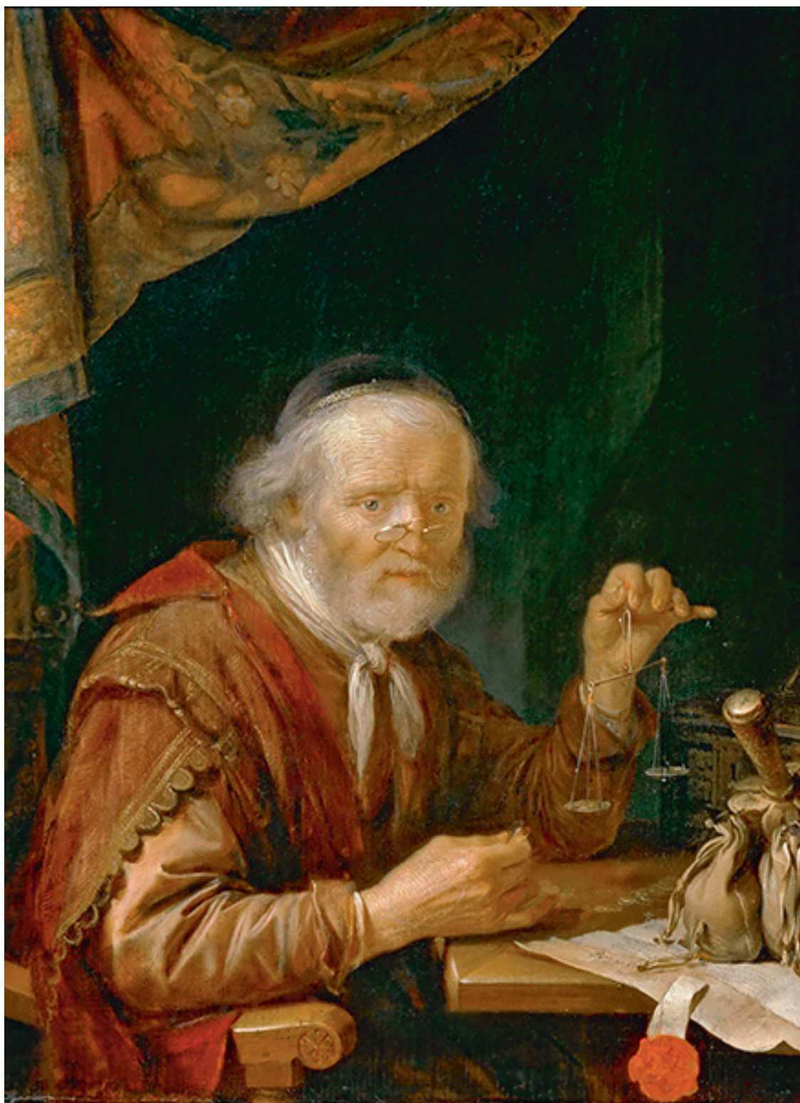
Герард Дау. «Старик, взвешивающий золото». XVII в.