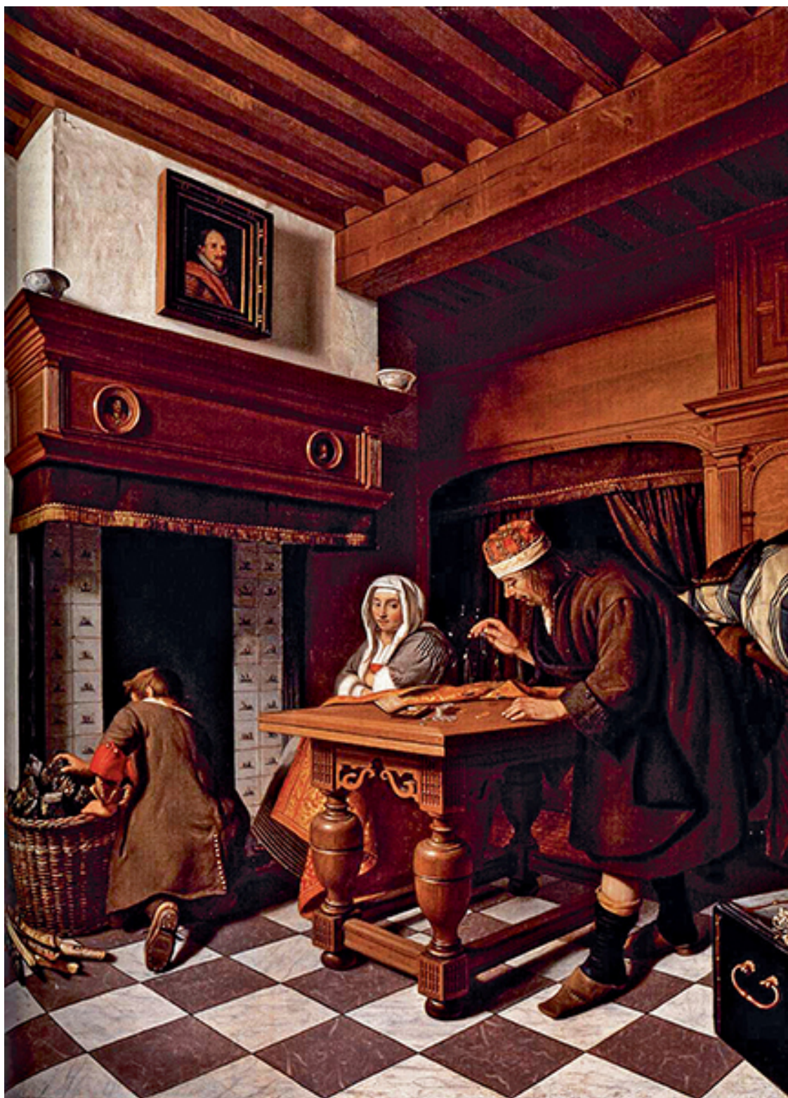
Корнелис де Ман. «Мужчина, взвешивающий золото». Ок. 1670 г.

Дайте мне управлять деньгами страны, и мне нет дела, кто создает ее законы. Майер Ротшильд