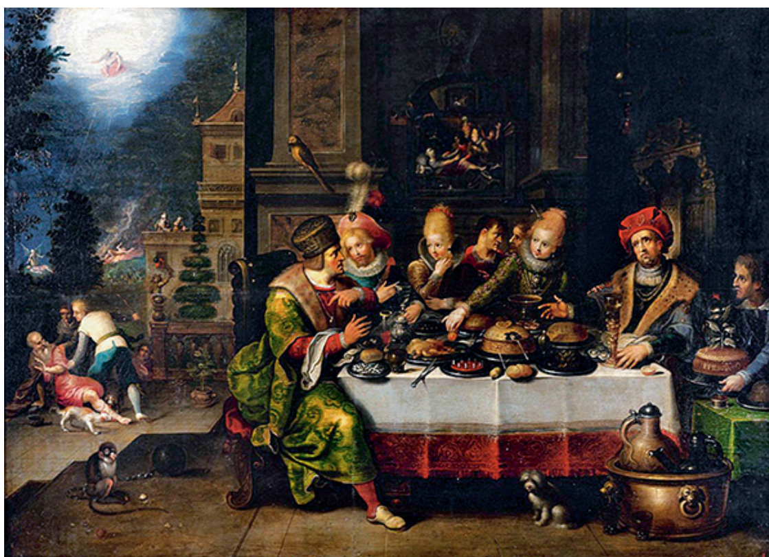
Франс Франкен Младший. «Притча о богаче и бедном Лазаре». 1620-е гг.

Больше, чем любовь, возбуждают только деньги.