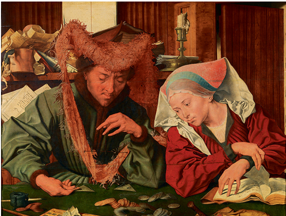
Мариус ван Роймерсваль. «Меняла с женой». 1539 г.