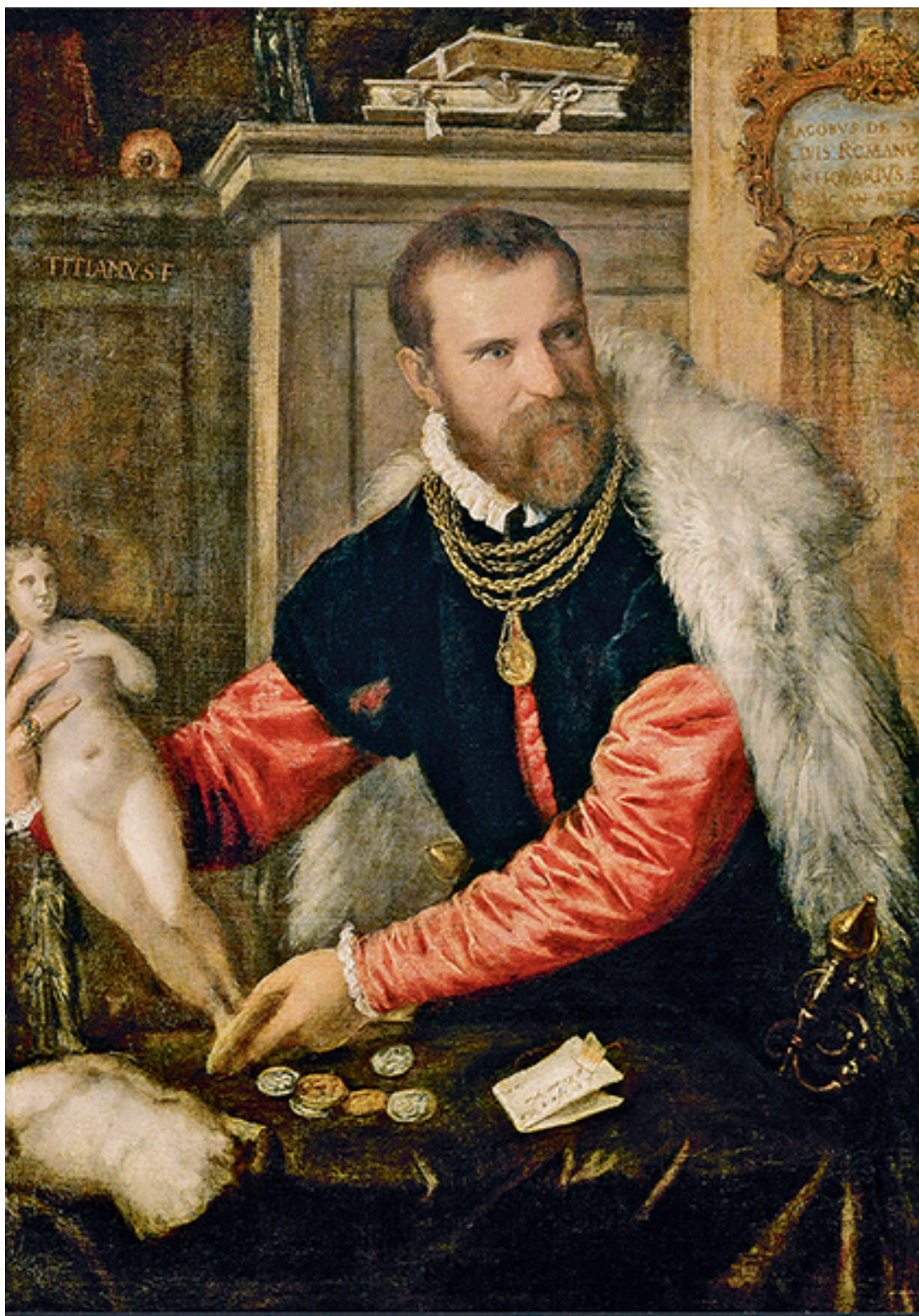
Тициан. «Портрет Якопо Страда». 1567–1568 гг.

Деньги не прибавляют счастья, но обеспечивают удобство. Мартти Ларни