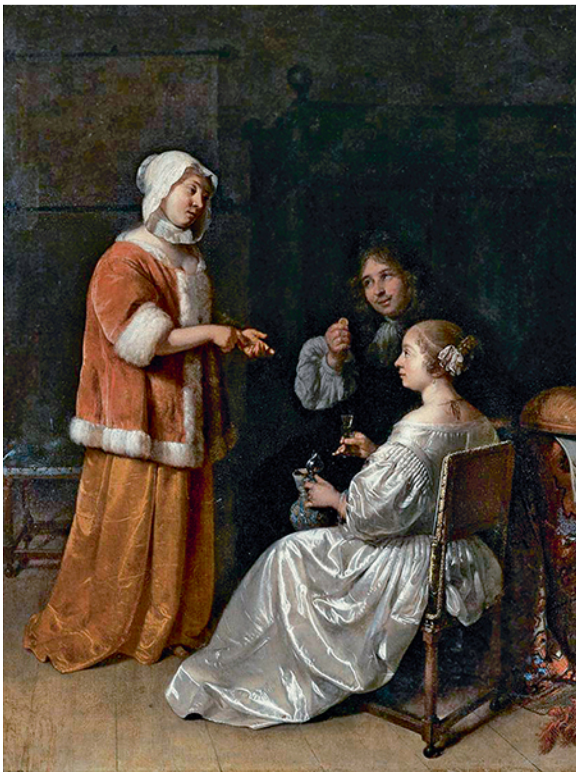
Каспар Нетшер. «Соблазнение». 1664 г.

Вы должны неукоснительно следовать правилу: делать лучшее, что вы можете сделать. Если где-то есть недоработки, выясните, что не так, и исправьте.