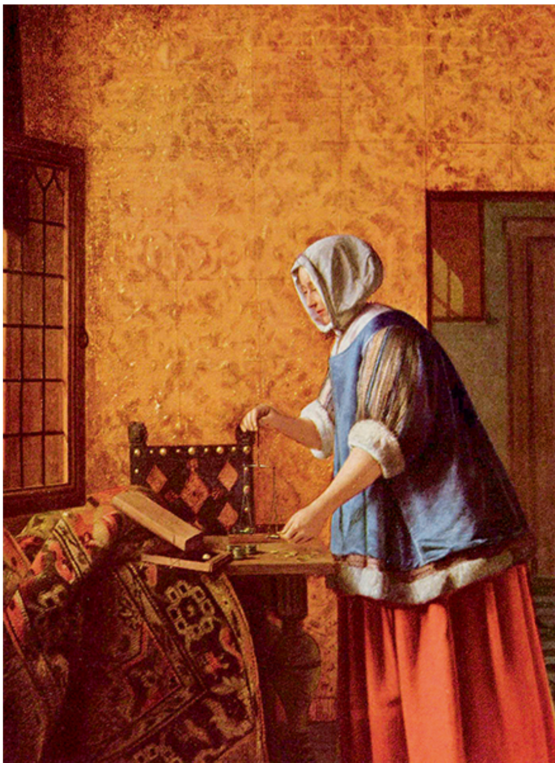
Питер де Хох. «Женщина, взвешивающая золото». Ок. 1664 г.

Деньги, которыми обладаешь, – орудие свободы; те, за которыми гонишься, – орудие рабства.