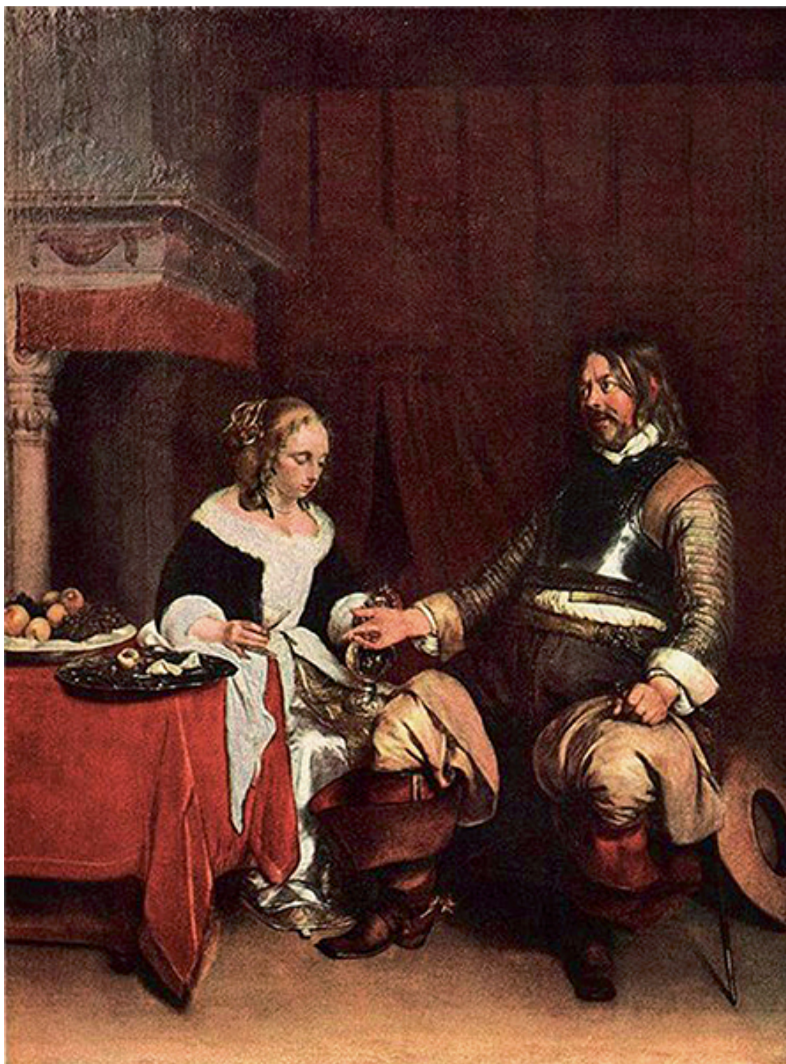
Герард Терборх. «Офицер предлагает деньги девушке». 1662 г.

Всё состоит в воображении. Последуй природе, никогда не будешь беден. Последуй людским мнениям, никогда богат не будешь.