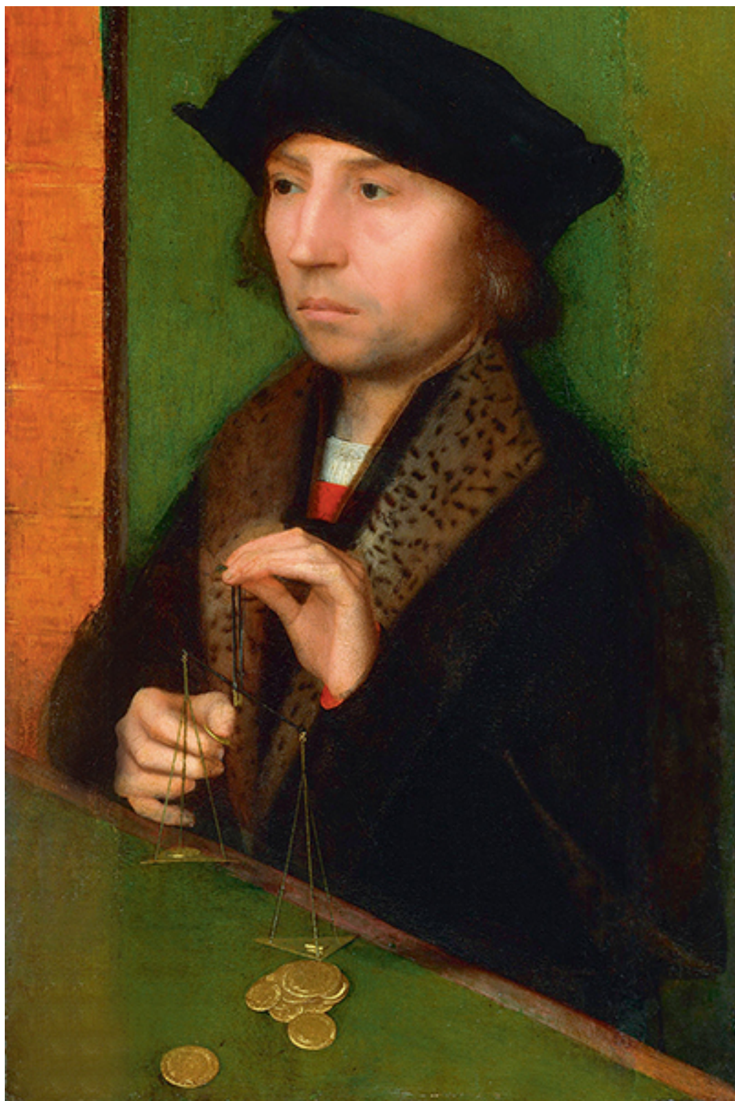
Адриан Изенбрант. «Человек, взвешивающий золото». XVI в.

Годовой доход 20 фунтов при расходе 19 фунтов 96 пенсов – это счастье. Годовой доход 20 фунтов при расходе 20 фунтов 6 пенсов – это нищета.