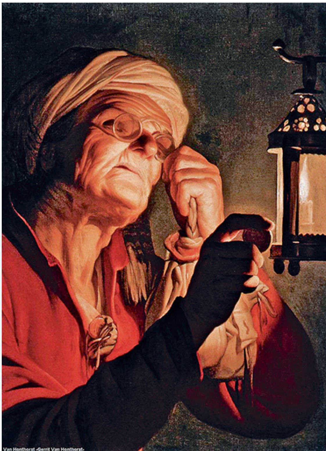
Геррит ван Хонтхорст. «Пожилая женщина, рассматривающая монету». XVII в.

Важно не то, сколько денег вы зарабатываете, а то, сколько денег у вас остается, как они работают на вас, и сколько поколений вы сможете ими обеспечить.