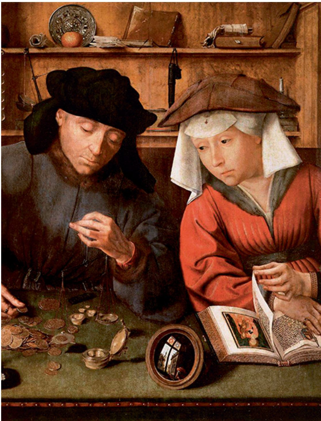
Квентин Массейс. «Ростовщик с женой». 1514 г.

Бережливость включает в себя все другие добродетели. Марк Туллий Цицерон