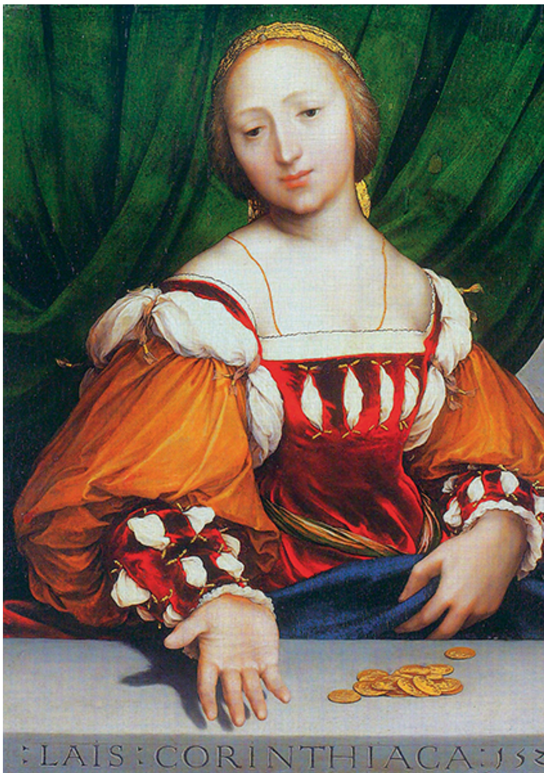
Ганс Гольбейн Младший. «Доротея Оффенбург в образе Лаисы Коринфской». XVI в.

Деньги – очень полезная штука, потому что они дают вам возможность не делать того, что вы не любите делать.