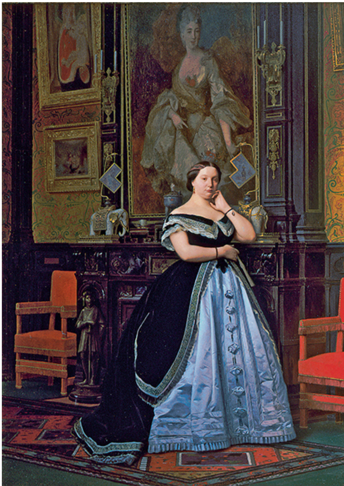
Жан-Леон Жером. «Баронесса Натаниэль Ротшильд». 1886 г.

Думаешь, что способен на что-то или думаешь, что не способен: в любом случае ты окажешься прав.