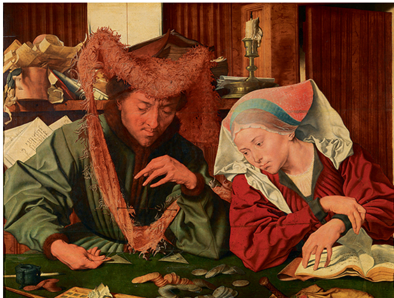
Мариус ван Роймерсваль. «Меняла с женой». 1539 г.