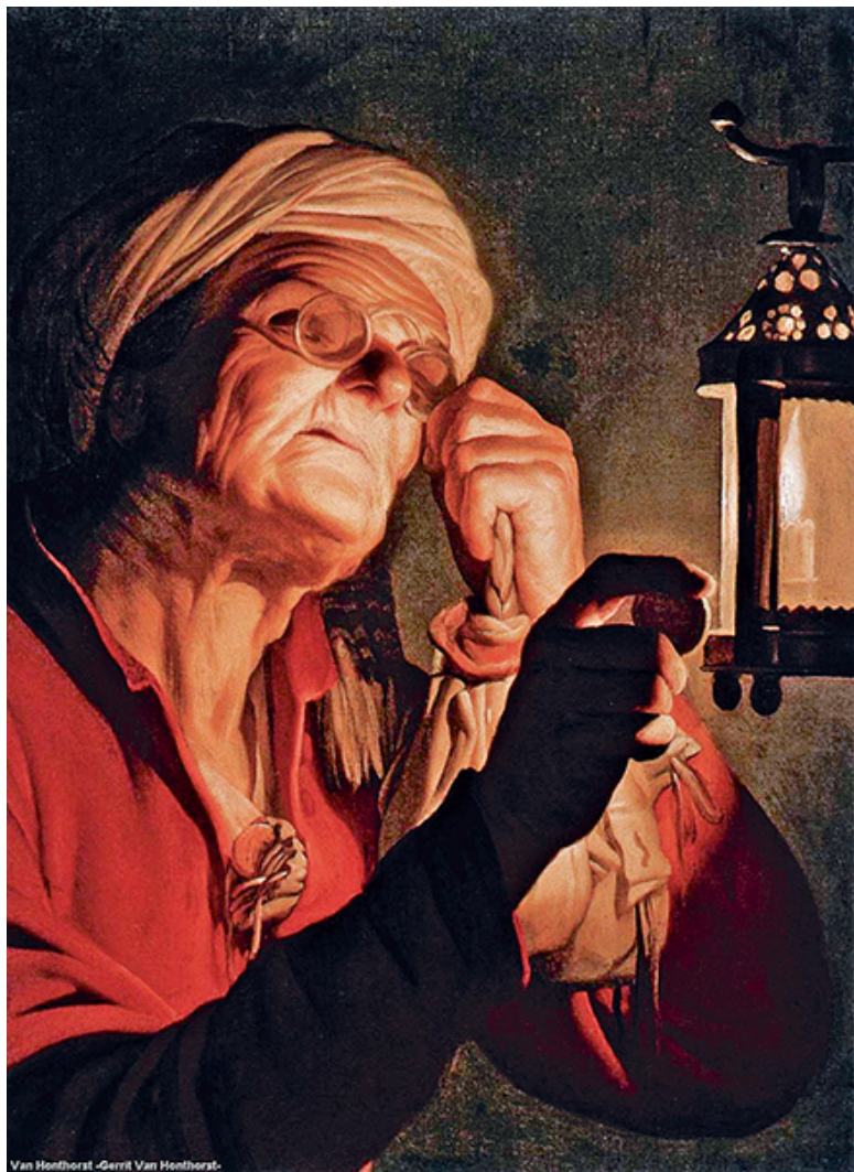
Van Honthorst - Gerrit Van Honthorst