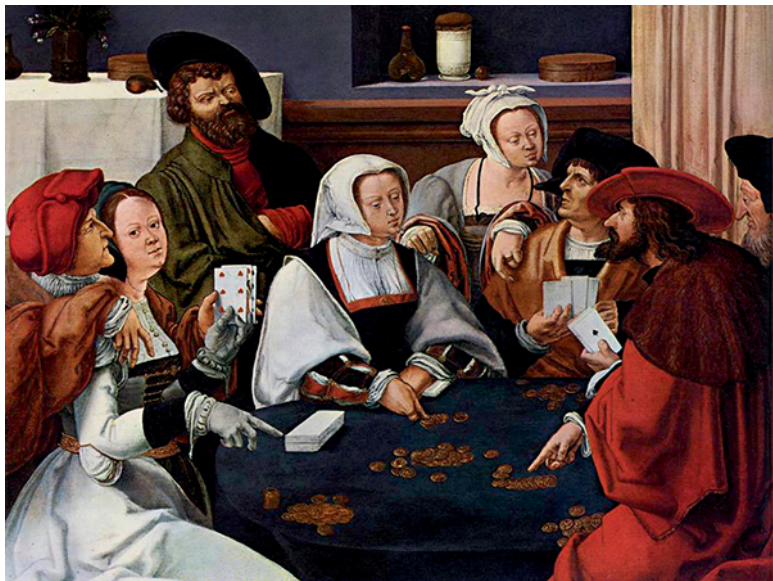
Лукас ван Лейден. «Игра в карты». 1508–1510 гг.

Богатство – это способность в полной мере прочувствовать жизнь.