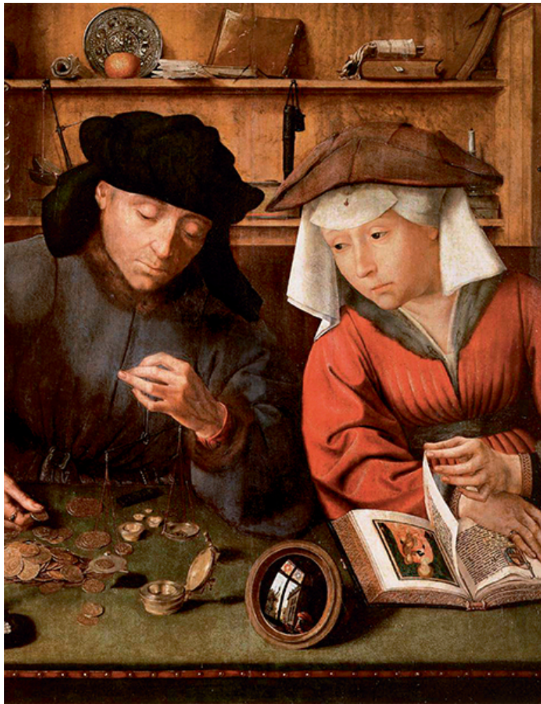
Квентин Массейс. «Ростовщик с женой». 1514 г.