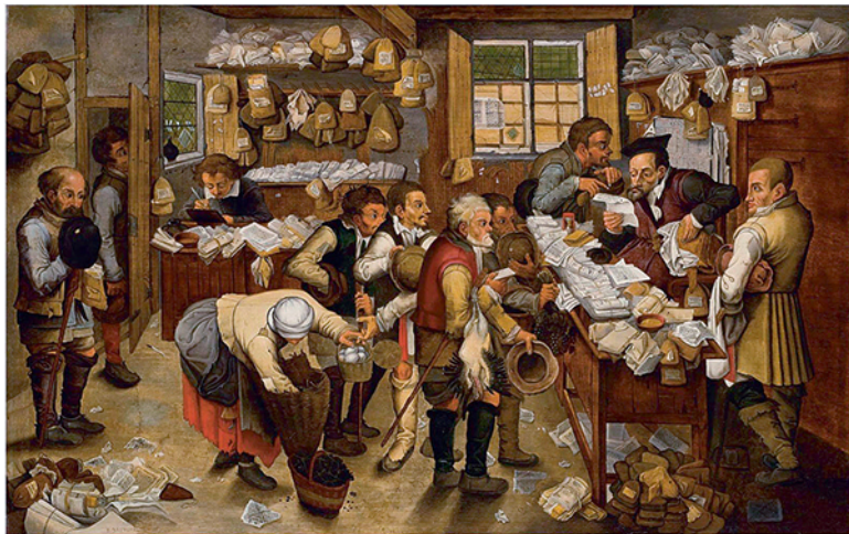
Питер Брейгель (Младший). «Выплата десятины». 1615 г.