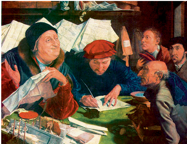
Маринус ван Реймерсвале. «Сборщики податей». 1542 г.