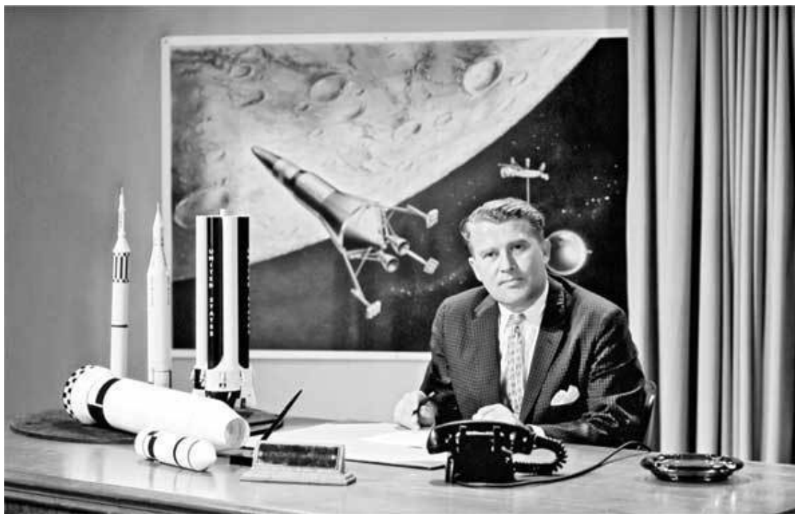
Конструктор ракетно-космической техники, создатель первых баллистических ракет Вернер фон Браун

допущен в Соединенные Штаты. Однако на деле это не всегда последовательно соблюдалось – немецкие ракетные специалисты были столь важны для национальной безопасности США, что на их сотрудничество с нацистским режимом просто закрывали глаза.