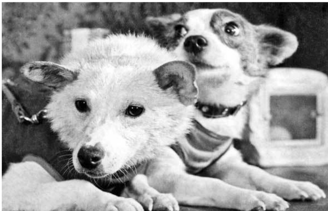
Белка и Стрелка после полета на космическом корабле-спутнике

Однако дочку Кеннеди это не волновало – Пушинка быстро освоилась в Белом доме, научилась кататься с горки и проводила с детьми президента все дни напролет. А когда за дочкой Стрелки стал ухаживать местный вельш-терьер Чарли и у Пушинки появились щенки, радости детей вообще не было предела. Сам Джон Кеннеди прозвал щенков Пуппиками, соединив начало английского PUPPY и окончание русского слова «Спутник». Всех Пуппиков раздали друзьям президентской семьи, поэтому можно с полной уверенностью говорить, что потомки Стрелки живут в США и поныне.