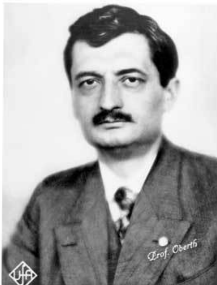
Один из основоположников современной ракетной техники Герман Оберт

А в 1937 году, спустя два года после смерти Циолковского, в нацистской Германии, руководители которой мнили себя будущими хозяевами мира, стартовала крупномасштабная ракетная программа. Для этого на балтийском побережье в Пенемюнде создаются конструкторское бюро и ракетный полигон под руководством теперь уже генерала Вальтера Дорнбергера. Ведущим специалистом в Пенемюнде стал дослужившийся до штурмбаннфюрера СС Вернер фон Браун.