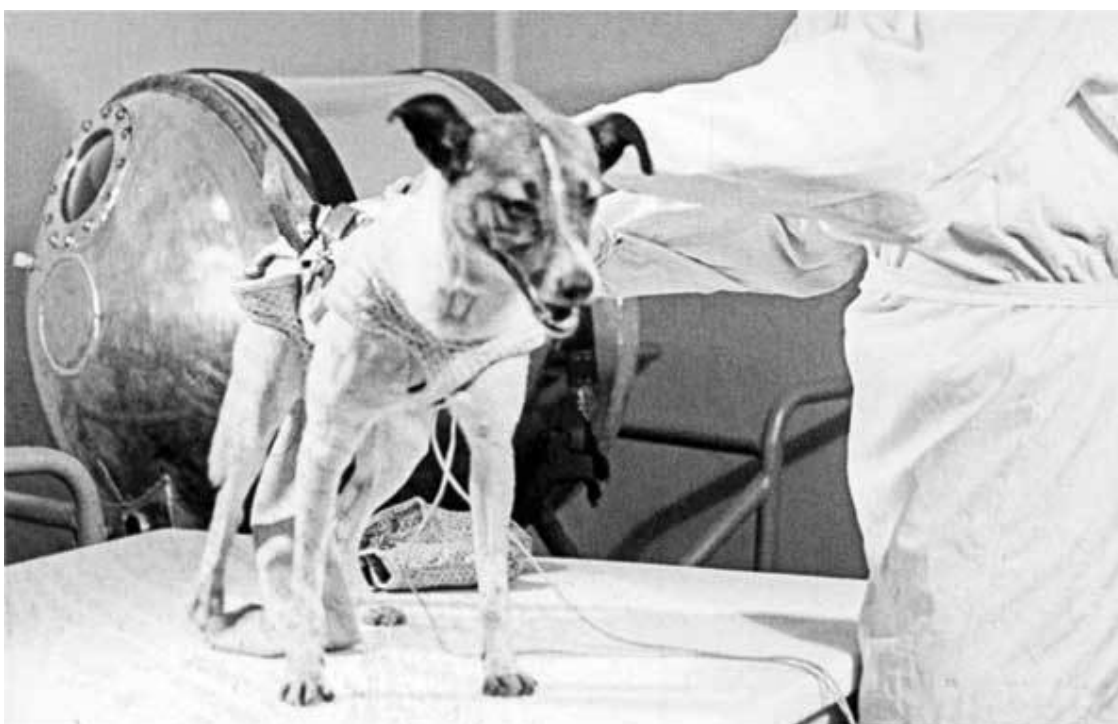
Собака лайка, отправившаяся в космическое пространство на втором советском искусственном спутнике Земли

4 октября 1957 года мир облетела сенсационная новость: Советский Союз запустил на орбиту первый в истории искусственный спутник Земли. На его борту находился бездушный радиопередатчик. Но уже через месяц второй искусственный спутник Земли отправился на орбиту с пассажиром.