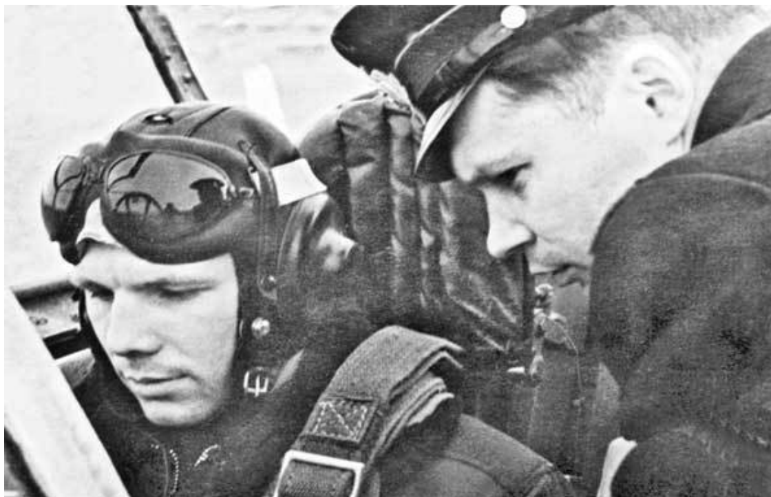
Лейтенант Ю. Гагарин (слева) в самолете во время службы в Заполярье