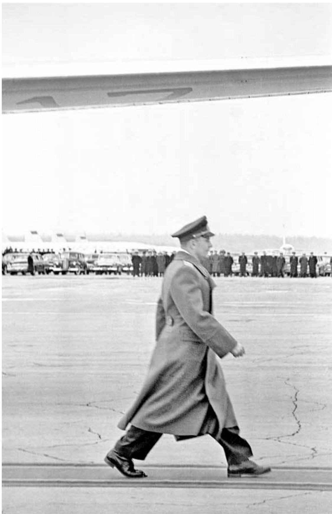
Ю. Гагарин направляется для доклада первому секретарю ЦК КПСС Н. С. Хрущеву о завершении полета. Внуковский аэродром. 14 апреля 1961 года