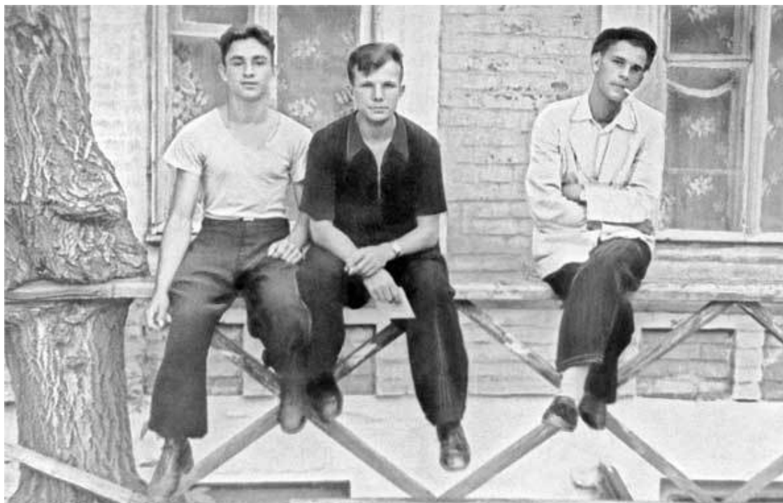
Ю. Гагарин (в центре) – учащийся Саратовского индустриального техникума с друзьями

После окончания авиационного училища Гагарин по собственному выбору был отправлен в Заполярье в одну из авиационных частей Северного флота. Возможно, он так и остался бы там, но тут среди молодых летчиков-истребителей в летных частях в режиме полной секретности начали отбирать кандидатов для первой группы космонавтов. Среди отобранных был и летчик-космонавт Виктор Горбатко, который вспоминает, что существовали некоторые ограничения: вес не больше 70 кг, рост не больше 172 см. Кроме того, нужны были положительные рекомендации командования, политотдела и медицины.