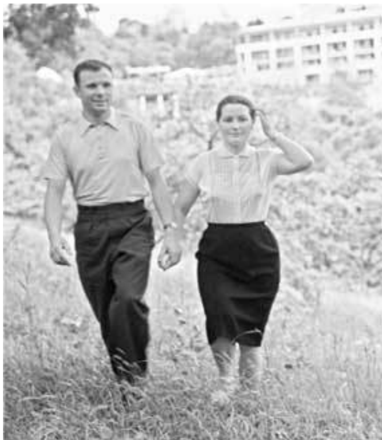
Первый в мире космонавт Ю. Гагарин с женой Валентиной на отдыхе

Пальто демисезонное. Пальто легкое летнее. Плащ. Костюмы – 2 (светлый и темный). Обувь – 2 пары (черные и светлые). Рубашки белые – 6 штук. Шляпы – 2. Носки – 6 пар. Белье нижнее шелковое – 6 пар. Трусы, майки – 6 пар. Платки носовые – 12 штук. Галстуки – 6 шт. Перчатки – 1 пара. Электробритва – 1. Два комплекта военного обмундирования (парадное и повседневное). Чемоданы – 2».