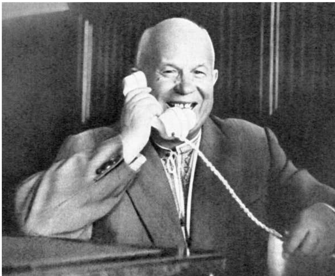
Н. С. Хрущев говорит по телефону с первым космонавтом планеты Юрием Гагариным

На следующий день, 13 апреля, на самолете первого космонавта привезли в аэропорт Внуково, где его встречали чуть ли не все руководство страны, журналисты и кинооператоры. Первоначально грандиозная встреча в Москве не планировалась, но в последний момент решение об этом принял Никита Хрущев. Он был готов носить на руках первого покорителя космоса, потому что он опередил американцев. По словам его сына, Никита Сергеевич позвонил министру обороны Малиновскому и сказал, что Гагарина нужно повесить в воинском звании. Малиновский ответил, что старший лейтенант Гагарин может рассчитывать на капитана, на что Хрущев заметил: «Да не будь ты таким жадным!» И тогда министр обороны сказал: «Ну ладно – майора».