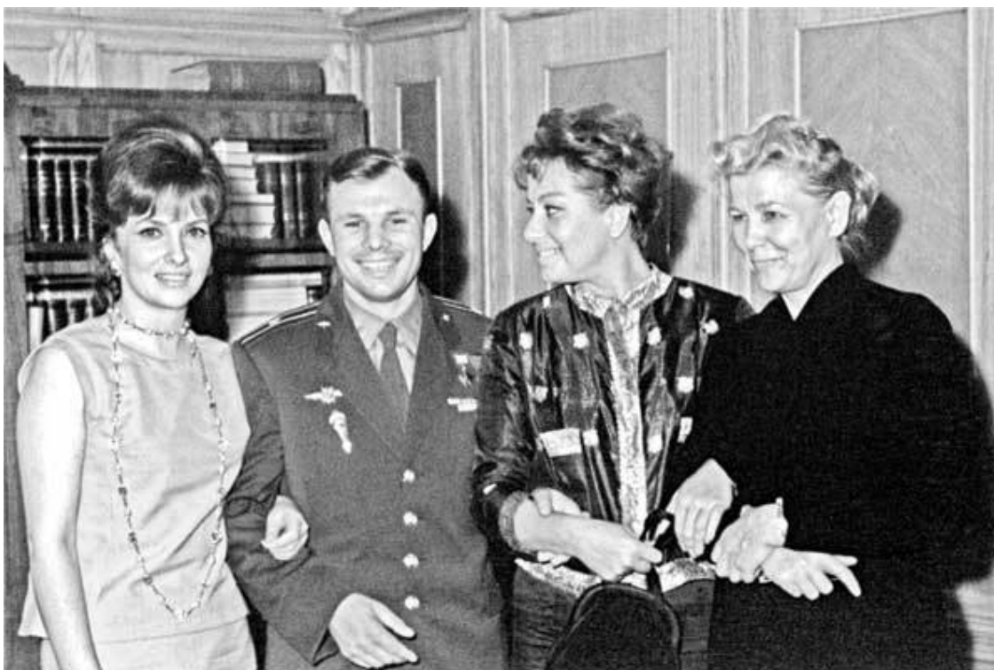
Джина Лоллобриджида (слева) и Мариза Мерлини (вторая справа) во время приема в Министерстве культуры СССР с космонавтом Ю. Гагариным

А популярности Гагарина мог бы позавидовать самый публичный человек планеты. На космонавта свалилось невероятное количество встреч, визитов, дипломатических приемов и командировок. Перед глазами мелькали лица президентов, премьеров и простых людей разных рас и национальностей. Жизнь полетела с космической скоростью. К живой легенде хотели прикоснуться все – Че Гевара и Фидель Кастро, Джина Лоллобриджида и королева Елизавета. А ведь до этого простой деревенский парень Юра Гагарин читал о королях разве что в сказках. А после приема в Букингемском дворце, прорывая полицейское оцепление, к Гагарину с карандашами и блокнотами в руках, чтобы взять автограф, подбежала целая толпа британских школьников.