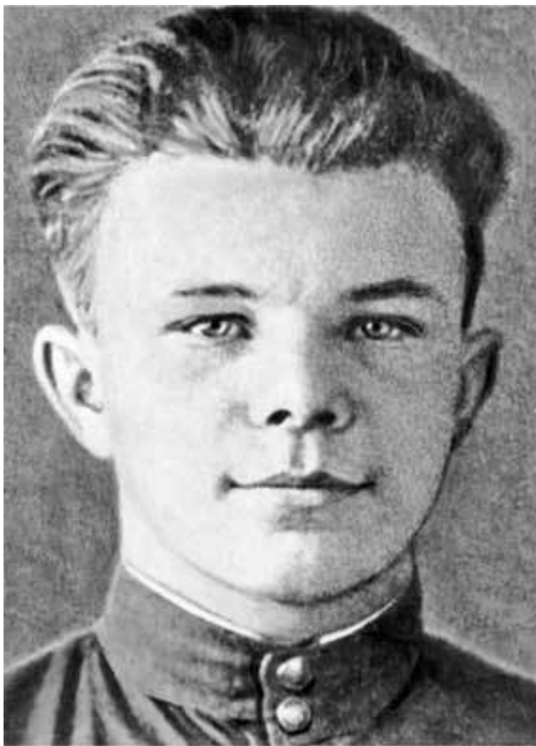
Ю. Гагарин во время учебы в Люберецком ремесленном училище № 10