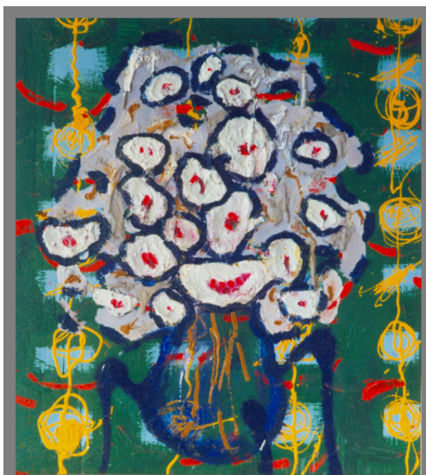
«Селекция №16» 1997г. 65×45 смеш.тех.