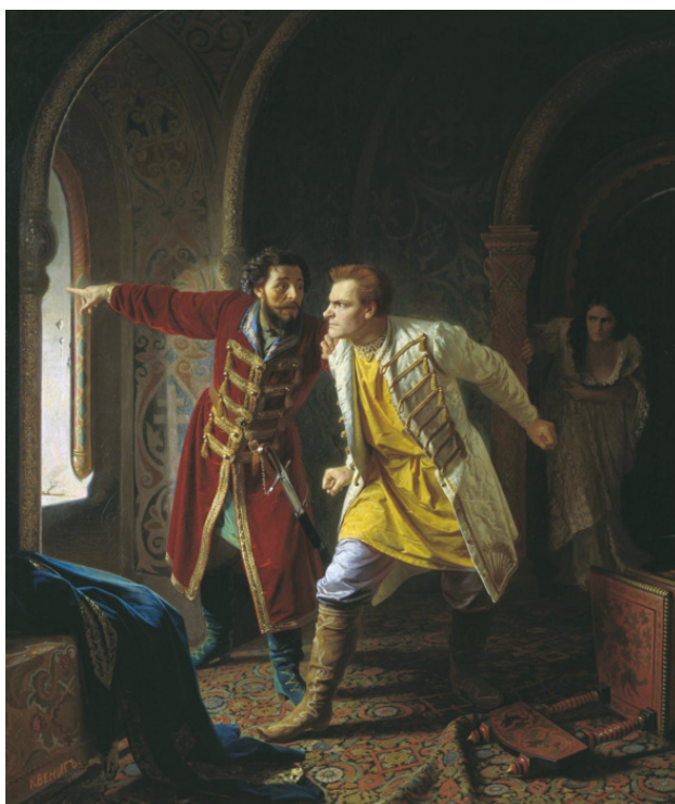
Карл Вениг. Последние минуты самозванца Дмитрия

Никакого бунта и мятежа народных масс в Угличе не было. Все беспорядки, описанные в следственных документах, происходили в Москве. Там действительно был бунт, народное возмущение, в результате которого Лжедмитрий I выбросился из окна.