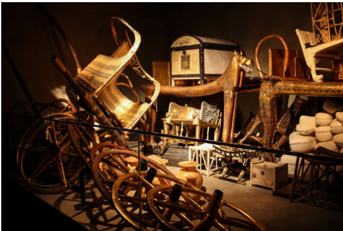
Сокровища в передней комнате

Сменялись эпохи, рождались и гибли империи... Половина истории человечества миновала! А эта гробница была замурована и хранила прикосновения людей, даже память о которых давно растворилась в бесконечной череде веков.