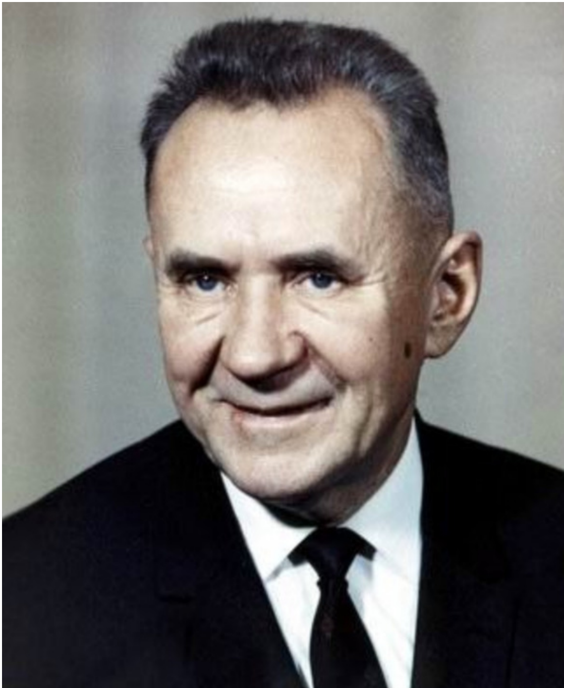
Косыгин Алексей Николаевич