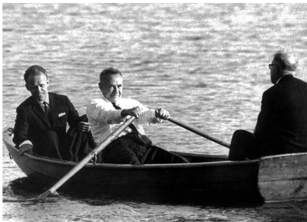
Косыгин Алексей Николаевич