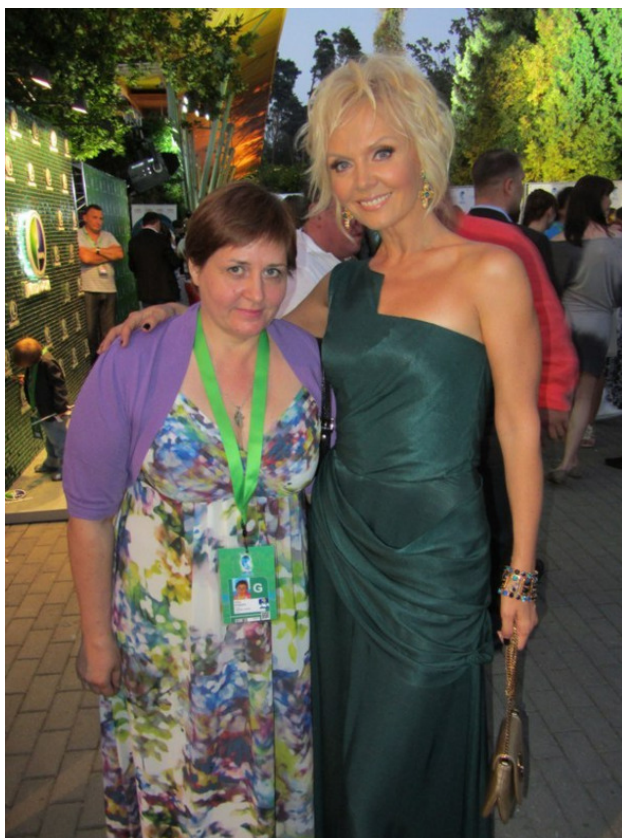
С певицей Валерией. Юрмала 2012 год.