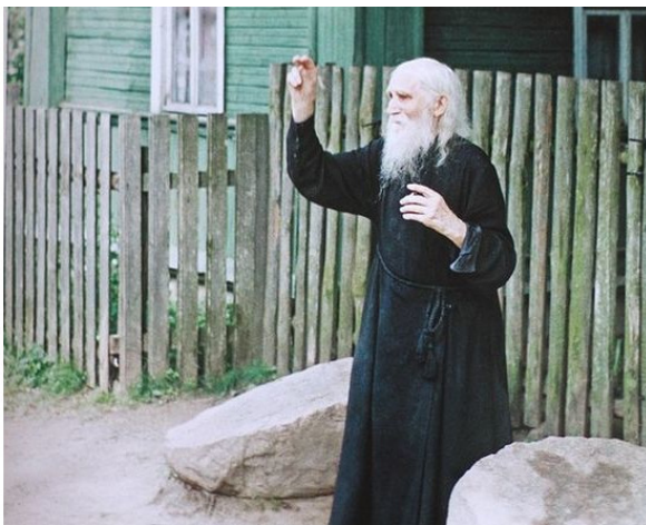
Старец Николай Гурьянов.

Кто такой старец? В сознании православных верующих – это высшее духовное звание, но не по внешней церковной иерархии, а по иерархии благодатности, указывающей на предельную для человека близость к Богу.