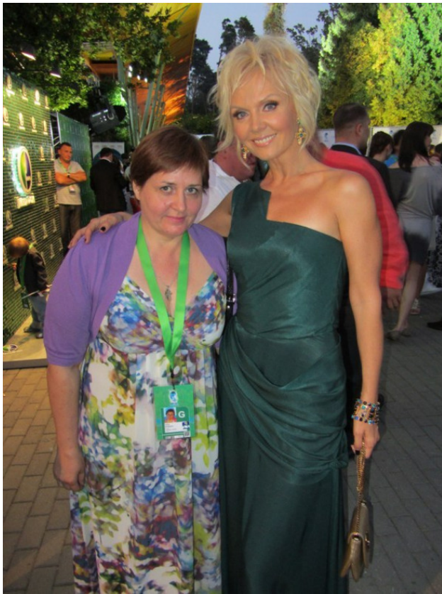
С певицей Валерией. Юрмала 2012 год.