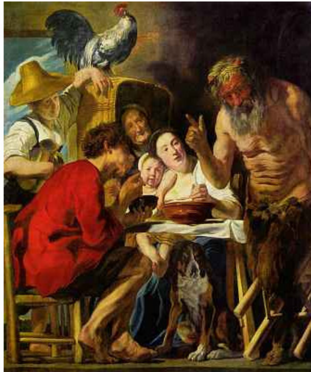
Якоб Йорданс Сатир у крестьянина

То сомненье мной зачато, Прямо в яблоке, ребята, Как начало всех начал, Взял сомненье и зачал.