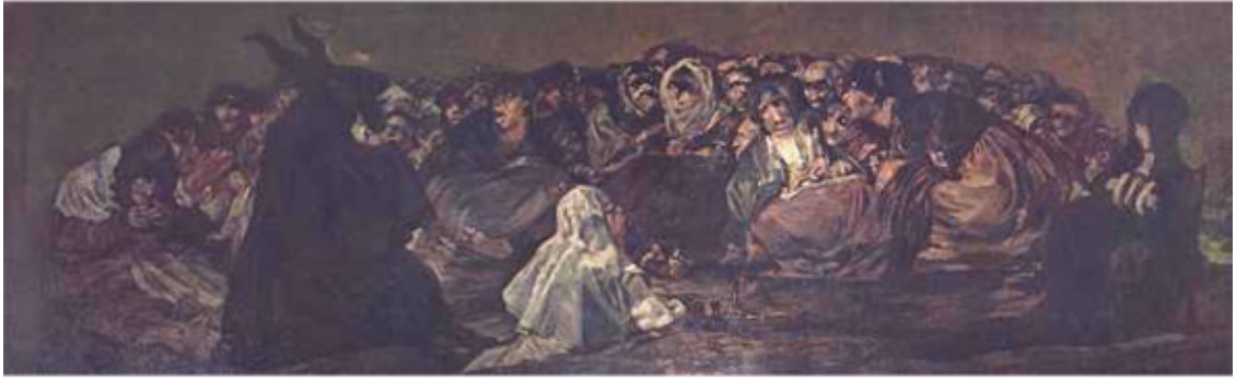
Гойя Шабаш ведьм

На Земле без упрежденья, Без потопа, изверженья, В летний полдень, в воскресенье, Пелена падёт с народа, Свет с восхода до захода.