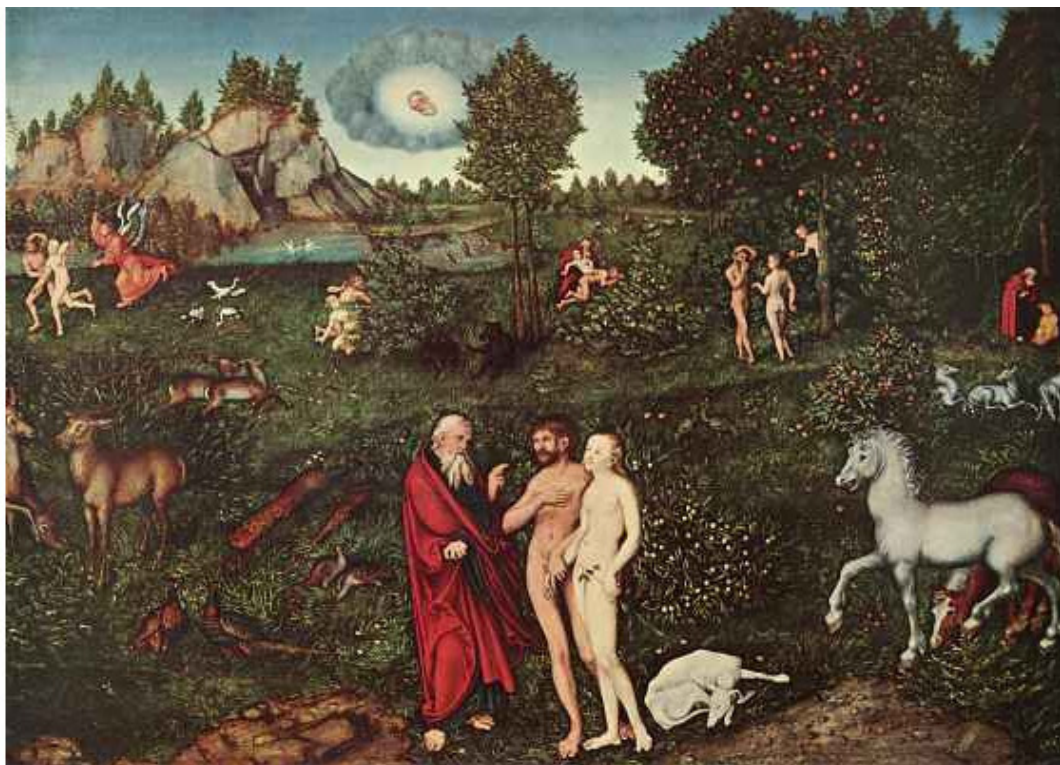
Лукас Кранах Адам и Ева в райском саду

Обрѣк Господь весь род людской На совершенство и любовь. Потом уж с злобой и с тоской Родиться будут вновь и вновь.