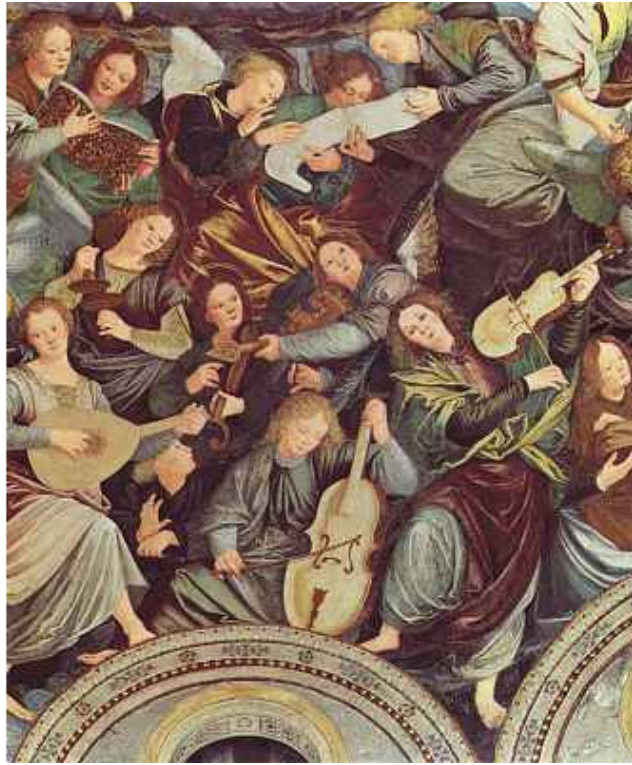
Ф. Гауденцио Музыцирующие ангелы

Утром, нету приказаний По устройству мироздания, Соберутся в райских кушах, Состязаются, кто лучше Аллилуйя пропоёт. Изощрённый в музыке народ!