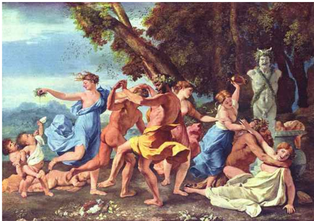
Никола Пуссен Вакханалия

Ангелы, кто женским полом, Упрекают произволом, Не хотят в Раю служить, А бегут на землю жить.