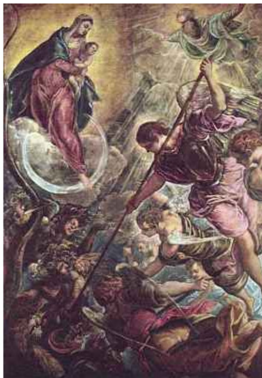
Тинторетто Битва архангела Гавриила с Сатаной

Обоснуйся капитально в мире новом И запомни, должен взять ты за основу Против Бога антитезу всяких дел. Приговор шатать не стоит – твой удел.