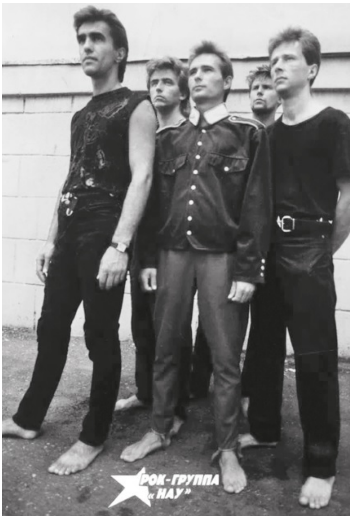
Плакат образца 1988 года