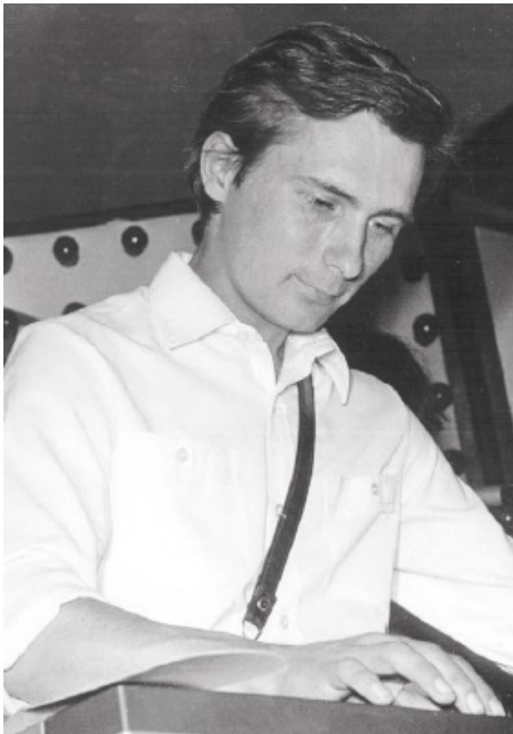
Виктор «Пифа» Комаров на концерте в Челябинске, 1985 год.

позволить себе живые барабаны в этих условиях. Так что new wave была для нас идеальным форматом».