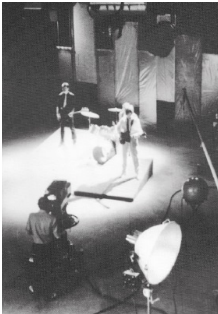
Съемки на телевидении, 1984 год

ский шлягер назывался «Снежная пыль». На фоне немудрящих спецэффектов полуподпольные рокеры выглядели беззащитными и нестрашными.