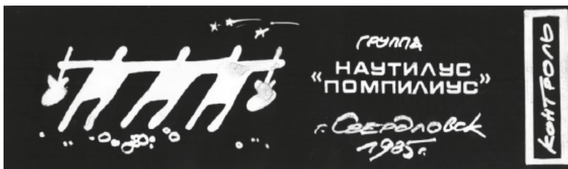
Билет на концерт в ДК МЖК. Оформление Ильдара Зиганшина

Концерт наметили на 26 октября. Особо о нем не распространялись, но не из-за суперподпольности. Зал был маленький, с крохотным балкончиком, и все желающие не смогли бы войти физически. В Архе изготовили фотоспособом 150 билетов с тремя стилизованными фигурками. Когда число зрителей перевалило за две сотни, контролеры на входе почуяли подвох. Скрупулезное сличение заведомо подлинных билетов с подозрительными доказало, что преподавание графики в архитектурном институте было на высоте. Проходки подделывали не только с помощью фотоувеличителя, но и виртуозно рисуя те самые фигурки на какой-то лощеной бумаге. Видимо, групп фальшивобилетчиков было несколько, и до момента разоблачения они с помощью своей продукции успели плотно набить зал.