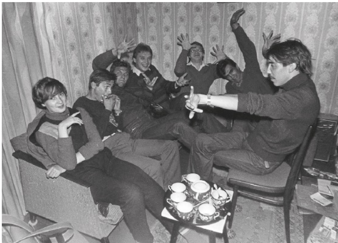
«Наутилус Помпилиус» и «Урфин Джюс», 1985 год