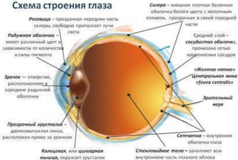
Схема строения глаза

В передней части глаза, напротив роговицы, сосудистая оболочка переходит в радужную , которая может иметь различный цвет – от светло-голубого до черного. Он определяется количеством и составом содержащегося в этой оболочке пигмента.