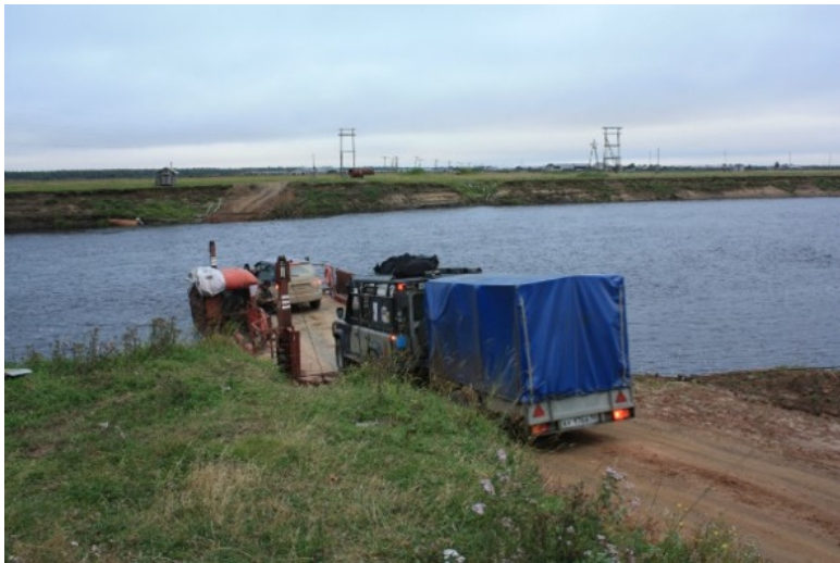
Паром у Бычья.

что начинать придется ниже, в Бычье не проехать. Но теперь вода слегка спала. У Бычья скошенные луга и поставлено сено, что не может не радовать глаз. Но дорога портится настолько, что на нашей машине – «Ссанг Йонге» – включаем полный привод. Пёза здесь полноводна, а паром у Бычья совсем маленький, наши две машины («Деф» -то с прицепом) входят с трудом.