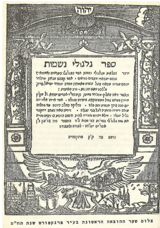
Сефер а-Гилгулим р. де-Панно

Р. Азария де-Панно, Перевоплощения, или Гилгулим