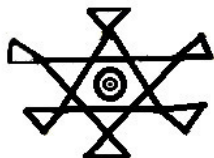
Рисунок 2: «Андаум» – всегда начертается белым цветом.

Он так же изображен на синем флаге фархадов.