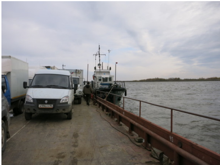
Баржа на Оби

Через 40 минут подпрыгивания на неровностях грунтовок Игрим – Нарыкары мы на барже, призванной за 10 часов преодолеть 100 километров вверх по Оби.