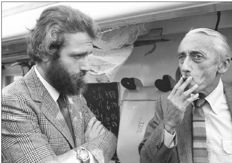
Филипп и Жак Ив Кусто