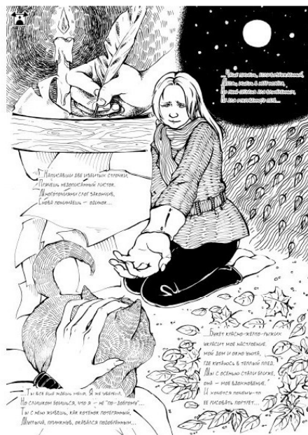
Иллюстрация Влады Аксёновой к стихотворениям Светланы Алькиной для сборника «Верлибр», 2015 г.

Светлана – из тех молодых людей, которые удивляют нас своеобразием и неповторимостью своего внутреннего мира. Прочитав подборку ее произведений, я представила Светлану непредсказуемой рыжей осенью, как и в ее стихах: