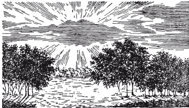
Рис. 4. Расходящиеся лучи от спрятанного за облаком солнца

– Что вы? Разве не случалось вам видеть расходящиеся лучи от спрятанного за облаком солнца? Тогда можно воочию убедиться, как сильно расходятся солнечные лучи. Тень дирижабля должна быть значительно больше дирижабля, как тень облака больше самого облака.