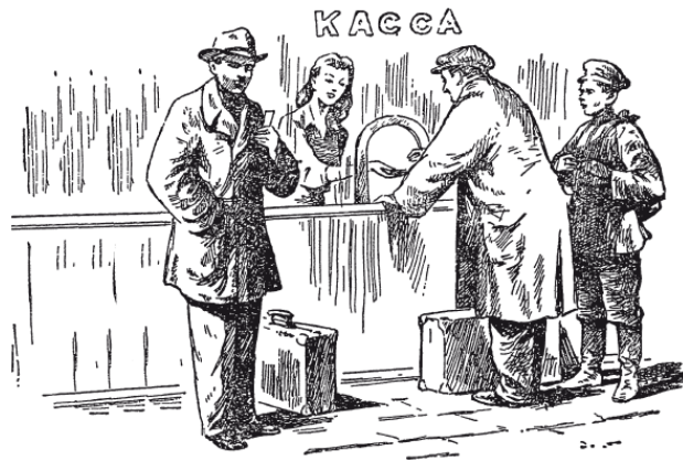
Рис. 3. «Продаю железнодорожные билеты»

– Представьте, что вполне возможно. Дед доказал мне это. Сколько же лет было каждому из нас?