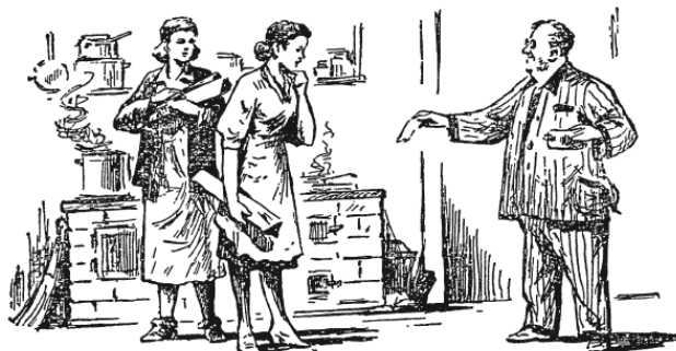
Рис. 2. «В возмещение расходов он уплатил соседкам 8 рублей»

– Ну нет, – возразил другой, – надо принять в соображение, как участвовали в этом огне дровяные вложения гражданок. Кто дал 3 полена, должен получить 3 рубля; кто дал 5 поленьев, получает 5 рублей. Вот это будет справедливый делёж.