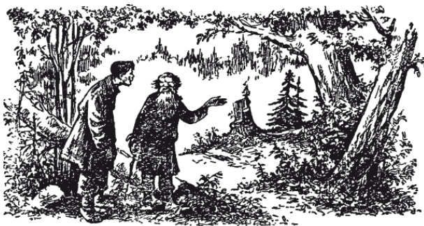
Рис. 5. Старик повёл крестьянина в глубь леса

Заглянул крестьянин в кошелёк, и что же? – деньги в самом деле удвоились! Отсчитал из них старику обещанные 1 руб. 20 коп. и попросил засунуть кошелёк вторично под чудодейственный пенёк.