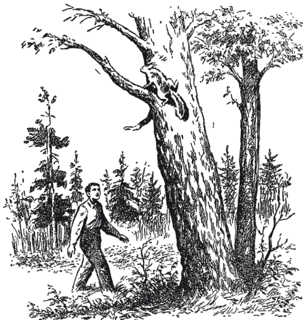
Рис. 1. «Плутовка отступала в обратную сторону»

– Конечно, как и Земля вокруг оси. Вообразите, однако, что вращение Солнца совершается медленнее, а именно что оно делает один оборот не в 26 суток, а в 365\frac{1}{4} суток, то есть в год. Тогда Солнце было бы обращено к Земле всегда одной и той же своей стороной; противоположной половине, «спиной» Солнца, мы никогда не видели бы. Но разве стал бы кто-нибудь утверждать из-за этого, что Земля не кружится вокруг Солнца?